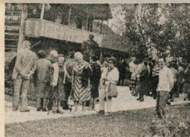
Ne le Titova rojstna hiša, tudi vsa okolica je vredna ogleda. Počasi bo tu zrasel pravi stari Kumrovec.

Le prehitro je bilo treba oditi. Vlak se ni obotavljal. Kmalu po četrti uri popoldne je zažvižgal od novega hotela Atomske toplice sem. Nazaj grede je bilo šele veselo! Zágorsko vince je naredilo svoje. Ste že slišali, da bi pel cel vlak hkrati? No, pri nas je bilo tako veselo! D. Dolenc