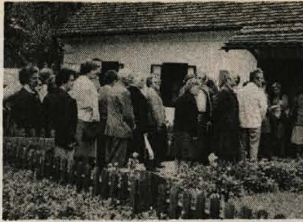
Pred Titovo rojstno hišo se je naredila vrsta, kajti vsak si je hotel od blizu ogledati Jožkovo zibko, mamine burkle in številne dokumente, ki govorijo o življenju in delu našega Tita.