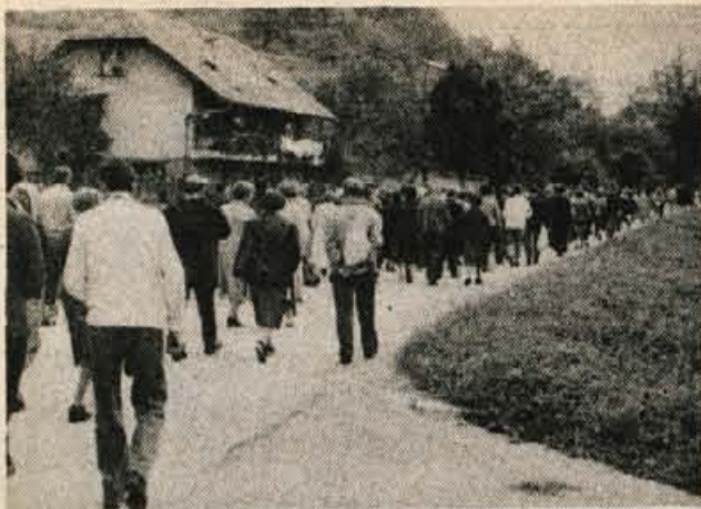
Od železniške postaje do Titove rojstne hiše v Kumrovcu je bilo treba peš. S mo si vsaj od blizu ogledali okoličo in stišali prijeto zagorsko govorico.