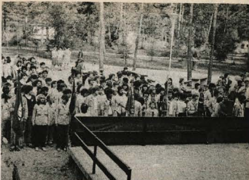
Šobec – Gorenjski brigadirji so se v soboto sestali na drugem shodu brigadirjev na Šobcu. Brigade petih gorenjskih občin so pripravile brigadirski program, zapeli nekaj pesmi in se pogovorili o težavah, ki jih že vrsto let rojeva mladinsko prostovoljno delo. S shoda so predsedstvu zvezne konference socialistične zveze poslali tudi protestno pismo proti izraelskemu nasilju nad palestinskim ljudstvom.

GLASILO SOCIALISTIČNE ZVEZE DELOVNEGA LJUDSTVA ZA GORENJSKO