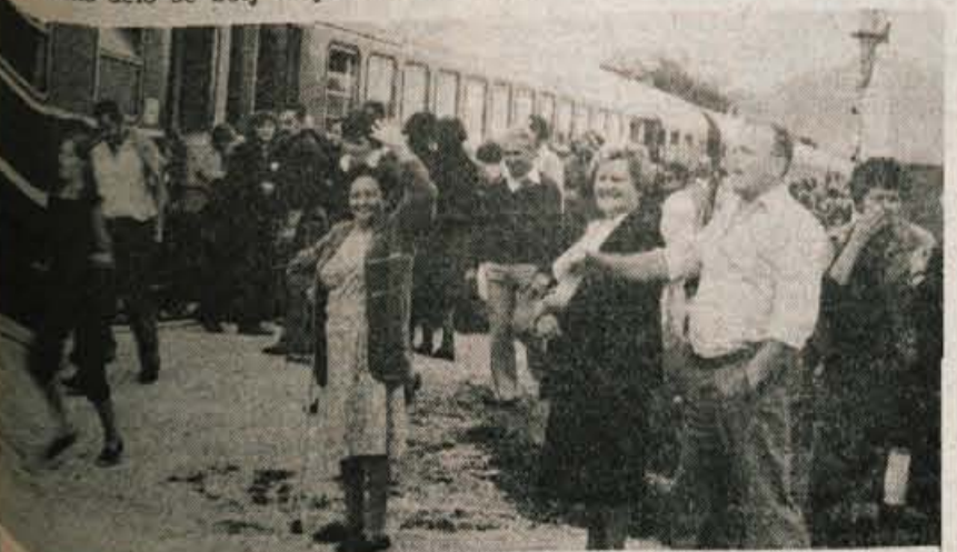
Glasov izlet prvič z vlakom – Naš jesenski izlet naročnikov z vlakom v Kumrovec in Podčetrtek je bil enkrat. Udobna, prijetna vožnja, veselo razpoloženje vsi pot. Veliko lepega in novega smo videli. Le prehitro je bilo treba domov. Več o izletu berite na zadnji strani.