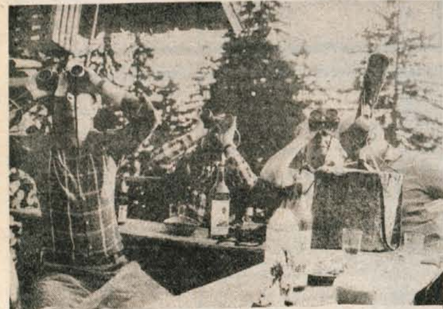
Firbec pa tak... — Kaj menite, kaj so ugledali tle daljnogledarji v planini Tegošče, da tako v eno mero zijajo tja gor? Kozoroge ali — kiklo? Verjeli ali ne, bila je kikla, pa čeprav se je kakšnih trideset kozorogov tisti čas zares paslo tam za zadnjimi smrekami.

Na tem mitingu bodo nastopili tudi mladinci in pionirji, tako da bo današnji atletski spored res pisan in še kvaliteten. Danes od 15. ure naprej se na stadionu Stanka Mlakarja obeta res pravi mednarodni atletski praznik, ki bo pogoj še z dobrimi atletskimi predstavami v vseh disciplinah. -dh