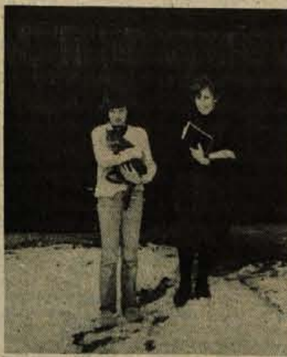
Na Suhadolnikovi kmetiji, eni najvišjih v dolini Kokre, bo spomladi zasvetila močnejša električna luč. Elektriko bo iz doline pripeljala v veliki meri tudi solidarnost krajanov in pomoč celotne družbe

Seveda pa napeljava elektrike iz doline Kokre do tri kilometre oddaljene Suhadolnikove domačije sploh ni poceni zadeva. Predračun, ki so ga pripravili na Elektro Kranj je segal sprva krepko čez milijon novih din, vendar pa kaže, da se bo tudi Elektro Kranj priključil soli-