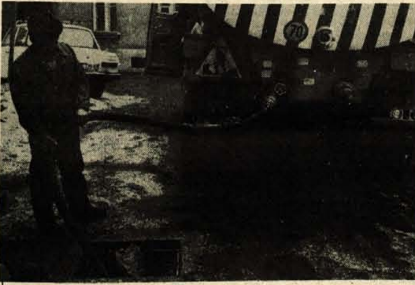
Kranj - Komunaleci imajo te dni, ko je zapadel nov sneg, polne roke dela. Zaradi hudega mraza so pa na več koncih Kranja zamrzli kanalizacijski odtoki. Tako je bilo tudi v Tomšičevi ulici v Kranju, kjer so morali delavci komunale s črpalkami črpati vodo iz jaškov. Na mimogrede, tiste pokrove kanalizacije, zaradi katerih smo jih zadnji večerni v GLASU, so popravili že takoj naslednji dan.

Po uvodnem šegavem govoru se je začelo tekmovanje, najprej igre brez meja ob meji. Prvo mesto so osvojili rovtarji pred bajtarji in Španovim vrhom. Nato se je začelo pravo tekmovanje za trofej svinjska glava.