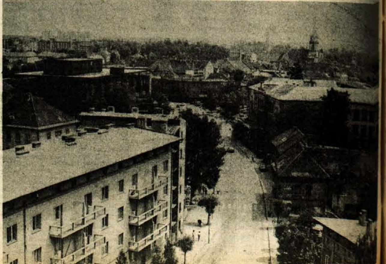
Kranj umazano mesto