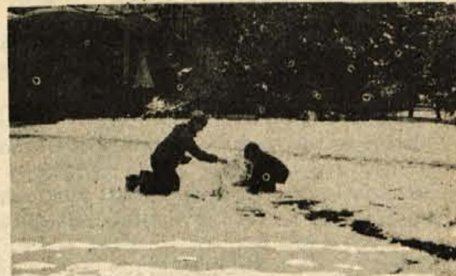
Bo dovolj za celega sneženega moža?