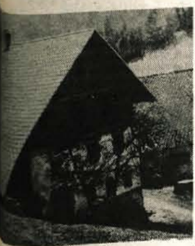
urha se je odločil, da prenovi pejal z veliko mero posluha starnosti in njegova hiša bo brez mikovna.