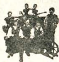
SLOVENIJA ANSAMBEL SLOVENIJA