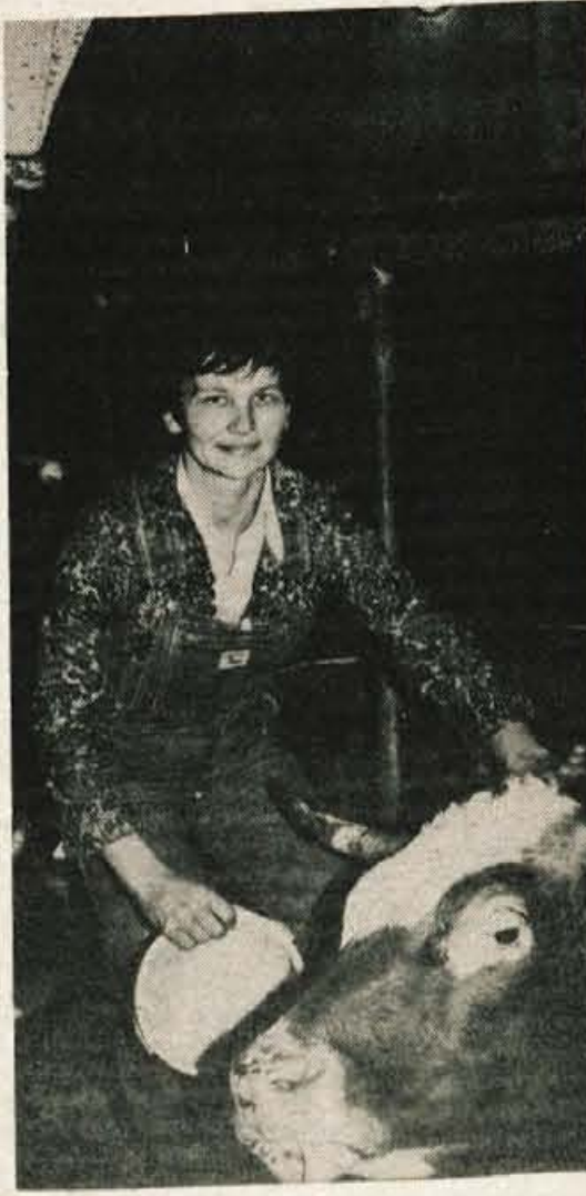
Ne samo v hlevu in pri strojih, temveč tudi drugod. Čez nekaj dni se bodo selili v novo hišo, ki sta jo z izredno iznajdljivostjo in ročnostjo v veliki meri sajna uredila in opremila.