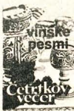
ČETRTKOV VEČER VINSKE PESMI