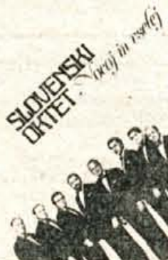
SLOVENSKI OKTET NOCJOJ IN VSELEJ