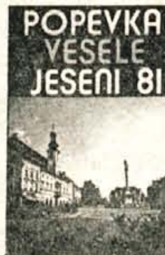
POPEVKA VESELE JESENI '81