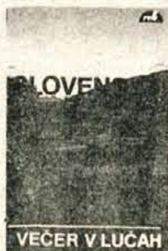
SLOVENSKA ZEMLJA V PESMI IN BESEDI