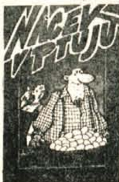
NACEK V PTUJU