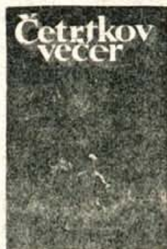
ČETRTKOV VEČER TEBI MATI