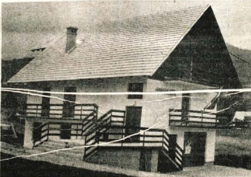
Nov gasilski dom, ki so ga odprli letos, je precejšnija pridobitev

ker so se pred letom dni odločili za krajevni samoprispevek. Dela je izvajalo Gradbeno podjetje Bohinj, asfalt pa so naročili pri Slovenija-cesta. 6.000 kvadratnih metrov krajevnih cest je danes lažje prevoznih, vrednost del pa je bila 2 milijona 230.000 dinarjev, od tega so precejšnjo sredstva namenili predvsem iz samoprispevka, del sredstev je prispevala krajevna skupnost, nekaj pa bohinjske in druge delovne organizacije. Počasi, v prihodnjih letih naj bi asfaltirali še ostale poti, predvsem pa si želijo, da bi poskrbeli za štiri kilometre makadama glavne ceste, po kateri je tako pozimi kot poleti precejšen promet.