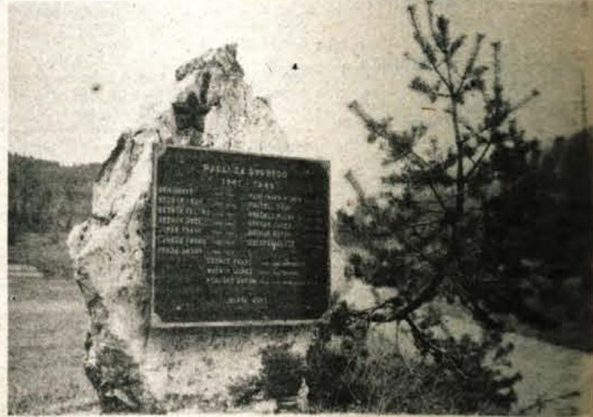
Obležje padlim na Gorjušah

Cestno podjetje Kranj je letos asfaltiralo šest kilometrov dolgo cesto od Jereke do Koprivnika, vendar je bilo v interesu vseh krajanov, da bi dobili asfaltno prevleko tudi mimo Koprivnika in Gorjuš ter dalje proti Pokljuki. Čeprav jih makadam mimo vasi še precej moti, pa so ob enem veselji asfalta na krajevnih cestah, asfalta, ki so ga dobili zato,