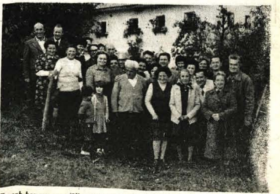
Z vseh koncev so prišli ono nedeljo k Jurčku v Smoldno nekdanji aktivisti in borci Poljanske doline