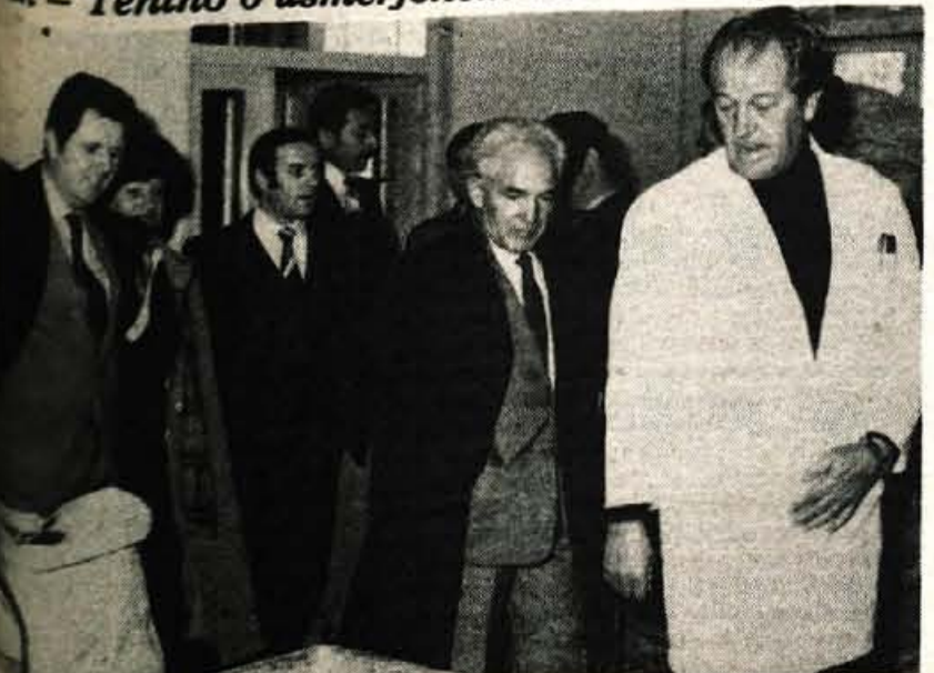
Hafner v Radovljici — Minulo sredo se je mudil v radovljiški občini predsednik republiškega sveta Zveze sindikatov Slovenije Vinko Hafner, ki se sprejeti rekonstrukcijo tovarne čokolade v Lescah pogovarjal o problematiki proizvodnje in izobraževanja stare tovarne.

Predsednik republiškega sveta zveze sindikatov Vinko Hafner na obisku v radovljiški občini — Sprejeti rekonstrukcijo tovarne čokolade v Lescah — Tehtno o usmerjenem izobraževanju