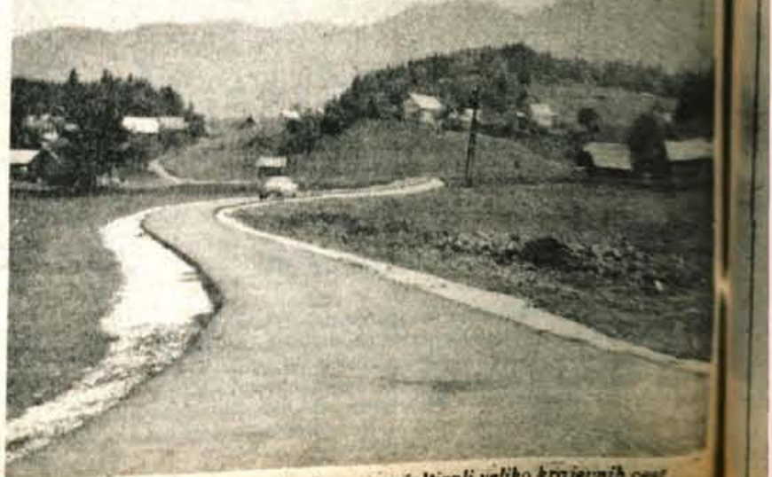
Na Gorjušah in na Koprivniku so asfaltirali veliko krajevnih cest