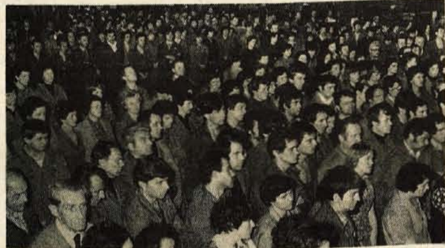
V kranjski Savi, Živilih... so žalni zbori prekinili delo.

Tito je bil človek, ki se je veselil slehernega uspeha, zanimal se je za sleherno področje dela, vedno je bil sposoben dati poleta, vsebine, ustvarjalnosti. Neizčrpen v idejah, ob že tako majhnem problemu ali ob odgovornih odločitvah. Nam in Titu velja tale obljuba: kolikor bomo znali, bomo z delom in odnosom do dela dokazali, da je tudi po Titu Tito in da bo Tito, ideja in stvarnost, vedno živela.»