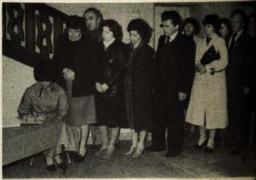
Knjige žalosti in trdnih obljub — »Tvoje ideje in dela bodo vedno živela v nas.« Vztrajali bomo na tvoji poti — to je le delček zapisa iz žalnih knjig, ki so jih v ponedeljek zjutraj odprli v vseh skupščinah občin in kamor občani z bolečino v srcu, toda z vero vase in obljubo Titu zapisujejo to, kar v teh hudih trenutkih doživljajo. Knjige žalosti so odprli tudi v večini večjih delovnih organizacij in nekaterih krajevnih skupnostih: v vseh knjigah žalosti pa so zapisane prisege, da bomo vztrajali na Titovi poti.

Radovljiška mladina je obmolknila v vseh razredih v nemi žalosti in tišini ob uri o tovarišu Titu, mladi pa so nadvse skrbno začeli pripravljati knjižne razstave o Titu po šolskih avlah. Vsi predsedniki pionirskih in mladinskih odredov iz osnovnih šol in predsedniki mladinskih organizacij po srednjih šolah pa so se vpisali v žalno knjigo.