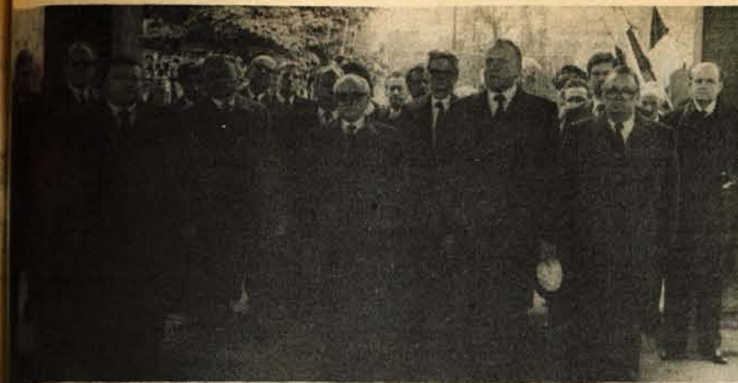
Ljubljanski železniški postaji so se od Tita poslovili predstavniki Slovenije.