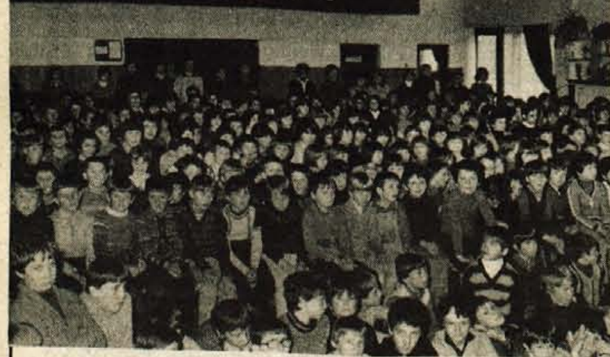
Tudi srca najmlajših so zakrvavela ob smrti velikega vzornika. Solze so polzele po obrazih, ko so prek televizorjev spremljali potovanje krste z dragim predsednikom iz Ljubljane in besede učiteljev, ki so jim pripovedovali o njegovem življenju in delu, v katerega je daroval sebe — za nas. Tako kot v vseh gorenjskih šolah je utihnil običajni živčar tudi v osnovni šoli v Predoslju. ki nosi Titovo ime.

NOVNA SOLA JOSIP BROZ - TITO 1860 - PREDOSLJE - 1973