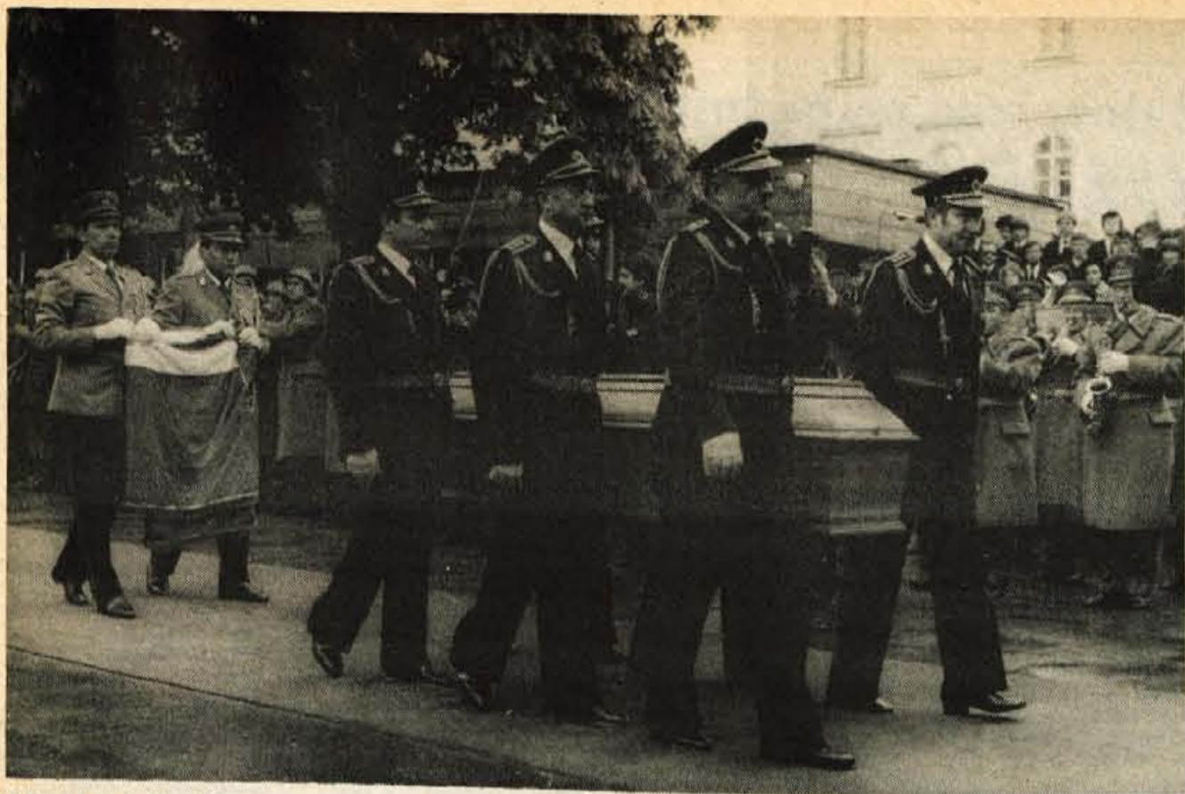
Včeraj se je Ljubljana in vsa Slovenija dostojanstveno poslovila od Tita