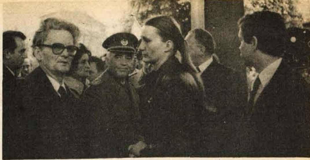
Člani Titove družine