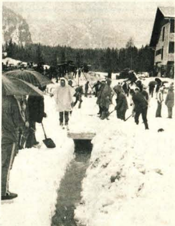
Prizorišče svetovnih obračunov v poletih je v petek kazalo kaj čudno podobo. Dež, ki je lil dva dni je opravil svoje. Hudournik ob izteku letalnice je napravil škodo. Ogromno truda je bilo vloženo, da so hudournik speljali v kanal in uredili iztek letalnice. Ogromno škodo pa je pravečata povoden naredila tudi pred stavbo TV centra. Pod vodo so bili kar štirje avtomobili.

Vreme – Vremenslovci obetajo toplješe vreme, vendar brez sonca in z občasnimi padavinami v nižinah. Najnižje nočne temperature bodo od 2 do 8 stopinj Celzija, najvišje dnevne pa od 10 do 15 stopinj Celzija. D. Sedej