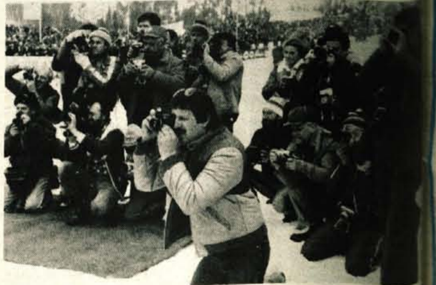
Planica je privabila na stotine novinarjev in fotoreporterjev. Takšno gnečo vladala ob proglatitvi najboljših