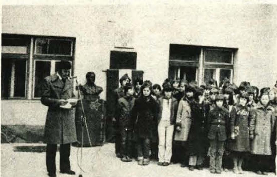
Kamniški pionirji so s kurirčkovo torbo krenili na pot s ploščadi pred tovarno Titan, v kateri je tovariš Tito nekoč delal kot kovinar.