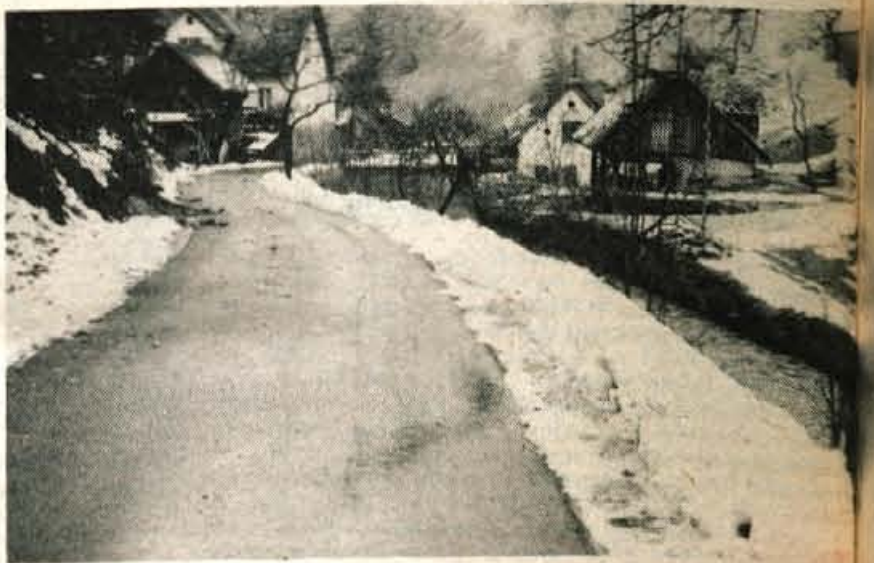
Letos so asfaltirali cesti Krajci-Delnice in Pekalc-Drnovškov mlin

Cesta med Hotovljami in Vinhary je izredno prometna in zato so krajanje Vinhary, Kremenka in Bukovega vrha dali pobudo, da bi jo asfaltirali. Letos so uspeli asfaltirati trak po