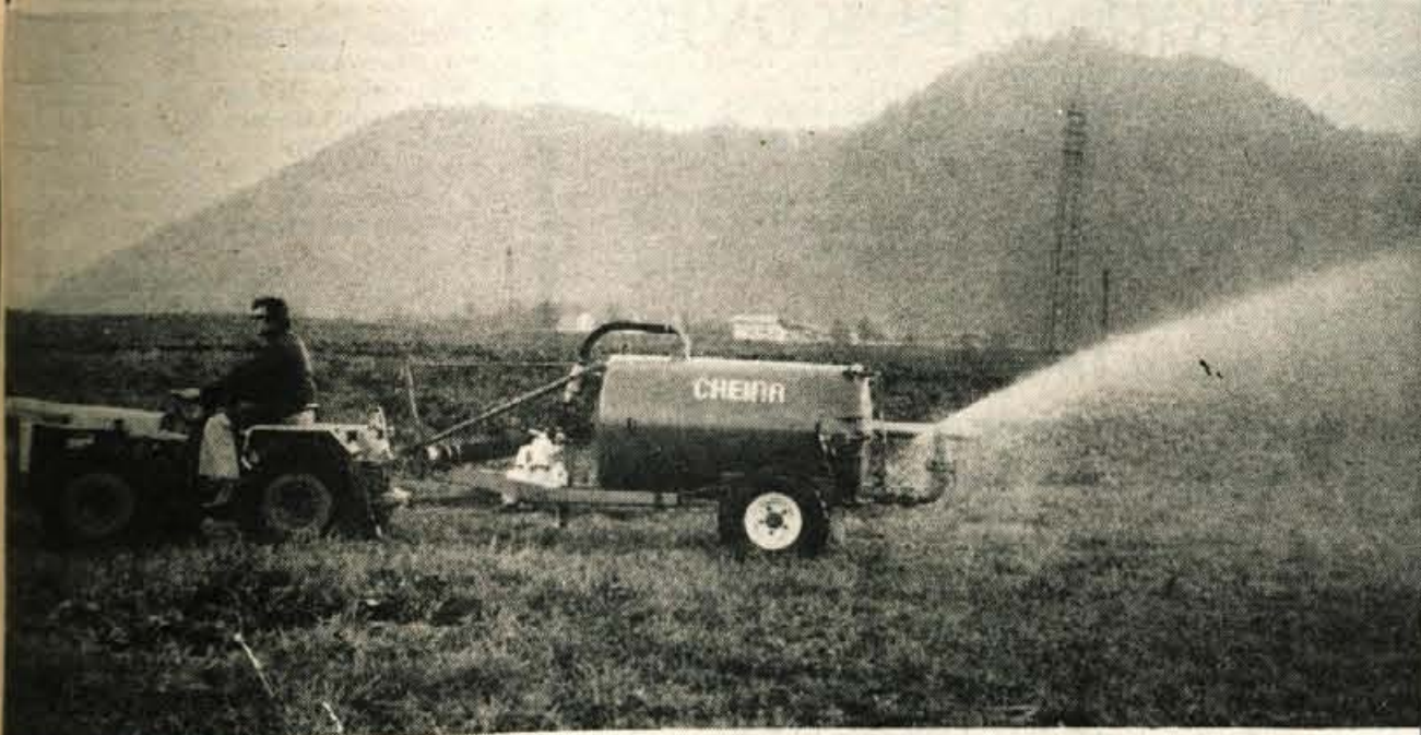
Traktor TV 730 pri delu s cisterno za gnojevko