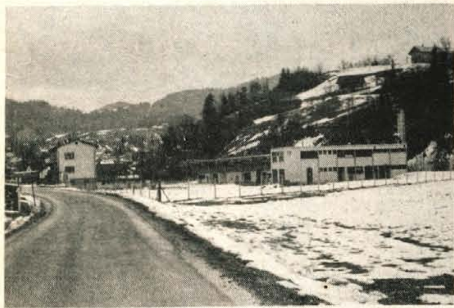
Poleg sedanjih tovarn Termike in LTH v Poljanah naj bi leta 1981 začeli graditi dve novi, v katerih se bo lahko zaposlilo vsaj 300 domačinov.