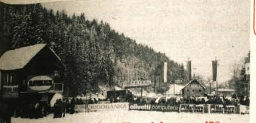
XVIII. Pokal Vitranc Kranjska gora '78