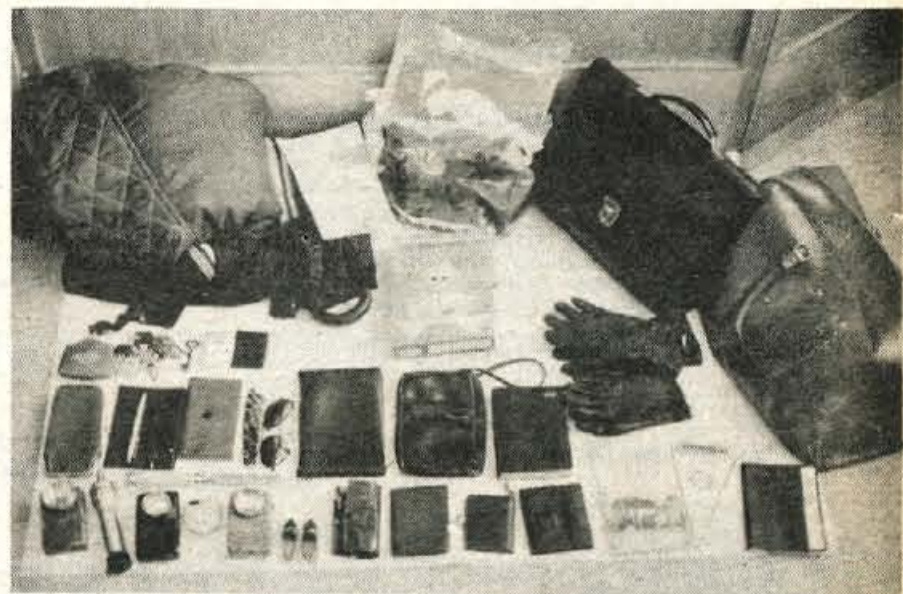
NAJDENI PREDMETI ČAKAJO – Delavci postaje milice Kranj in kriminalisti Uprave javne varnosti so pred kratkim prijeli storilca, pri katerem so našli več različnih predmetov in oblačil. Nekateri so neznanega izvora. Zato postaja milice in UJV Kranj prosita občane, ki predmete pogrešajo, pa izginotja niso prijavili, naj se zglasijo na kranjski ali na najbližji postaji milice. (jk)

Solata 22,30 din, špinača 18 din, cvetača 30 din, korenček 11,10 din, česen 42 din, čebula 6,60 din, fižol 27,50 do 30 din, pesa 7,70 din, kumare 24 din, paprika 35 din, suhe slive 35 din, jabolka 14,25 din, hruške 25,50 din, grozdje 18,20 din, pomaranče 16,30 din, limone 17,75 din, ajdova moka 27,25 din, koruzna moka 7,87 din, kaša 15,53 din, surovo maslo 79 din, smetana 35,70 din, skuta 26,55 din, sladko zelje 8 din, kislo zelje 7,50 din, kislá repa 7,50 din, orehi 165 din, jajčka 1,70 do 2,70 din, krompir 4,90 din