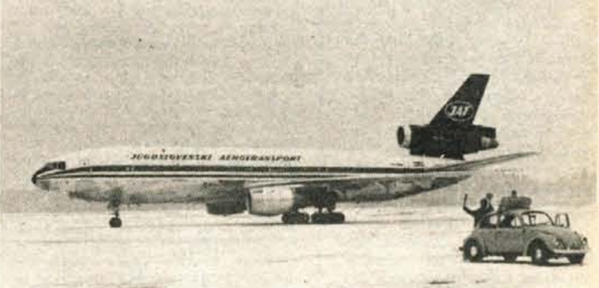
V sredo je na brniškem letališču prvič pristal Jatov DC-10, ki bo od slej enkrat tedensko vzdrževal redno linijo med Beogradom, Ljubljano, in New Yorkom

KRANJ — Ker bo prihodnje leto najverjetneje že veljal v Sloveniji nov davčni sistem, ne kaže družbenega dogovora o usklajevanju davčne politike za prihodnje leto, ki ga sklenejo in medsebojno uskladijo slovenske občine same, preveč spreminjati. Takšnega mnenja je bil izvršni svet kranjske občinske skupščine, do enakega stališča pa so prišli tudi predstavniki davčnih uprav gorenjskih občin. Člani izvršnega sveta so menili, naj davek 0,5 odstotka od osebnega dohodka ostane. Te stopnje pa nikjer ne smejo preseči. Lahko je sicer nižja upoštevajoč odločitev posamezne občine, vendar je večina slovenskih občin obstala na 0,5 odstotka. Obdavčitev kmetijstva in obrti ostaja tudi v osnutku družbenega dogovora za prihodnje leto na enaki ravni, nesmiselno pa bi bilo povečevati davščine iz dohodka delovnih organizacij. Le-te so že doslej dovolj visoke, prav tako pa ima dohodek združenega dela še kopico drugih pomembnih obremenitev. Kranjski izvršni svet je menil, naj oprostitev prometnega davka ob raznih prireditvah, posebno sejmskih, ostane, čeprav osnutek družbenega dogovora ne govori temu v prid. Člani izvršnega sveta so ocenili, da je oprostitev prometnega davka spodbuda za razstavljalce in pomoč potrošniku, da lahko kupi po nižji ceni. -jk