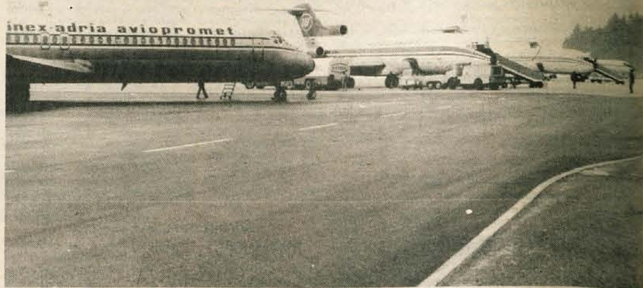
Vzletno-pristajalna steza je dotrajana, prav tako pa tudi naprave ob njej. 23 starih milijard dinarjev bo terjala modernizacija. Potem bo letališče kot novo in bo sposobno sprejemati najtežja, največja in najhitrejša letala. Tudi Jatova letala DC-10 za New York bodo lahko vzletela in pristajala na Brniku.