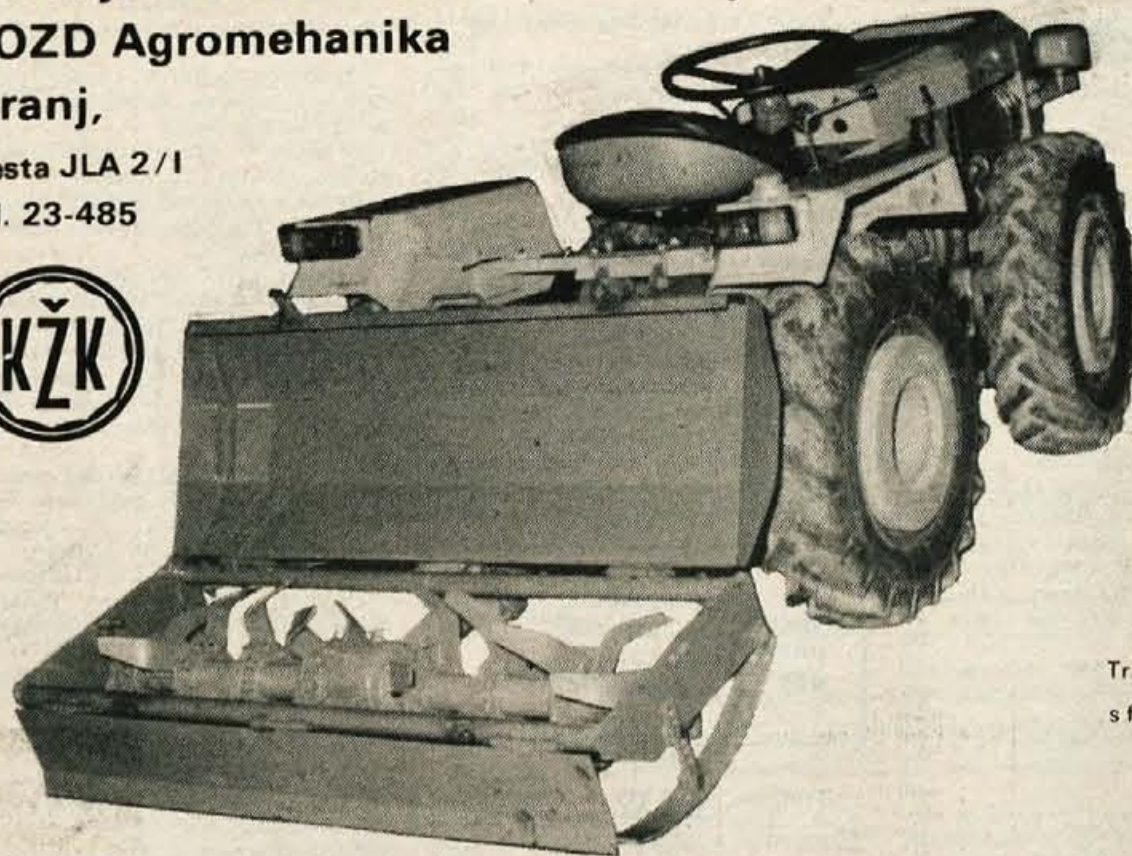
Traktor TV 730 s frezo 120 cm

Na zalogi imamo celoten program TOMO VINKOVIČ, za katerega vam nudimo do 70 odstotkov kredita z ugodno zmanjšano obrestno mero.