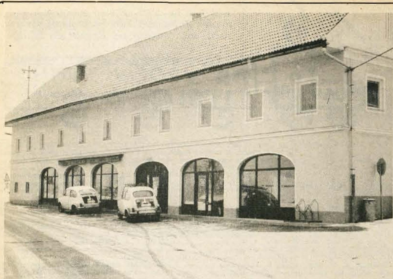
Prostori Ljubljanske banke v Lescah so lepi in funkcionalno opremljeni, banko pa obiskujejo predvsem Leščani in prebivalci okoliških krajev.