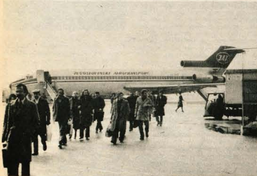
V šestdesetih dneh, ko bo letališče na Brniku zaprto, bodo potnike in tovore preusmerjali na sosednja letališča, predvsem v Maribor in Zagreb.

Med 30. junijem in 1. septembrom bodo popravljali brniško letališče