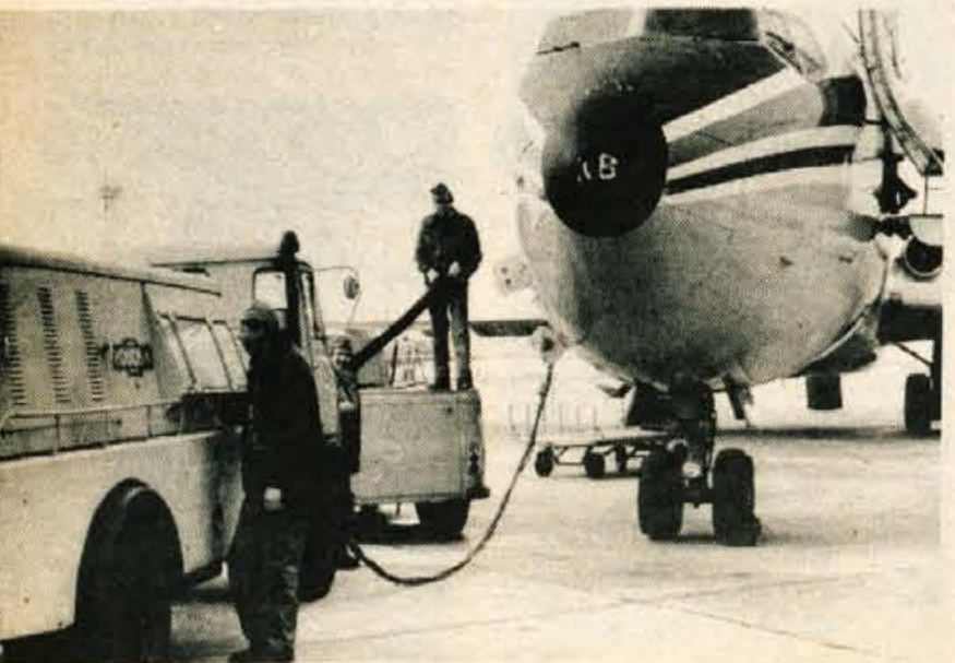
Kopico odgovornih opravil morajo opraviti letališki delavci preden jeklena ptica sme vzleteti. Med rekonstrukcijo bodo strokovne in tehnične službe Brnika pomagale na drugih letališčih.

dan, po analizah meteorologov pa so ta dva meseca dnevi najbolj suhi. Prav tako je večji del ljudi julija in avgusta na dopustih in je obremenitev letališča najmanjša, pomemben pa je tudi razlog, da bodo graditelji lahko stregli strojem v največji sili tudi ponoči.