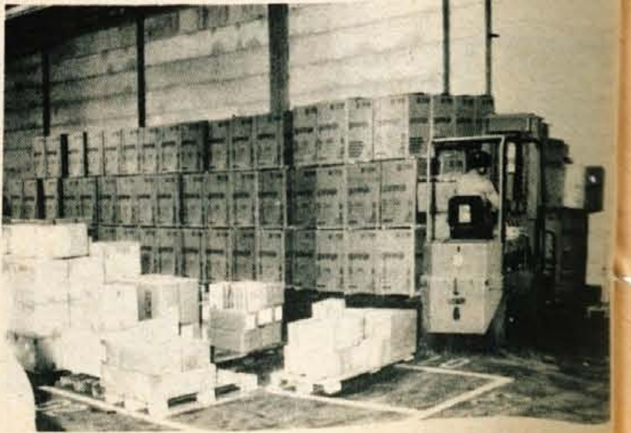
Brniško letališče je že sedem let usposobljeno za sprejem, odpravo in prevoz blaga z letali. V postavljenih ima že nekaj rednih linij, februarja pa bo prvo letalo odpeljalo opremo iz Gorenja v Tanzanijo.