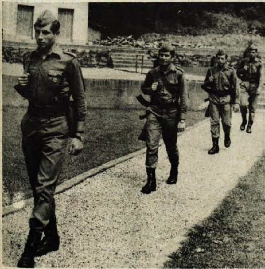
15. AVGUST — PRAZNIK ČUVAJEV NAŠIH MEJA — Uspešno varo-vanje meja, povezanost s prebivalci in odlična usposobljenost pripadnikov JLA na meji zagotavljajo miren in nemoten razvoj naše samoupravne socialistične skupnosti. Na sliki: Patrulja se vrača z rednega taročenja meje.