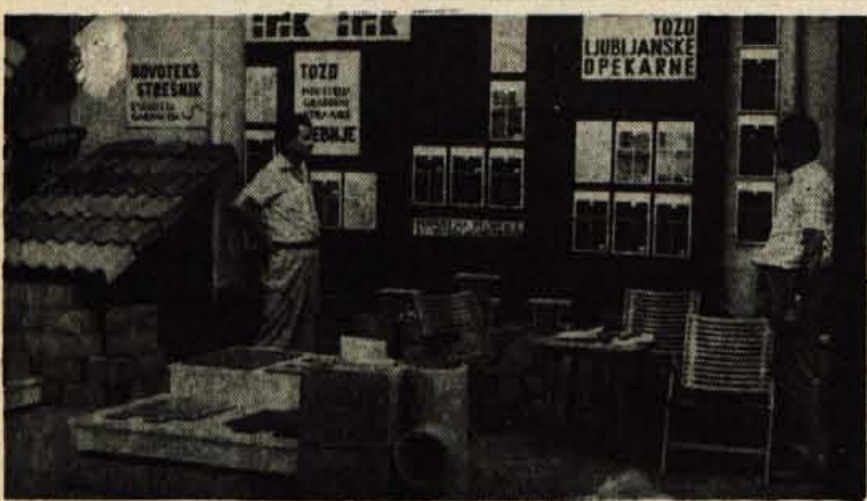
GP TEHNIKA - TOZD Ljubljanske opekarne tudi letos razstavlja pred halo B. Posebno ponudbo imajo pri prodaji gradbene keramike - talnih oblog, in sicer 5- do 10-odstotni popust in dostavo na dom. Veliko zanimanja pa vzbujajo tudi strešna opeka raznih barv, ki jo izdeluje Novoteks, Novo mesto.