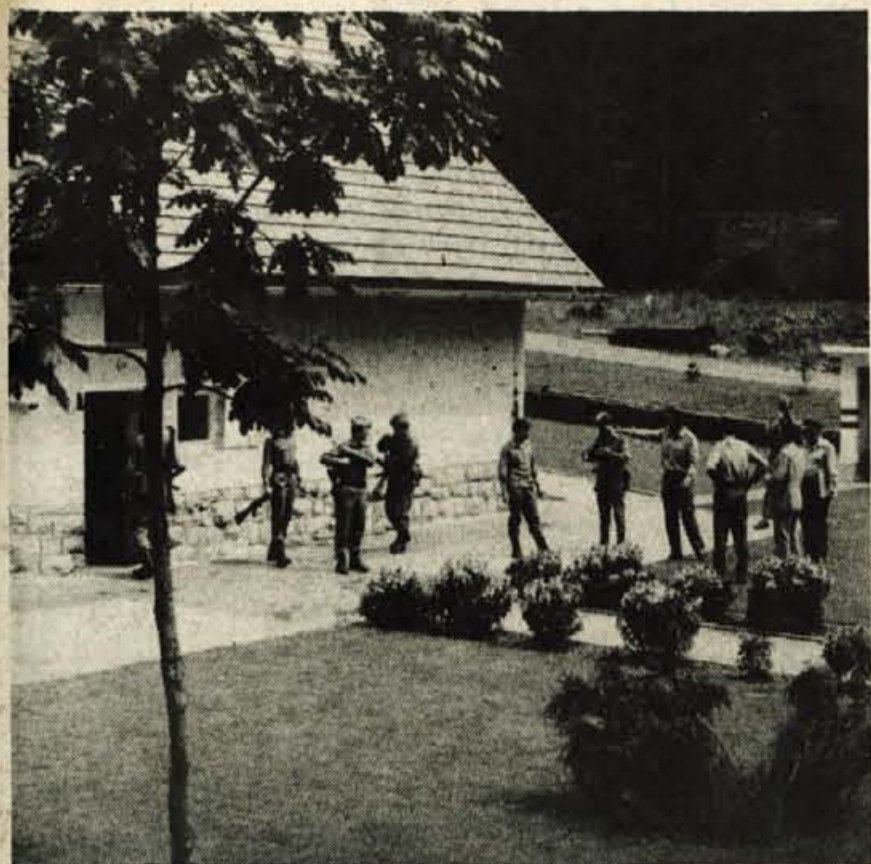
Vojaki v karavli skrbijo, da je tudi okolica vedno lepo urejena