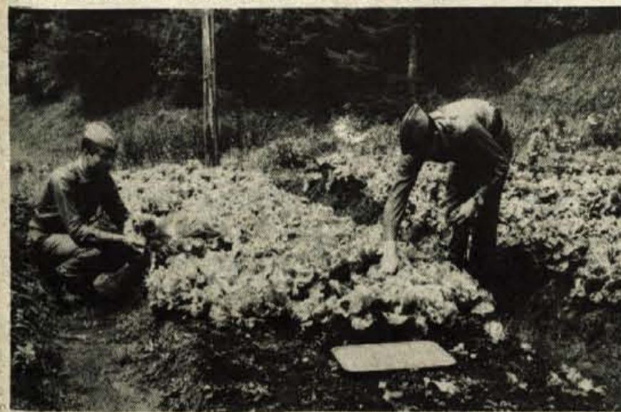
Tudi v karavli se vključujejo v tako imenovani zeleni plan. Kar lahko, skušajo sami pridelati za prehrano.