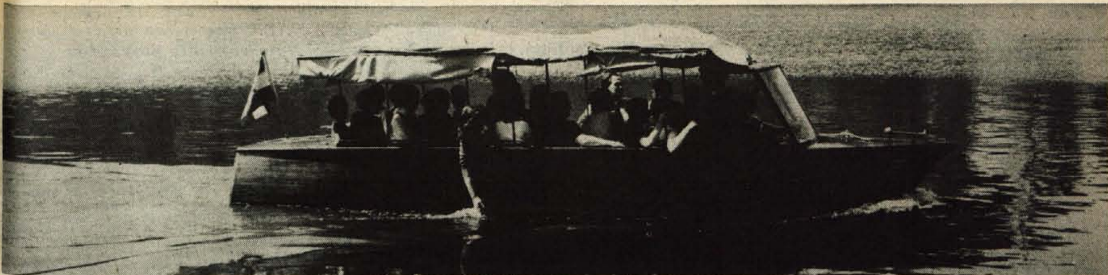
Kakšna bo letošnja turistična bera pri nas, je ta hip še najbrž preuranjeno napovedovati. Poročila so tako iz obmorskih krajev kot s celine precej nasprotujoča. Podobno je tudi na Gorenjskem, kjer tudi vreme ni najbolj naklonjeno turistom. — A. Z.

Leto XXX. — Številka 61 TRIDESET LET 1947-1977 Ustanovitelji: občinske konference SZDL Jesenice, Kranj, Radovljica, Škofja Loka in Trzin — Izdaja CP Glas Kranj. Glavni urednik Igor Slavec — Odgovorni urednik Albin Učakar