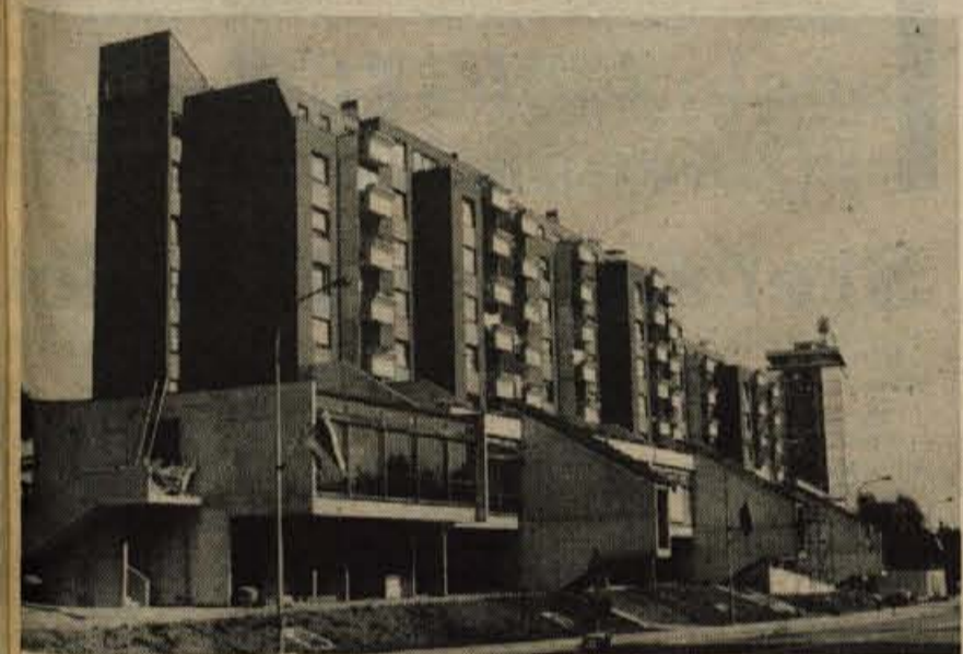
V del spodnjih poslovnih prostorov poslovno-stanovanjskega bloka H-8 na Cesti JLA v Kranju se prav te dni useljujejo kupci poslovnih prostorov, medtem ko je stanovanjski del lani zgrajenega bloka že dlje časa naseljen.

GLASILO SOCIALISTIČNE ZVEZE DELOVNEGA LJUDSTVA ZA GORENJSKO