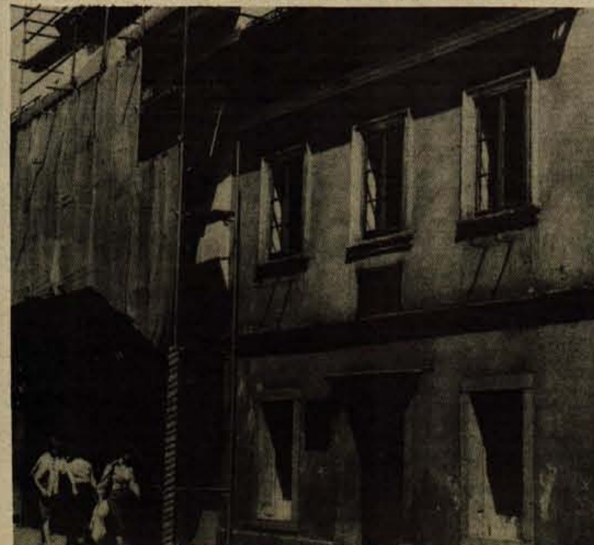
Fasade starih hiš v središču Kranja oonavljajo. Lepo! - Ali pa bo prišlo pročelje hiše, v kateri je pesnik Prešeren umrl, tudi na vrsto? - Foto: F. Perdan

Razstava »Pionirski foto 1977« bo na Jesenicah odprta do vključno 31. maja. J. Rabič