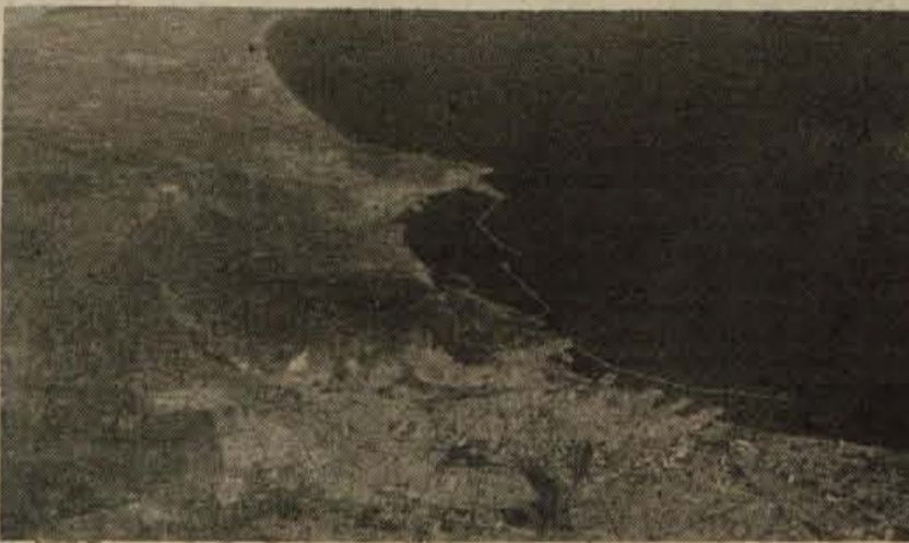
Pogled iz letala na Casablanca

Že v rani mladosti sem rada sanjara o zame takrat še nedostopnih, oddaljenih kontinentih. Posebno pa me je privlačeval črni kontinent in sklenila sem, da ga nekoč obiščem. Ko sem izvedela, da Planinsko društvo Kranj organizira izlet v Afriko, točneje v Maroko, sem se odločila, da končno uresničim svoje sanje. In tako sem se priključila odpravi, ki se je namenila osvojiti najvišji vrh visokega Atlasa - Toubkal, visok 4165 m. Privlačevala pa me je tudi višina, saj do sedaj še nisem prišla višje, kot na naš markantni Triglav.