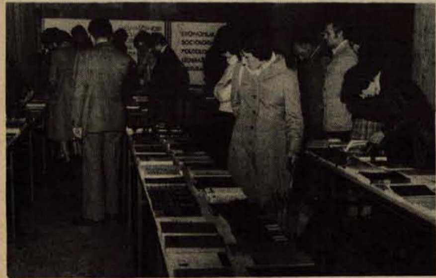
V ponedeljek, 23. maja, so v avli občinske skupščine v Kranju odprli razstavo marksistične literature. Razstavljenih je več kot 1300 knjig. Odprta je vsak dan od 9. do 20. ure do vključno nedelje, 29. maja (lb)