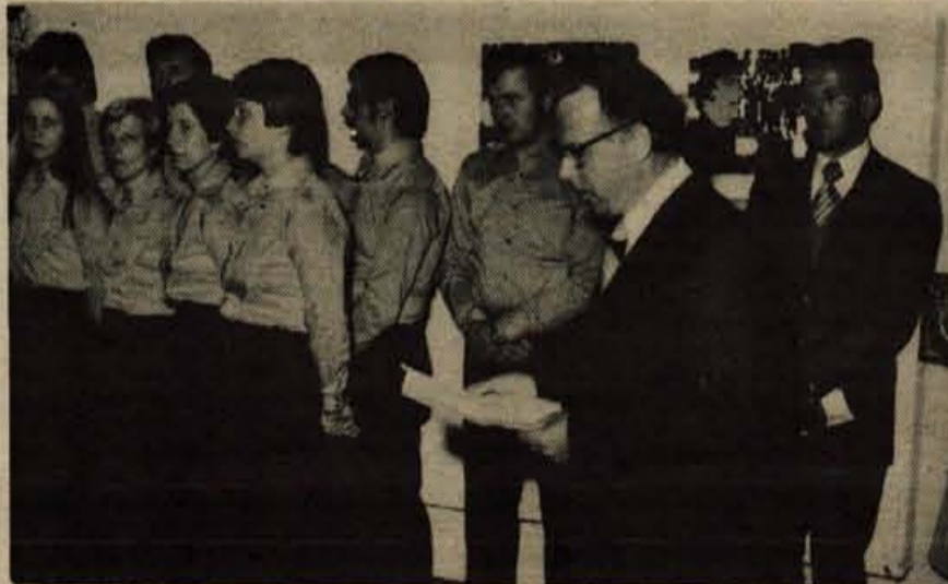
V počastitev 85. rojstnega dne maršala Tita so društvo učiteljev likovne in tehnične vzgoje, Zavod za šolstvo - organizacijska enota Kranj in Gorenjski muzej pripravili razstavo likovnih in fotografskih del na temo Tito - revolucija - mir. Otvoritev razstave je bila v ponedeljek, 23. maja, v galeriji mestne hiše v Kranju. (lb)