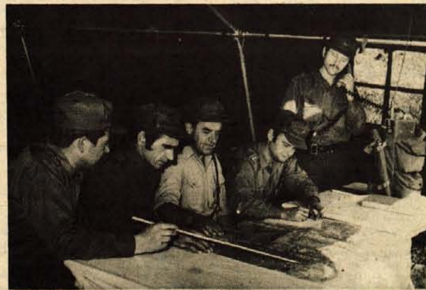
Po obrazih v štabu sodeč vaja odlično uspeva.