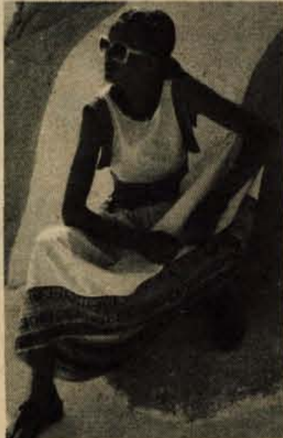
Vesela počitniška obleka za sprehode ob morju ob toplih večerih ali za posedanje na terasi: belo bombažno blago dopolnimo ob robu krila s pisanim najboljše geometrijskim vzorcem. Z enakim blagom so podaljšane tudi rame v nekakšna rokava.

pomoč zdravnika dermatologa, ker je to znamenje glivičnega obolenja: glivice pa se najraje naselijo na vlažnih mestih. Obolenje preganjamo že takoj na začetku, da se ne razširja naprej po nogi. Za nego uporabljamo lahko tudi kozmetično olje ali otroški puder.