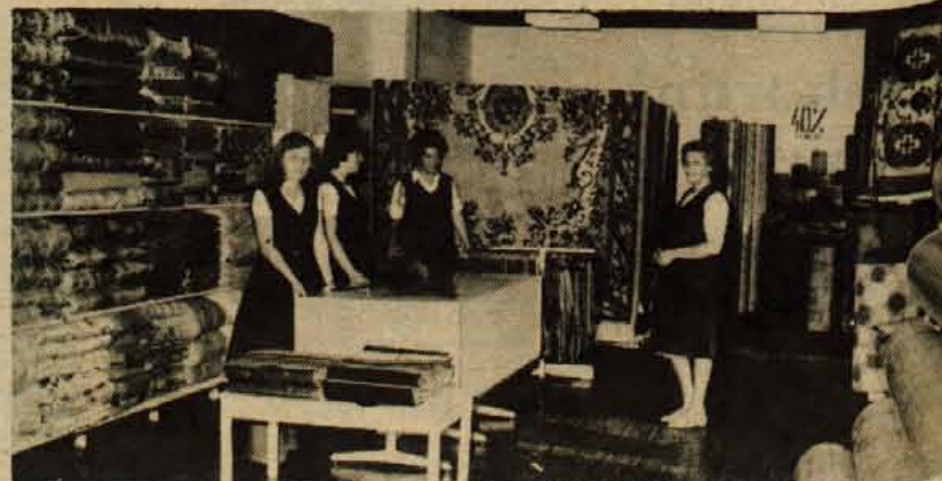
Celih šestdeset in še več milijonov prometa na mesec pričakujejo od njih. V novih, prijaznih prostorih in ob bogati izbiri tudi to ne bo težko.