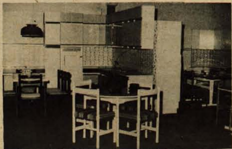
V zgornjih prostorih salona pohištva je sedaj dovolj prostora za stalno razstavo pohištva.