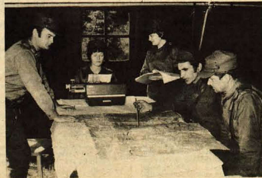
Starešine ocenjujejo potek vaje.

zduženem delu ter o naši zunanji politiki. Treba je pohvaliti vse člane ZK, ki so ob tem pokazali izredno aktivnost. Seveda pa v teh dneh ni manjkalo tudi kulturno zabavnega življenja.«