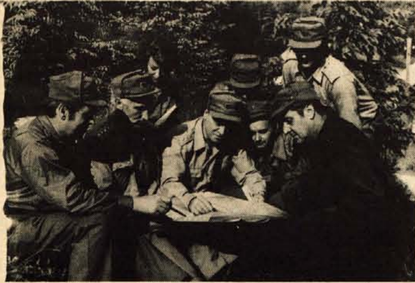
Teritorialci s načrtovanjem

V preteklem tednu je bila na področju Jelovice velika večdnevna vojaška vaja štabov in poveljstev teritorialne obrambe gorenjske cone - Izpopolnjevanje vojaškega znanja - Udeležence vaje so obiskali tudi predstavniki pokrajinskih organov, gorenjskih občinskih skupščin in občinskih družbenopolitičnih organizacij - Tesno sodelovanje s prebivalci na tem področju