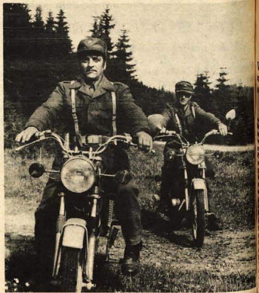
Kurirji so na razvejanih cestah Jelovice odlično opravili svojo nalogo.