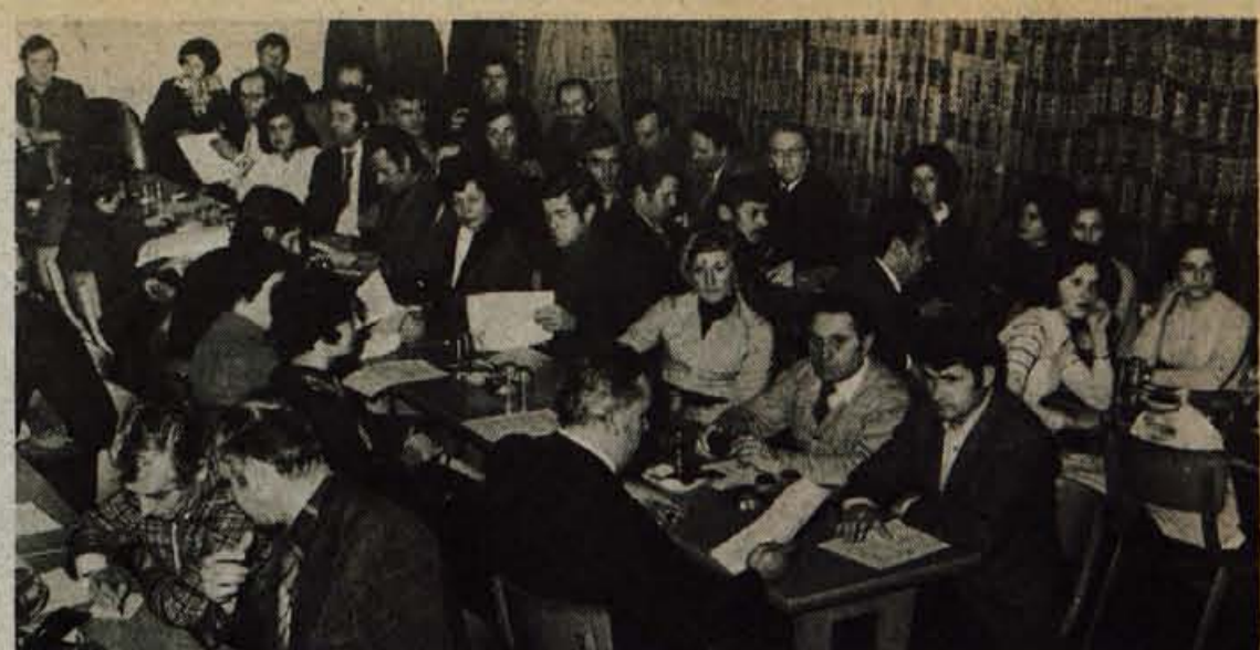
V sredo, 14. januarja, je bila v kranjskem delavskem domu shlepna prireditev IX. letnih športnih iger, ki jih je lani pripravil občinski svet Zveze sindikatov Kranj.