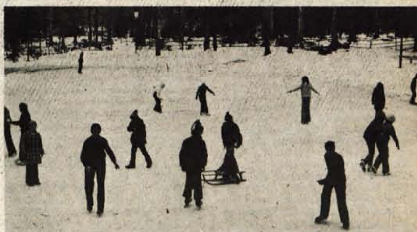
Bohinj je letošnjo zimsko turistično sezono lepo popestril z naravnim drsališčem Pod skalco. Turistično društvo Bohinj jezero skrbi, da je led vsak dan lepo gladek, številni ljubitelji drsanja pa si v hotelu Jezero in v hotelu Stane Žagar lahko sposodijo tudi drsalke. Posebno živahno je na razsvetljenem drsališču zvečer. - A. Ž.

kino radio televizija križanka od vsepovsod družinski pomenki s šolskih klopi gorevski hrasti