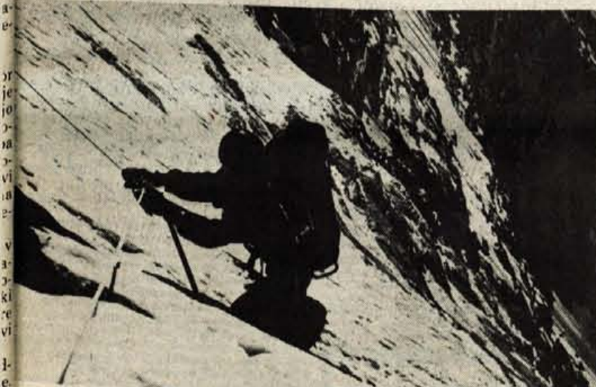
Iz južne stene Makaluja