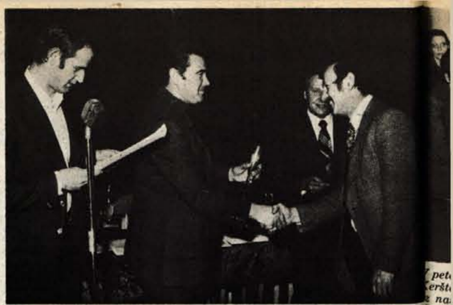
Ekipam in posameznikom, ki so se najbolj odrezali v posameznih športnih panogah sindikalnih športnih iger, so podelili pokale, diplome in praktične nagrade.