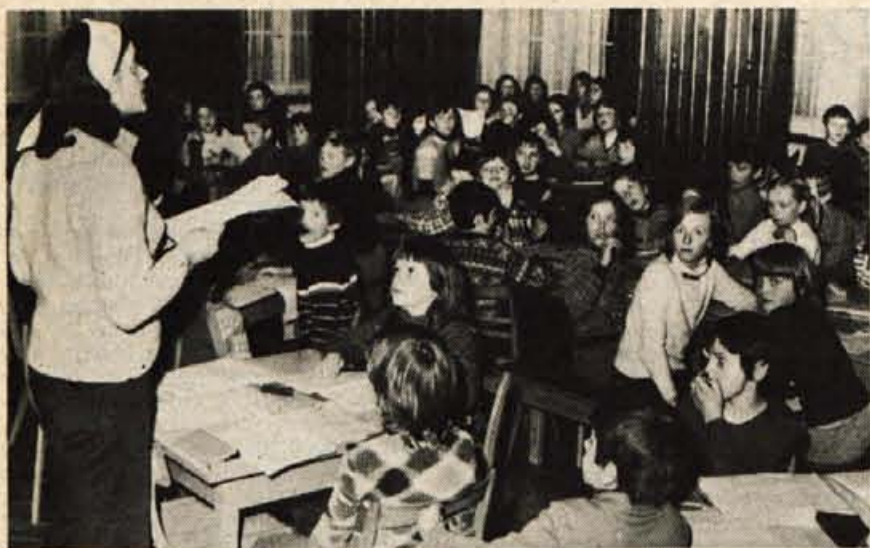
Po smučanju je vsak dan pouk matematike, slovenščine in drugih predmetov.