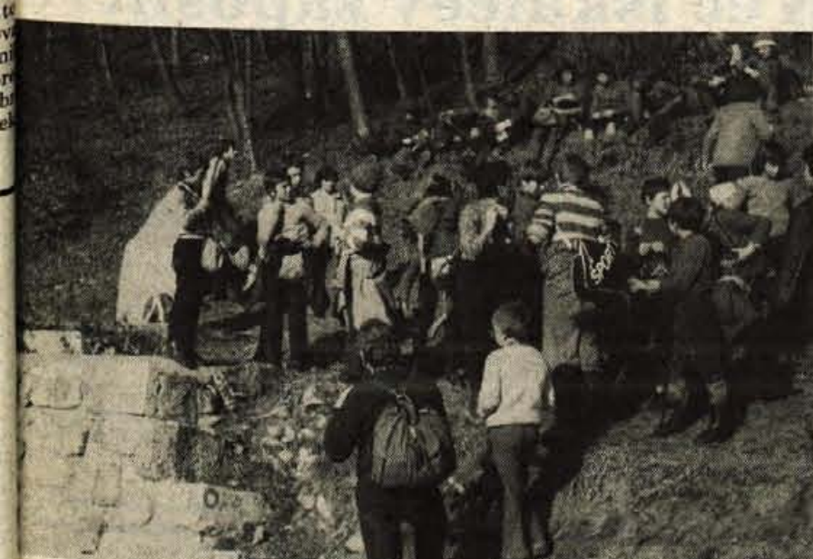
Najmnožičnejši pohod na prireditev »Po stezah partizanske Jelovice« legendarne Dražgoše je prav gotovo pripravilo planinsko društvo iz Kranja. Na njem je sodelovalo prek 1700 članov planinskih sekcij po osnovnih šolah, pripadnikov JLA, članov organizacij zveze borcev in rezervnih vojaških starešin ter sindikalnih organizacij ter planincev iz ljubljanskih planinskih društev in od drugod. Na pot iz Čepulj preko Mohorja do Dražgoš, dolgo štiri ure, se je podalo sedemsto pohodnikov, na nekoliko krajšo pot, prav tako je bil start v Čepuljah, pa prek osemsto. Za varnost udeležencev pohoda so skrbeli člani krajske gorske reševalne službe, ki pa niso imeli večjega dela. Člani krajskega planinskega društva so poskrbeli tudi to, da se je lahko pohoda udeležilo tudi čimveč planincev iz krajevnih skupnosti iz krajske občine. Pohod v Dražgoše je pomenil tudi ustanovitev planinske sekcije v krajski tovarni obutve Planika. Iz tega podjetja se je dražgoškega pohoda udeležilo kar trideset članov kolektiva. Udeleženci so med potjo obiskali mnoga spominjska obeležja ter ob njih počastili spomin na žrtve med zadnjo vojno. Pionirji planinske sekcije iz Predoselj so se ustavili tudi ob spomeniku sedmim padlim partizanom nad Lajšami v bližini Dražgoš.