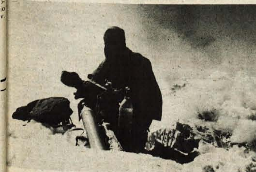
Na vrhu Makaluja