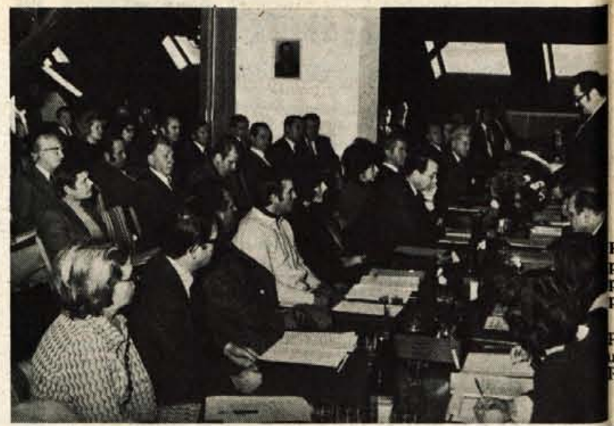
Na šestem rednem zboru upravljalcev kranjske podružnice Ljubljanske banke so razpravljali o osnutku dogovora o letošnji poslovni politiki Ljubljanske banke