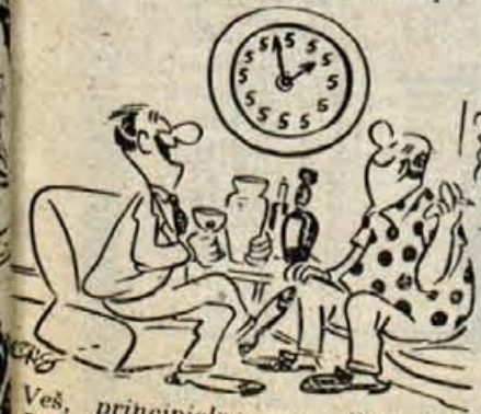
Veš, principielno ne pijem pred 5. uro!

Odkar je opustil plavanje, Marku Spitzu, sedemkratnemu olimpijskemu zmagovalcu, ne gre prav nič dobro od rok. Za težke dolarje je sklenil pogodbo s kozmetično tovarno, da bi na televiziji reklamiral njene izdelke, toda pred kamerami ni bil preveč prepričljiv. Posloviti se je moral tudi od filmskih načrtov. Sedaj govorijo, da ga je celo žena zapustila in da se bo ponovno posvetil študiju zobozdravstva.