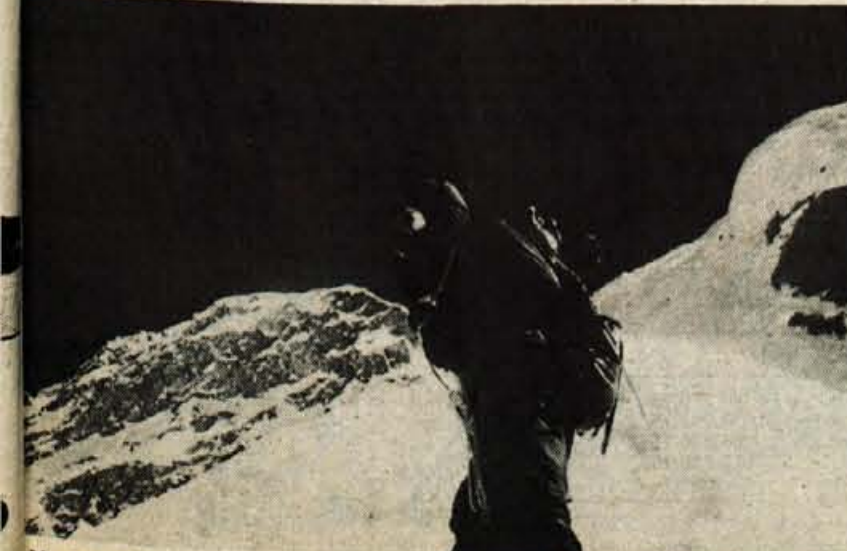
Na francoskem grebenu.