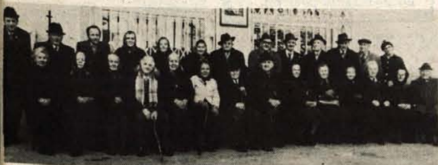
Na pobudo osnovne organizacije RK so vse družbenopolitične organizacije na Srednji Dobravi pri Kropi pripravile sprejem za vse ostarele člane in invalide v krajevni skupnosti. Vabilu se je odzvala večina povabljenec. Organizatorji so med drugim poskrbeli tudi za prevoz. V dvorani doma krajevne skupnosti je bila za povabljenega pripravljena pogostitev. Srečanje je bilo priščno, saj je marsikomu omogočilo, da je po dolgem času s prijateljem obudil misel na pretekla teža, pa vendar lepe dni. Udeleženci so po končanem sprejemu zagotavljali, da jim bo 6. januar ostal v lepem spominu. Organizatorji pa so si zadali nalogo, da bodo v bodoče taka srečanja še pripravili. Razširiti pa jih nameravajo s kulturnim programom. (BP)