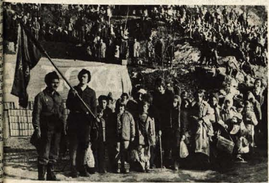
Udeleženci, ki so startali iz Soteske pri Bohinju, so morali do partizanskih Dražgoš prehoditi dvanajst kilometrov dolgo pot. Med udeleženci pohoda je bilo tudi petinšestdeset tabornikov iz jeseniškega taborniškega odreda. Med njimi je bilo tudi izredno veliko število mladih, pionirjev, ki se niso ustrašili dolgega pohoda.