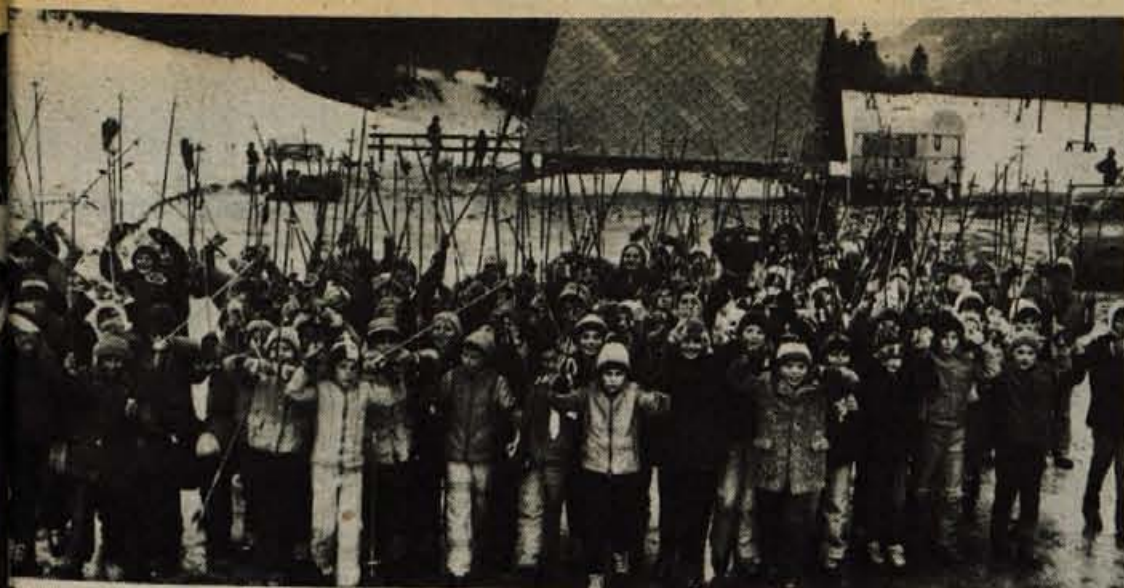
Osnovna šola Lucijana Seljaka iz Kranja je tudi letos v Gozd-Martuljku organizirala šolo v naravi. Pod naslovom Vesela in vzgojna šola v naravi pišemo o tem na 6. strani.