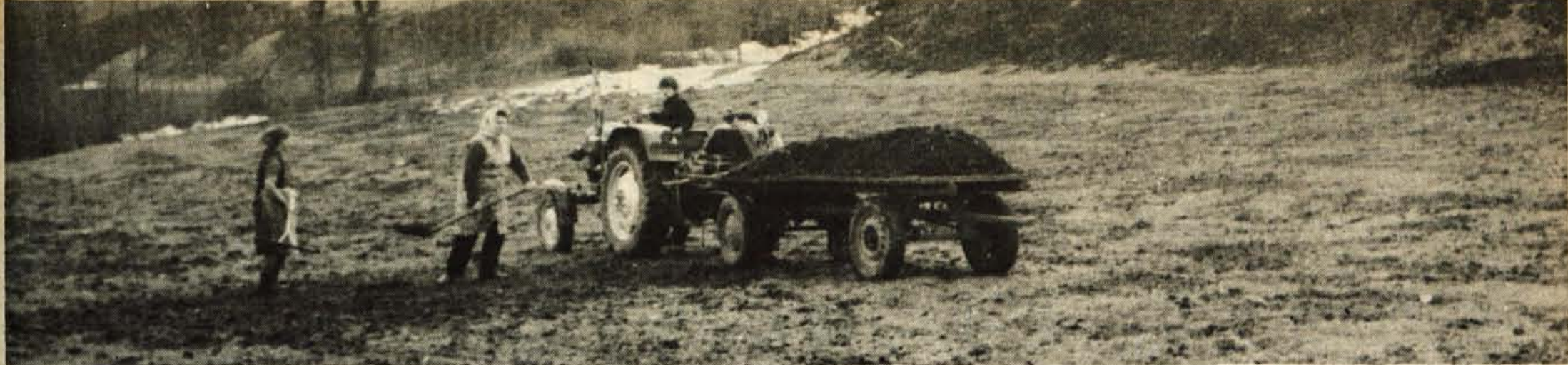
Čeprav je bil »uradni«, koledarski začetek letošnje pomladi bolj muhast, smo v zadnjih dneh vendarle dočakali pravo pomlad. Tako so se marsikje na Gorenjskem že začela spomladanska dela.