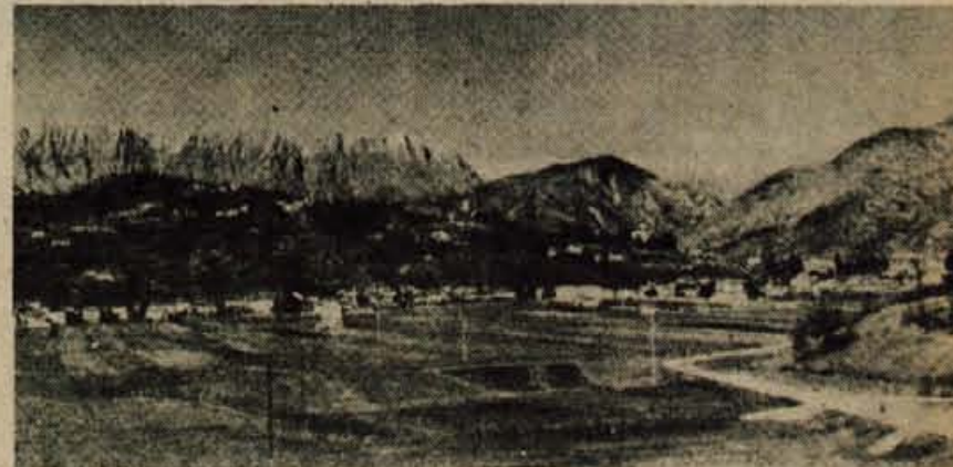
Tersko gričevje s slovenskimi selišči. Levo, v ozadju visoki zid Muzcev; za grebeni je že dolina Rezije.

Hotel sem se prepričati, kako ljudje govore med seboj, kadar so v družbi. Stopila sva z mladim doktorjem v vaško gostilno, pozdravila slovensko in dobila naš odzdrav. Potem smo posedli in glej: vsa gostilna je govorila slovensko, seve v terskem narečju. Tako zahodno, tako daleč, na robu domovine - kako dobro počutje! Globoke in zveste so korenine našega rodu.