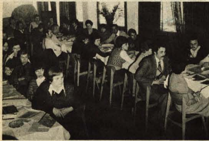
V soboto se je na Jezerskem sklenila sindikalna politična šola. Obiskovalo jo je 73 slušateljev – sindikalnih aktivistov iz kranjskih delovnih kolektivov.

Politična šola je pravzaprav trajala ves mesec. Začela se je 5. marca, to je na petek, trajala še v soboto in se potem ob koncu tedna po dva dneva nadaljevala skozi ves marec. V štirih krojih predavanj in razprav so sindikalni delavci govorili o družbenopolitični vlogi in mestu sindikatov v samoupravni socialistični družbi, organiziranosti in delovanju sindikatov v občini, informiranju v sindikalnih organizacijah, vlogi in nalogah sindikatov za razvijanje in uveljavljanje samoupravljanja v združenem delu, samoupravnem od-