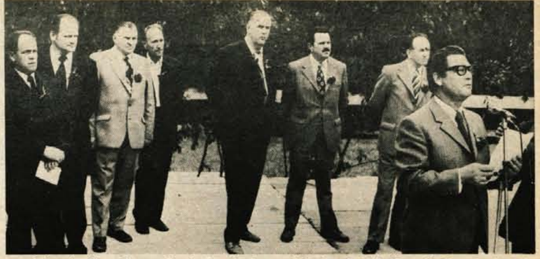
Udeleženci sobotnega pohoda na Kališče pred odhodom na Trstenik (prva fotografija), kjer je bila osrednja prireditev ob prazniku krajevnih skupnosti Goriče, Golnik, Trstenik, Tenetiše in Bela in 32. obletnici ustanovitve Kokrškega odreda.