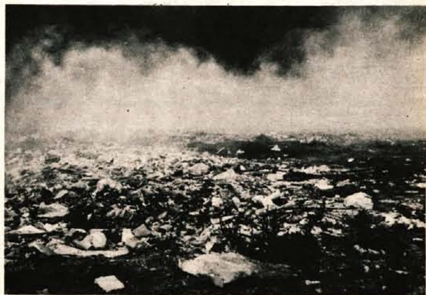
Pred tednom dni so na Zgornjem Plavžu na Jesenicah začeli goreti odpadki na smetišču, kamor vozijo nesnago številna jeseniška podjetja. Odpadki so goreli več dni in čeprav na večer prvega dne smrad prebivalcem Plavža skorajda ni dal dihati, ognja niso niti poskušali pogasiti.

Letos bo v okviru razstave tudi prvi potrošniški sejem, na katerem bo sodelovala Kmetijska zadruga Cerklje, Elita Kranj in Central Kranj. Razstava bo odprta do 8. julija. B. B.