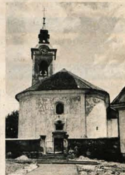
Cerkev sv. Mihaela na Olševku. Arhitekturna zasnova pročelja močno spominja na sloviti Angelski grad v Rimu.