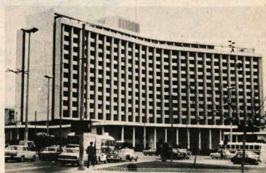
Hiltonovi hoteli, ki so razkropljeni po vsem svetu in so še vedno pojem popolnega udobja, so vedno neke posebne oblike; tale na Aveniji kraljice Sofije v Atenah je malo zaokrožen, stranske stene pa krasi reliefni motivi iz grške zgodovine.

Kaj hitro je tu policaj. Sofer je šel v bližnji motel telefonirat lastniku agencije, da smo obstali in da naj pošlje drug avtobus ali pa taksije. Policaji smo nazorno pokazali, da je tole »kaputi« in da sofer telefonira. Šel je za njim, ob avtobusu pa se je ustavila že neke druge vrste policija; v belih jopičih so bili in zelo prijazni. Tole bo pa tista turistična policija, smo menili. Pa je bila res. Nekaj časa so hodili okrog avtobusa, se oni poprašali po soferju in spet smo po svoje dopovedovali in razlagali. Potem so hitro preumerni promet in nas poprosili, da izstopimo. Zdaj smo tudi sami imeli priložnost občutiti, kako cenijo turiste v Grčiji.