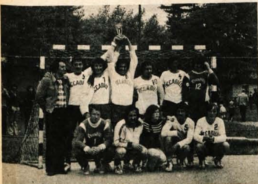
Rokometna ekipa Šeširja iz Škofje Loke