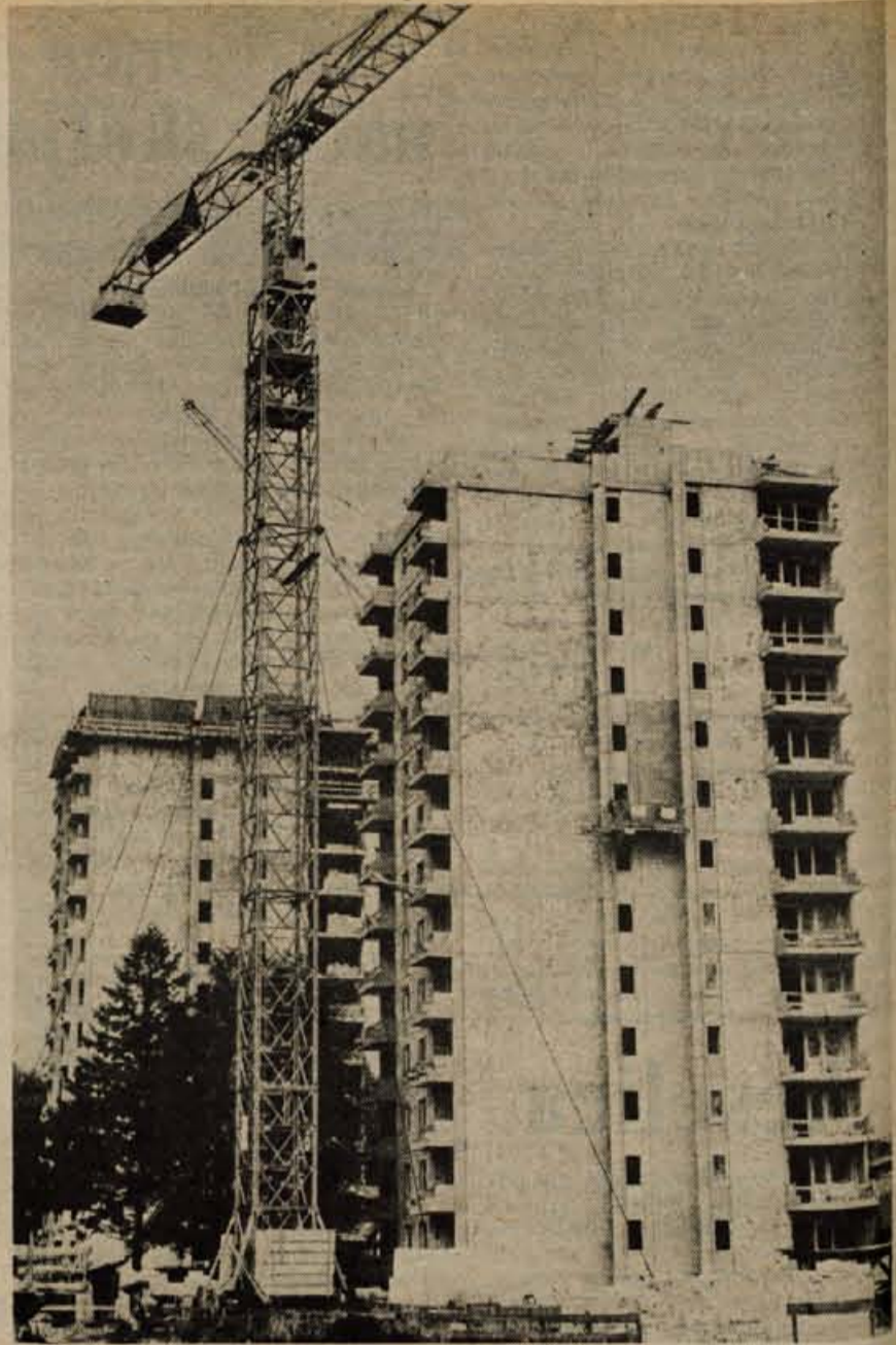
Ob Partizanski cesti v Skofji Loki sta pod streho še dve novi stolpnici. Pod nadzorstvom podjetja Lokainvest ju gradi Splošno gradbeno podjetje Tehnik. V vsaki stavbi je 55 stanovanjskih enot: trosobna, dvosobna, dvosobna s kabinetom in enosobna stanovanja. Ena bo vseljiva, če ne bo zastojev pri obrtniških delih, že konec novembra, druga pa spomladi prihodnje leto. Cena za kvadratni meter stanovanja znaša 3400 dinarjev in kakor so povedali pri Lokainvestu, se vsaj letos ne bo zvišala.

Podobno prostovoljno delovno akcijo pa so v krajevni skupnosti organizirali tudi januarja letos. Takrat so s prostovoljnim delom prebivalcev in denarjem krajevne skupnosti postavili smučarsko vlečnico v Zgornji Besnici. Pobudo za to je dala krajevna skupnost, vrednost vlečnice pa znaša okrog 3 milijone starih dinarjev. A. Zalar