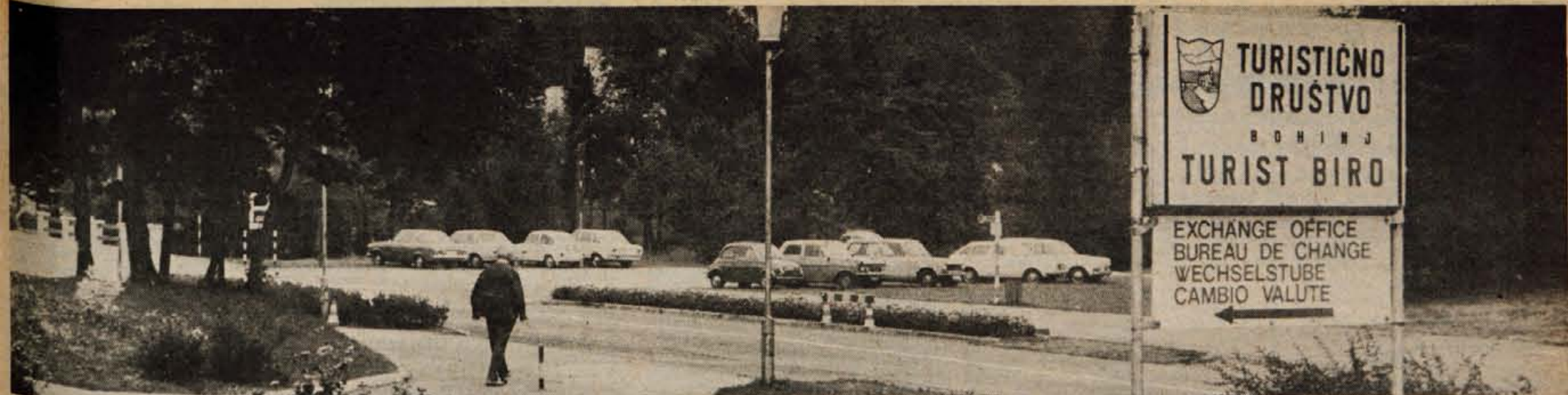
Turistično društvo Bohinj Jezero je letos ob hotelu Jezero razširilo parkirni prostor in most ter asfaltiralo sprehajalno pot. Vrednost vseh del je znašala 80.000 dinarjev