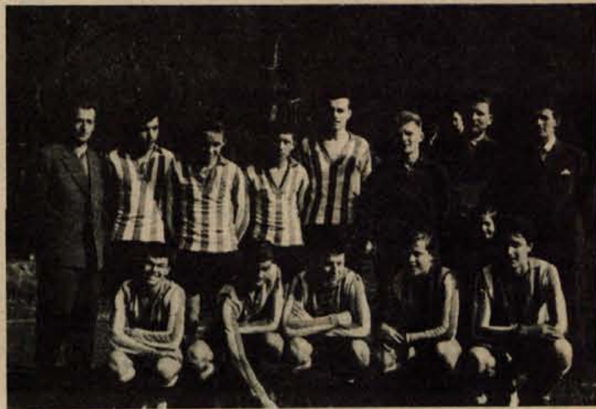
Na Golniku v teh dneh proslavljajo 15-letnico športnega društva Storžič. Na našem posnetku je ekipa rokometne, ki je zaorala ledino v razvoju rokometu na Golniku.