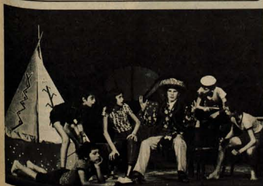
S. Mihalkov: Sestero mušketirjev