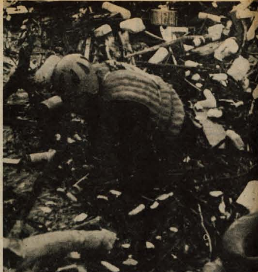
Takihle prizorov v Tacnu preteklo soboto in nedeljo ni bilo malo. Vestlač, ki so ga pobesneli valovi ukanili, je sicer srečno priplaval k bregu, tam pa se je moral otepati nesnage, zagozdene v obalnih tolmunčkih. Kdo ve, kakšen vtiš so po vsem tem od nas odnesli tujci? Bi odgovornim padla krona z glave, če bi dan poprej pospravili sledove visoke kulture Kranjcev? (ig)