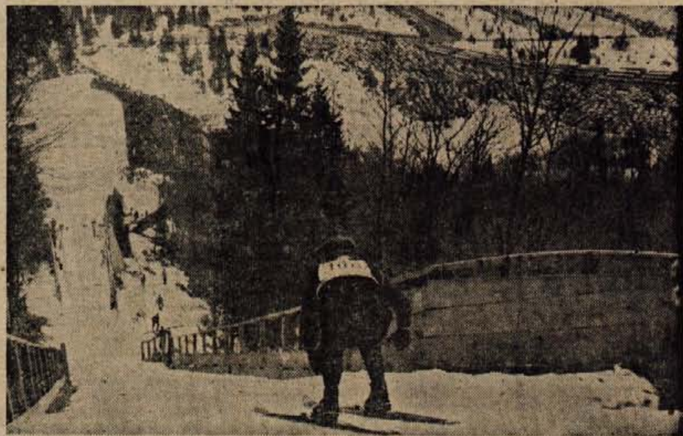
Od tod se junaki smučarskih poletov poganjajo v globino.

XII. MEDNARODNI SPOMLADANSKI KMETIJSKI SEJEM OD 31. III. DO 8. IV.