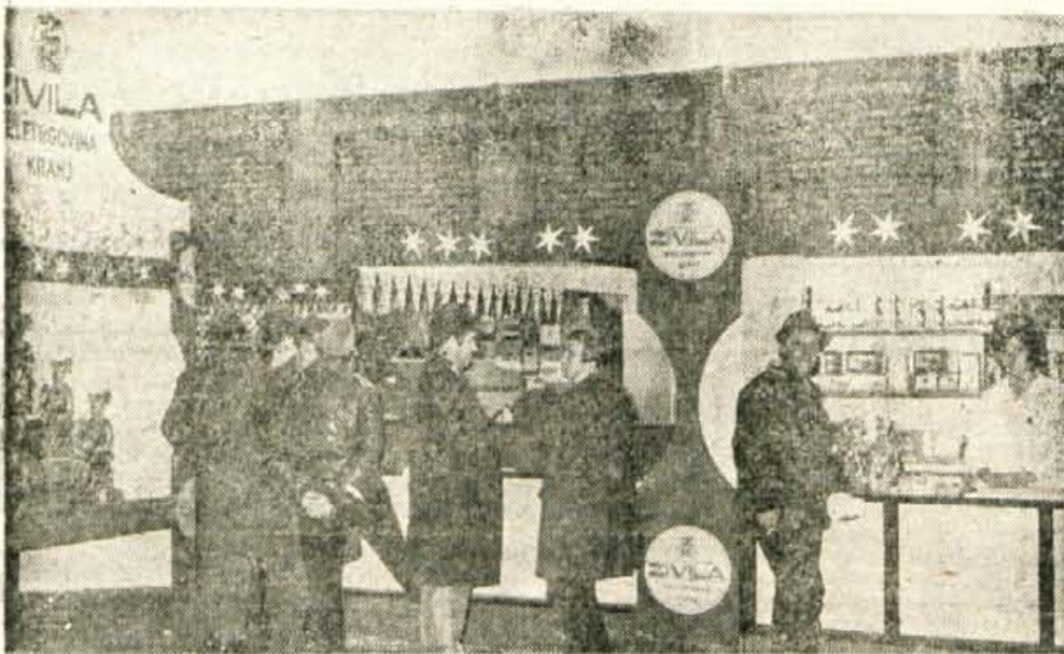
Tako kot vsako leto je tudi letos na novoletnem sejmu v Kranju od trgovskih podjetij Zivila Kranj.