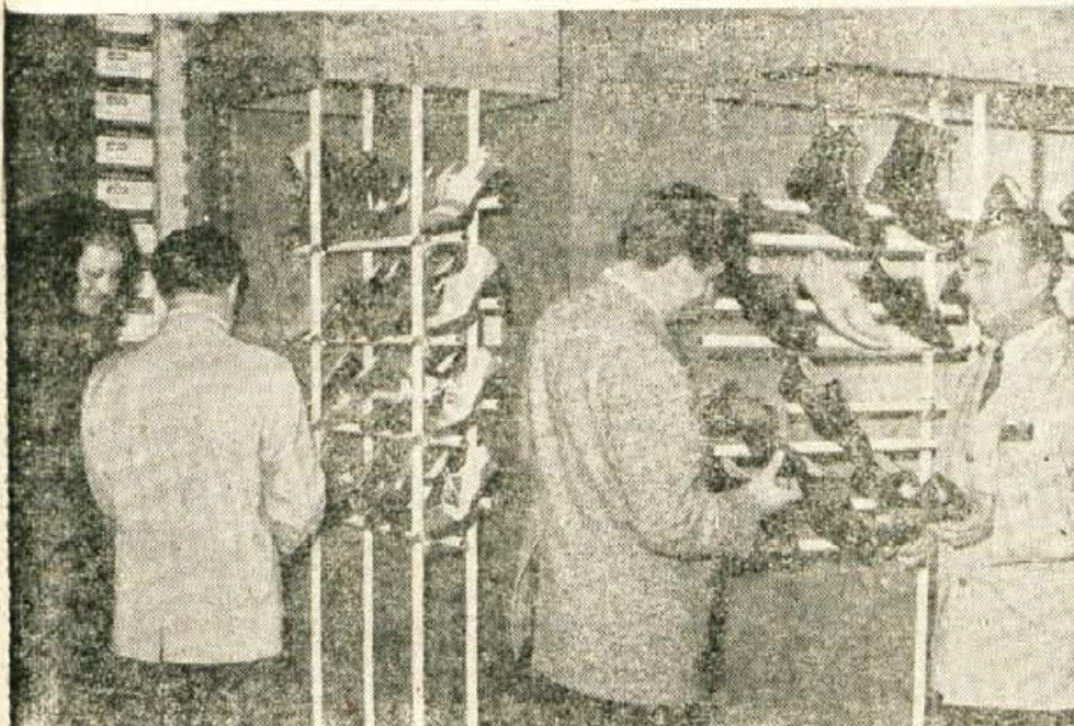
Nova Pekova trgovina pred vhomom v tovarno bo odprta od 8.30 do 15. ure, ob sobotah pa od 8. do 12. ure.