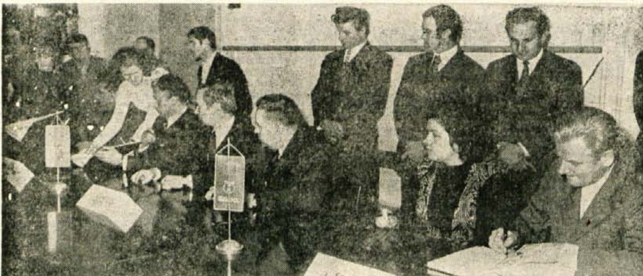
V soboto, ob 12. uri so v Savi v Kranju podpisali samoupravni sporazum o združitvi temeljnih organizacij združenega dela.

Samoupravni sporazum so ob 12. uri podpisali direktorji temeljnih organizacij združenega dela in direktor podjetja. A. Z.