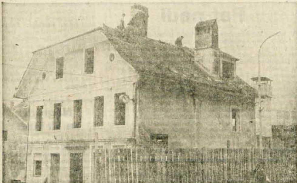
V teh dneh so v Tržiču začeli podirati Vilfanovo hišo, kjer bo stala nova avtobusna postaja.