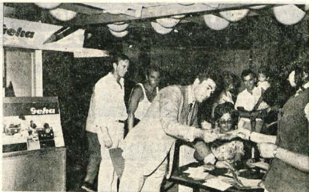
V torek popoldne je bilo na Gorenjskem sejmu v paviljonu Hermesa nagradno žrebanje. 40 izzrebancev je prejelo šolska nalivna peresa Geha.