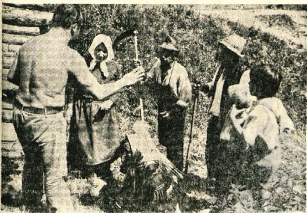
Filmska ekipa, ki snema v Javorjih televizijsko nadaljevanko Cvetje v jeseni, dela s polno paro. Poleg znanih slovenskih gledaliških igralcev bo like iz Tavčarjevega dela oživilo tudi precej domačinov.