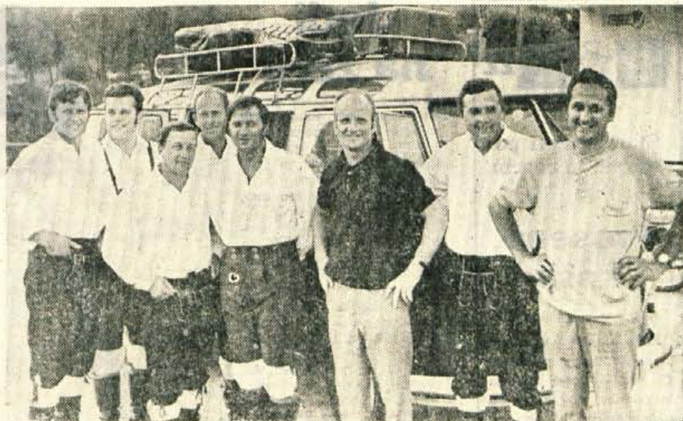
Kratek postanek na Colu je Slakovim fantom pošteno prijal.