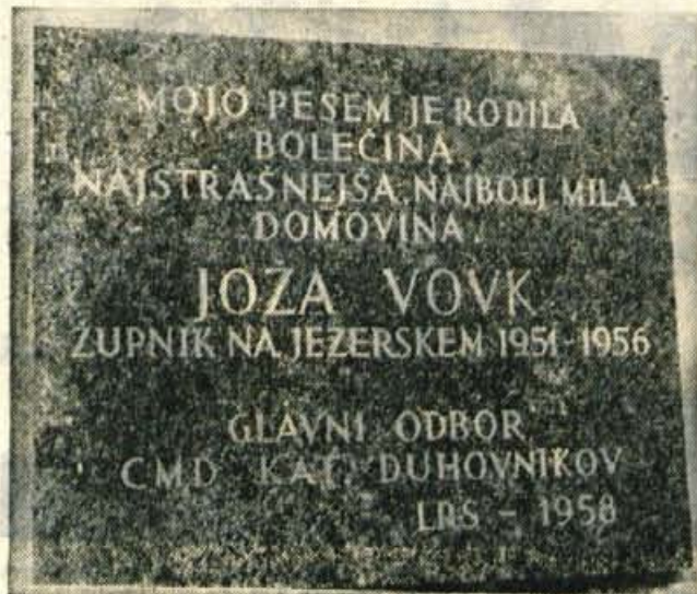
Spominska plošča pesniku in pisatelju Jožetu Vovku na Jezerskem.