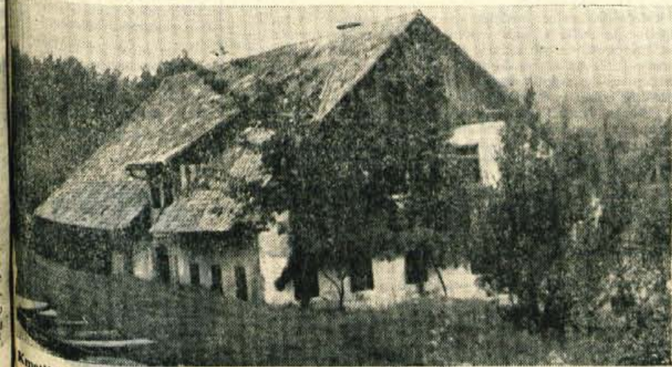
Kmetija na Slajki nad Hotavljami naj bi bila stara blizu 1000 let.