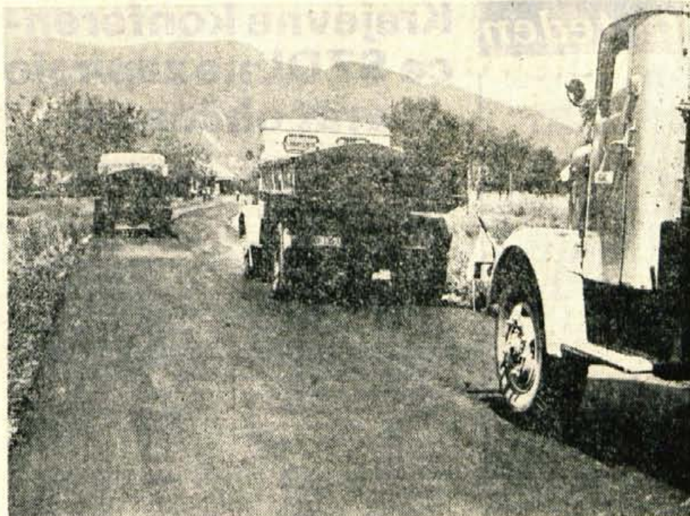
Delavci Cestnega podjetja iz Kranja so začeli pred kratkim asfaltirati cesto Križe—Zadruga, ki je bila v izredno slabem stanju. Cestišče bodo prekrili s 5 centimetrov debelo asfaltno plastjo. Denar za asfaltiranje je dala tržiška občinska skupščina, ki se je že odločila, da bo financirala tudi asfaltiranje ceste od križišča na Bistrici do Smoleja. (Jk)