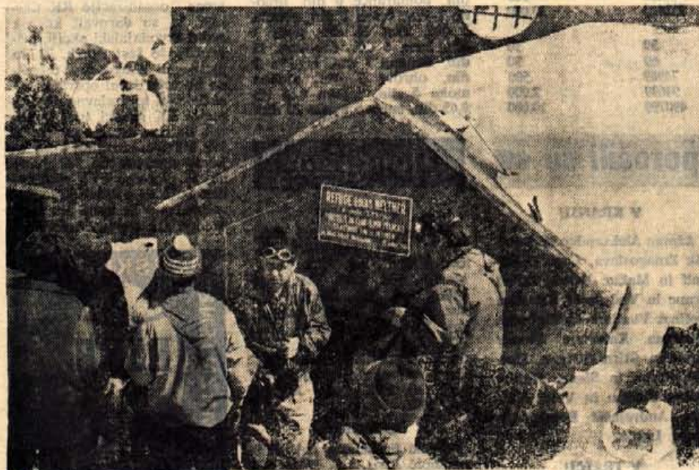
Pred bivakom Neltner, na višini 3207 m, je bilo zjutraj vse živo. Od tu so deset minut kasneje člani odprave krenili na odločilen pohod proti vrhu.