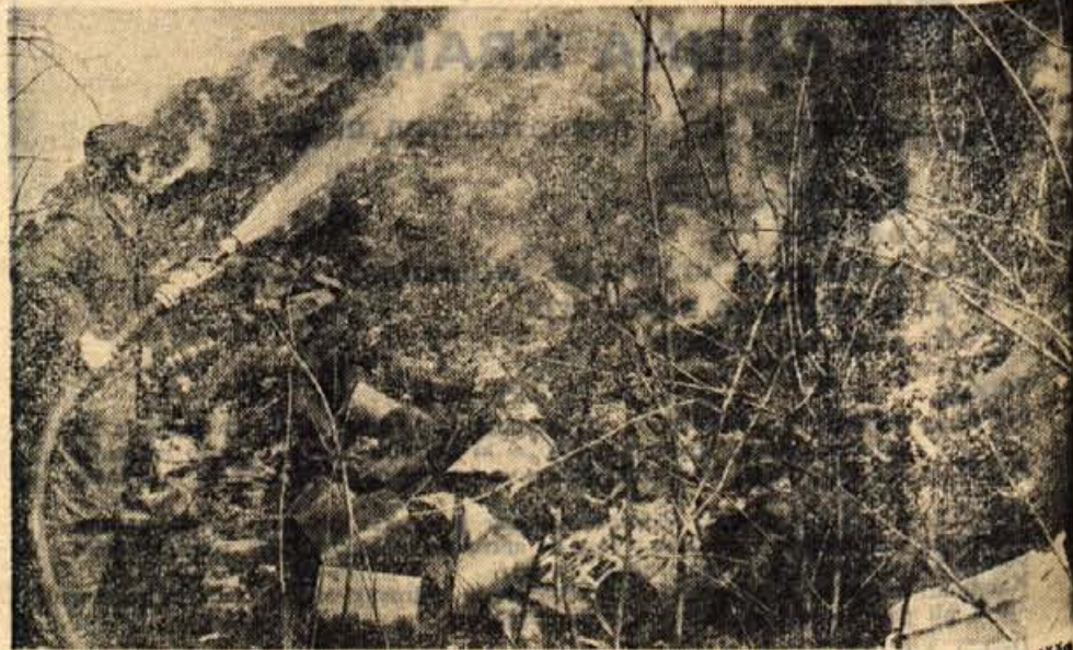
Tržič se je v ponedeljek popoldne znašel v dimu. 10-letni otrok je zažgal del javnega smetišča na Mlakah pod Pristavo, kamor vozi Komunalno podjetje Tržič vsak dan odpadke in smeti iz delovnih organizacij ter smeti iz smetnjakov (jk)