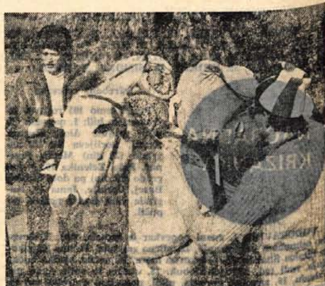
Neumorni atlaški konjiček se prav nič ne brani težkih nahrbtnikov. Kot za šalo jih bo ponesel v strmo pobočje Toubkala.

Spet dežuje. Okrog dveh popoldne dosežemo točko, ko prisojni, razjedeni greben trči ob strm, sončni atlaški bok in ko kopna zemlja mahoma izgine. Rjavkasto kamenje za-menja poldrug meter debela snezna odeja, spričo kabata