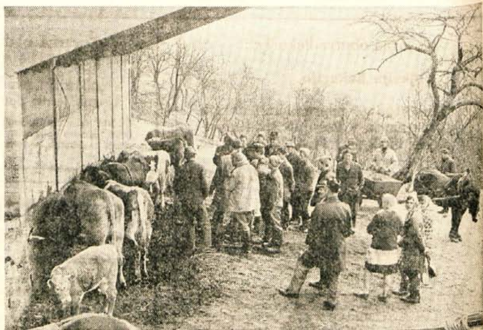
Glavni vir dohodka predstavlja kmetom v Javorjah in okolici reja živine. Vsako sredo prinesejo živino na semenj.