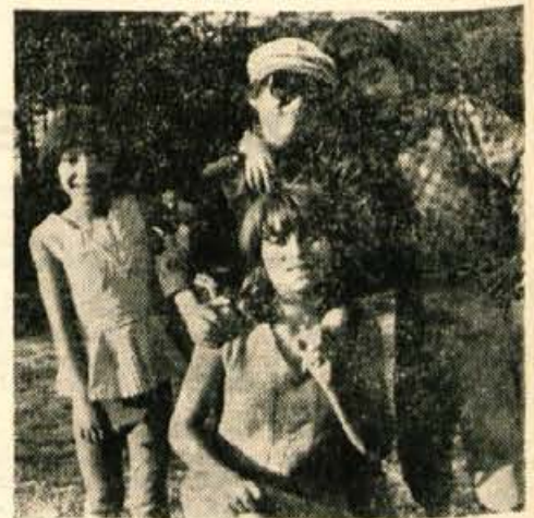
Ciganski otroci iz naselja Lancovo pri Radovljici