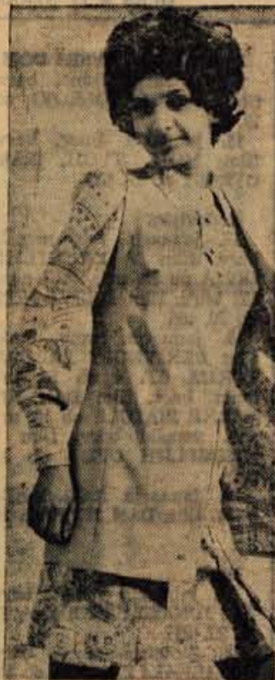
Gabarden z enobarvnim telovnikom iz bombažnega ripsa