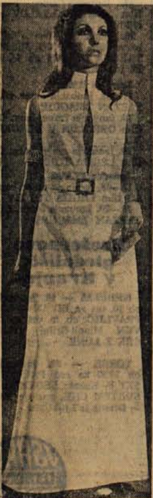
Večerna obleka iz terlenke v beli barvi

Ce je Andraž rekel, da se razume na glasbo, potem je to držalo. Znal je igrati več instrumentov in iz njih je znal izvabiti tako lepe melodije, da ga je bilo veselje poslušati. Najbolje pa je igral harmoniko; to je tudi sam vedel, a se s tem ni nikoli bahal.