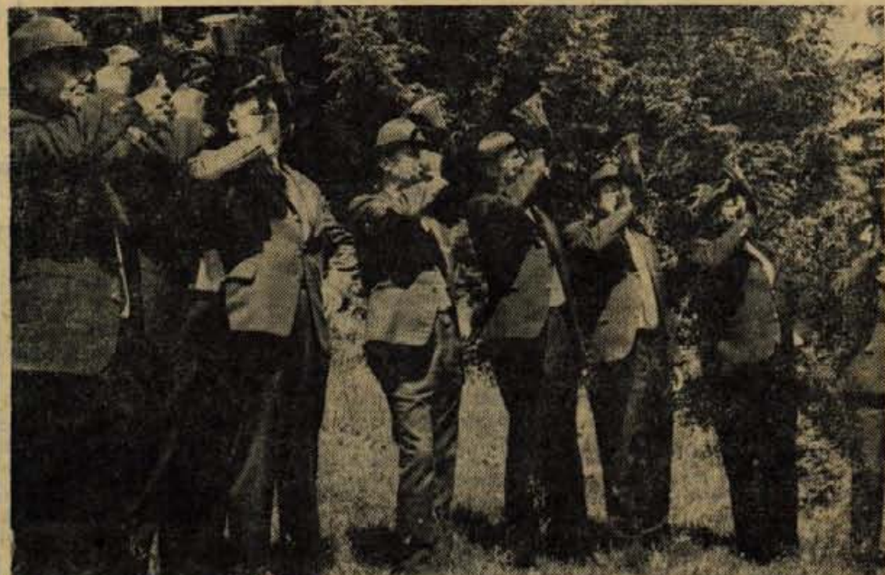
Zaključek slavnostnega dela srečanja gorenjskih lovcev in gozdarjev so naznanili koroški lovci z lovskimi rogovi. Enega so podarili gorenjskim lovcem.

Potem se je na jasi pred gostiščem v Ribnem pričelo prijateljsko srečanje lovcev in gozdarjev, ki se je končalo na večer, ko so tudi sončni žarki zamrli za bližnjimi vrhovi. J. Košnjek