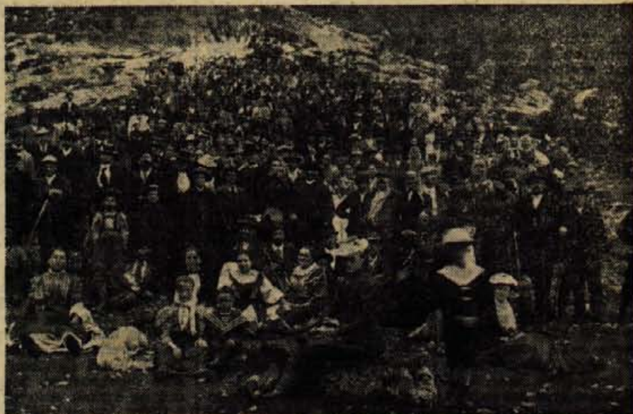
Ob otvoritvi zavetišča v Planici.

Njegova desna roka je bil v prvih letih Roblek; bil je društveni propagandist, kakor bi danes rekli, poleg tega pa planinec, ki je planinstvo praktično izvrševal in obhodil veliko sveta izven kontinenta. Še se spominjam tega simpatičnega moža in ga še vidim, ko je 1895 v veliko začudenje nas šolarjev risal v zeleni in rdeči barvi markacijo na Dobroč na steno begunjskega župnišča.