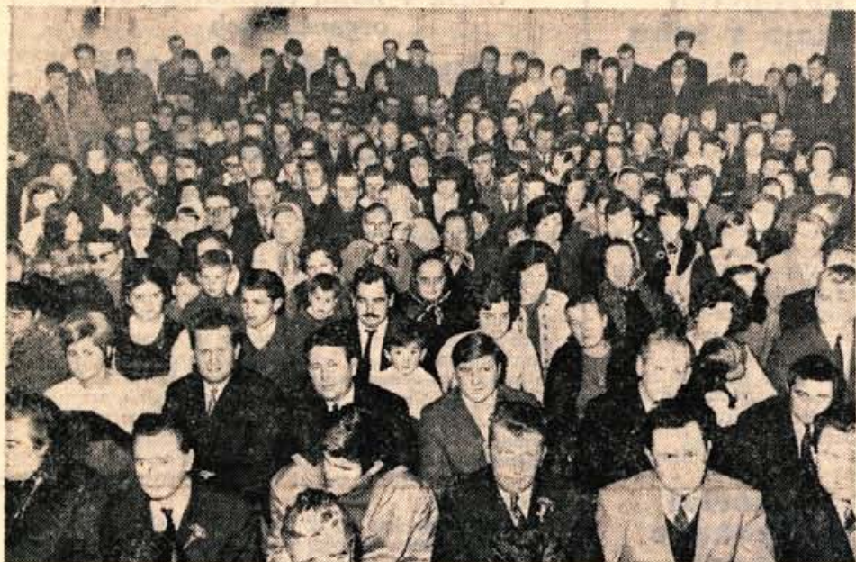
Dupljanci pravijo, da že dolgo ni bilo take prireditve