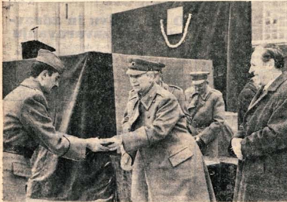
Tako kot drugod v državi je bila tudi v garniziji JLA v Kranju slovesnost ob 22. decembru, dnevu jugoslovanske armade. Ob tej priložnosti so najprizadevnejši vojaki in starešine prejeli nagrade in priznanja (jk)

GLASILO SOCIALISTIČNE ZVEZE DELOVNEGA LJUDSTVA ZA GORENJSKO