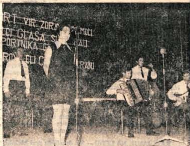
Veseli trgovci s pevko Bogatajevo