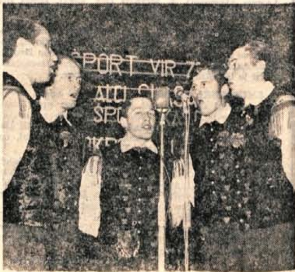
Fantje s Praprotna so »pomagali« Slaku