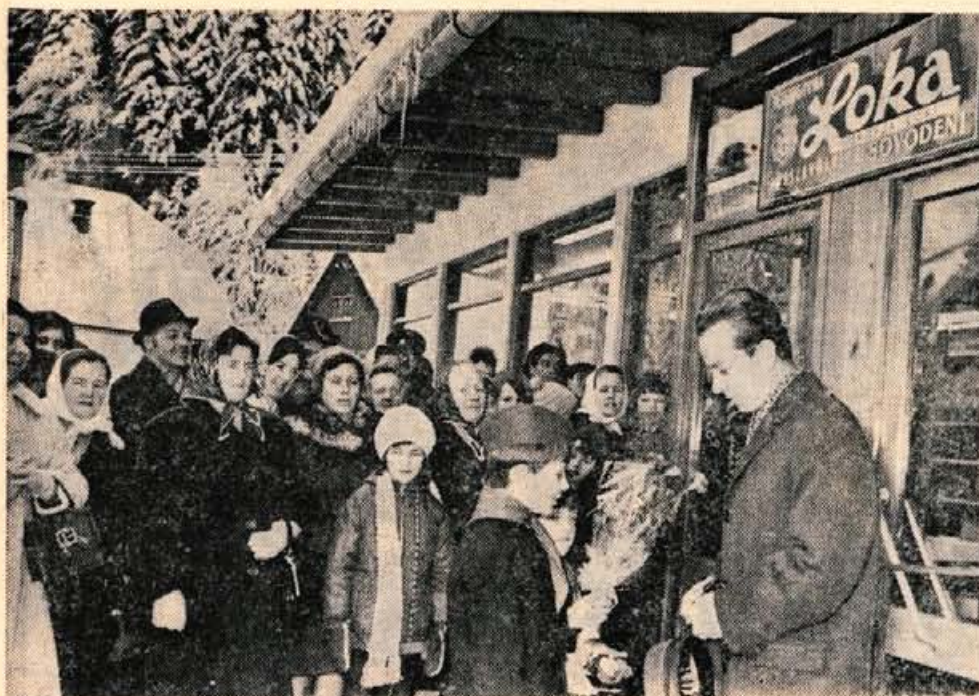
V nedeljo je v Sovodnju v Poljanski dolini vletrgovina Loka odprla samopostrežno trgovino