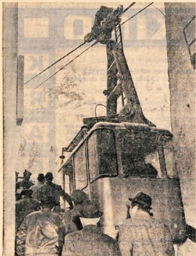
Prenovljena gondolska žičnica na Vogel je gotovo velika pridobitev za bohinjski turizem, obenem pa ponovna delovna zmaga Transturista iz Škofje Loke. Ena sama gondola bo lahko v pičlih štirih minutah prepeljala na 1500 metrov visoki Vogel kar 30 smučarjev. (Jk)