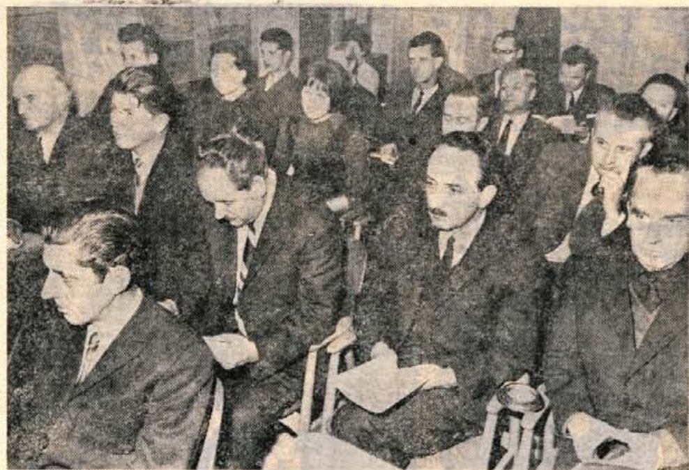
Predstavniki delovnih organizacij so se na ponedeljkovem posvetovanju na Zavarovalnici v Kranju seznanili z dejavnostjo Zavarovalnice in podprli njeno željo po še tesnejšem obojestranskem sodelovanju.