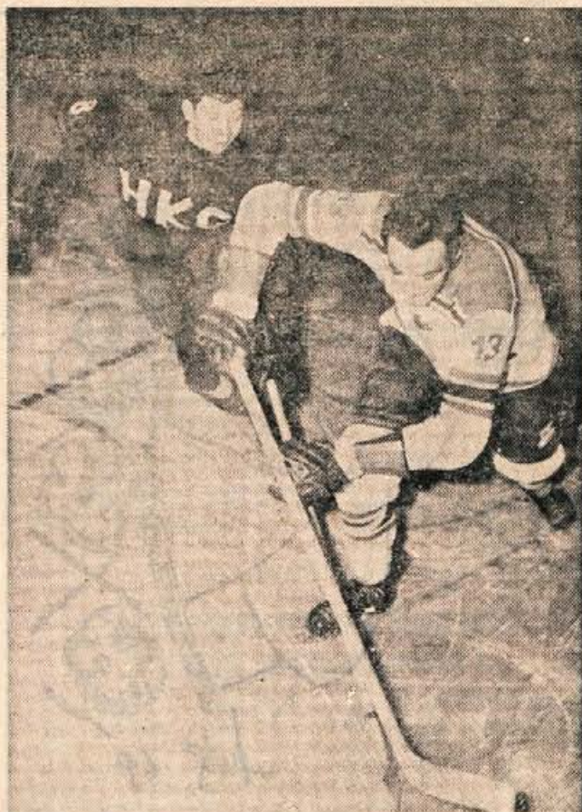
Na igrišču pod Mežakljo bo v nedeljo zvečer ob 18. uri mednarodna hokejska tekma za alpski pokal med Innsbruckom in Jesenicami.