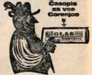
Časopis za vse Gorenjce