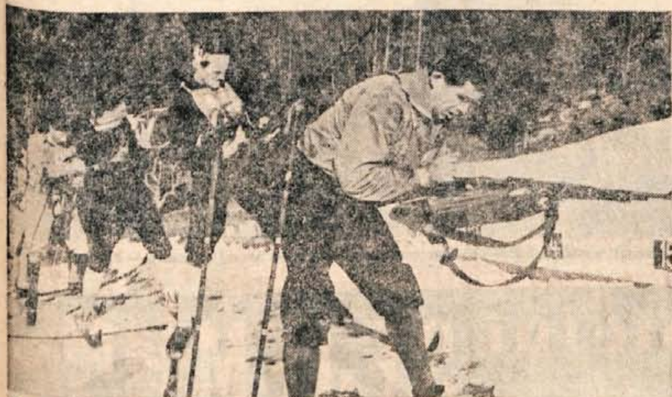
Na Pokljuki bo jutri, v nedeljo, spominsko tekmovalje memorial Prešernove brigade, na katerem bodo nastopili skoraj vsi najboljši slovenski smučarski tekači.