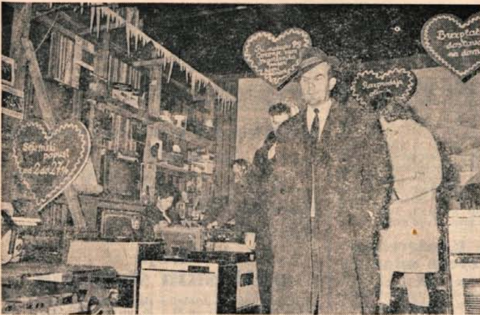
X. novoletni sejem v Kranju bo odprt do 26. decembra.