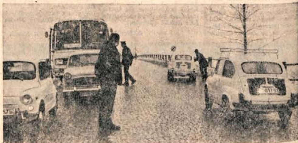
V četrtek zaradi poledice ponekod vozila niso mogla ne naprej ne nazaj.

Na voljo je še nekaj vstopnic v trgovini »Klemenček« v Zg. Dupljah. J. Javornik