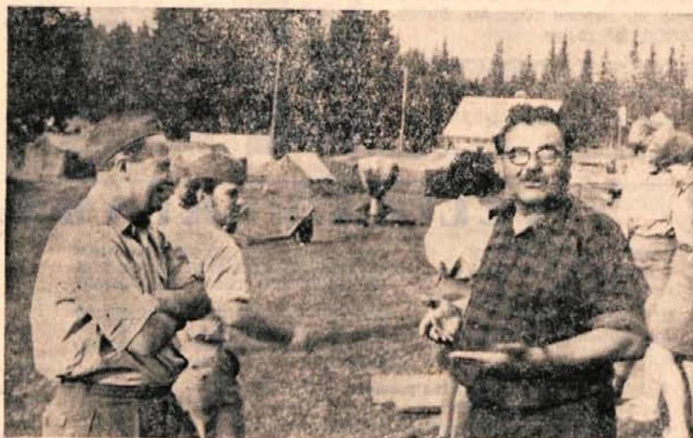
Kdo bo branil domovino? Mi vsi! — Prizora z vaje protiletalske enote jeseniške železarne na Pokljuki.

O vprašanih obrambe torej ne odločajo samo profesionalci, temveč samoupravni organi v delovnih organizacijah, občinske in republiške skupščine itn. Le-te imajo same pristojnost, da odločajo o ustanovitvi teritorialnih enot, samoupravni organi v podjetjih pa imajo pravico in dolžnost, da ustanavljajo enote po podjetjih. Vsi ti družbeni organizmi (občine,