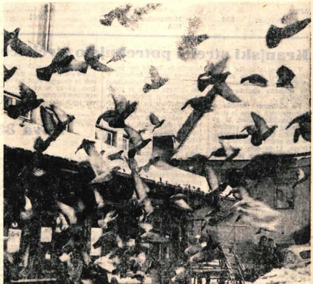
Zima je precej neprijeten čas tudi za pernate prijatelje. V ponedeljek je naš fotoreporter po krajšem obhodu v Kranju videl, da na običajnih mestih ni krmilnih hišic. Zato pa je bil toliko večji ptičji živ žav na kranjski tržnici. Vendar da smo včeraj (torek) ob 13. uri že opazili krmilne hišice.