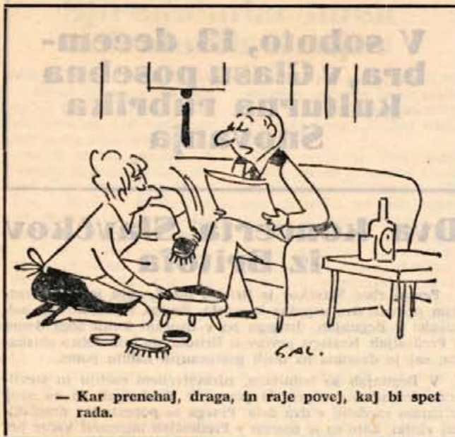
— Kar prenehaj, draga, in raje povej, kaj bi spet rada.