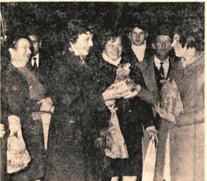
Obdarili sta nas trgovski podjetji Zivila iz Kranja...