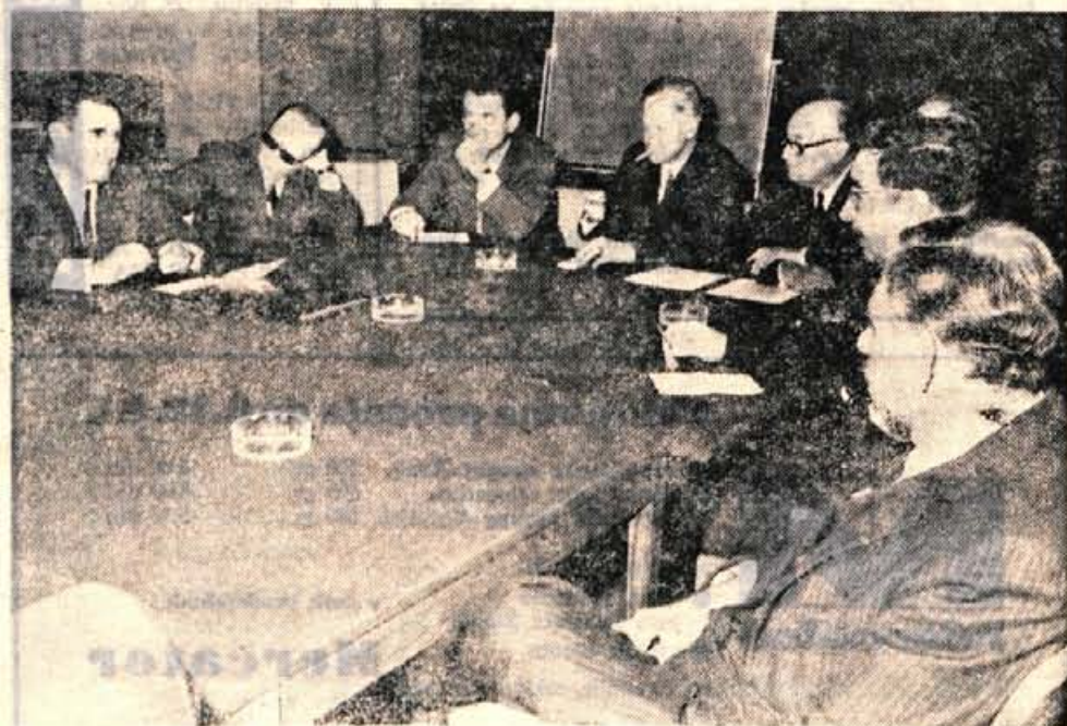
S posvetovanja z ameriškim finančnim strokovnjakom v Golf hotelu na Bledu