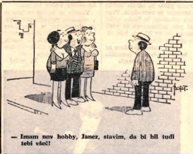
— Imam nov hobby, Janez, stavim, da bi bil tudi tebi všeč!