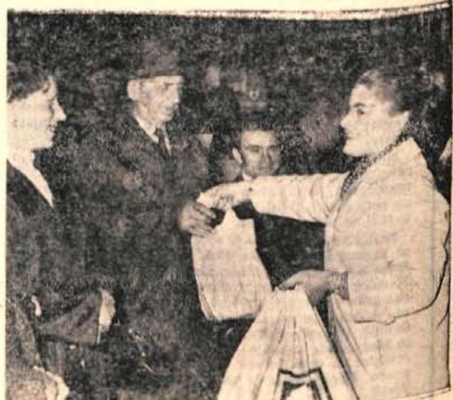
In Specerija z Bleda — Foto: F. Perdan

Zgodaj popoldne smo priromali v Kanal. Spremljala nas je toliko opevana in v zgodovini nešteto krat krvava Soča. V soboto je bila kalna, deroča, naravnost strašna. Bruhala je prek zapornic Dobljarja in Plav. Hropečče se je zvijala v vrtincih.