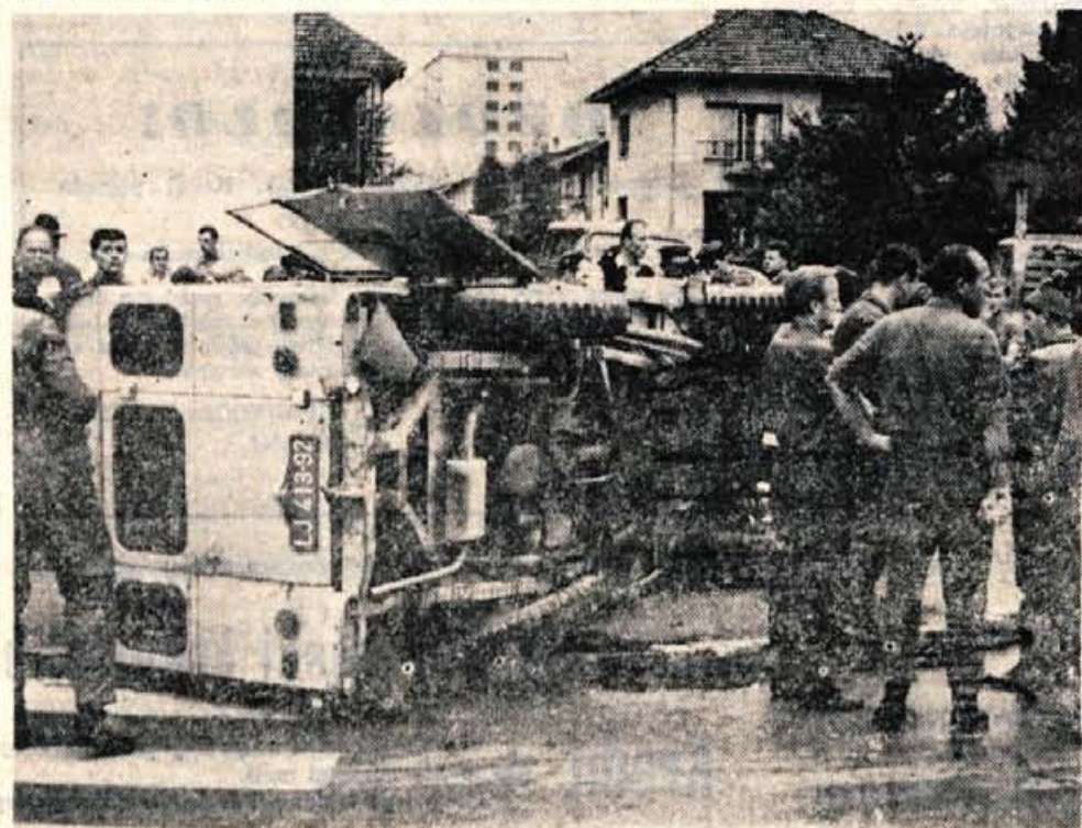
Zaradi izsiljevanja prednosti se je v ponedeljek dopoldne zgodila prometna nesreča na Oldhamski cesti v Kranju.