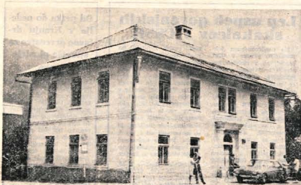
Stara šola v Kranjski gori