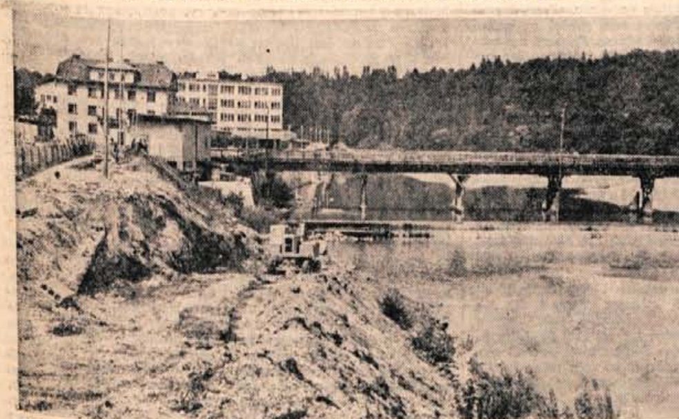
Minulo sredo so v Kranju začeli z gradnjo mostu čez Savo. Predvideno je, da bo most končan prihodnjo pomlad. Z mostom bodo povezali Šavski log, kjer bodo v prihodnje sejemski prostori.