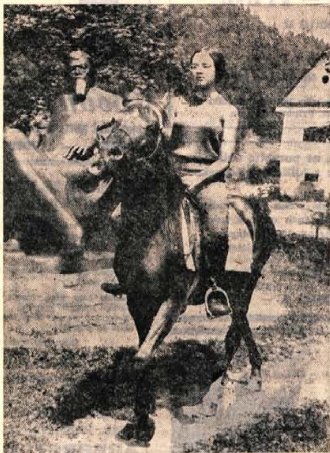
Dekle in konj — in bronasti Tavčar, ki dostojanstveno zre prek travnikov, po katerih je tudi sam nekoč jahal