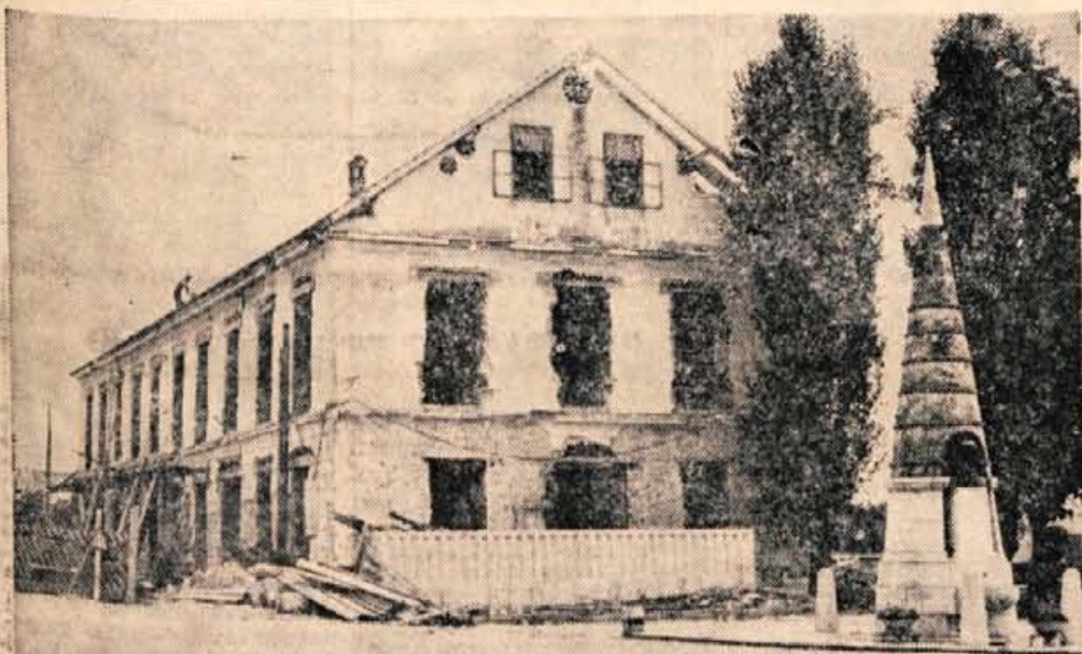
Veletrgovina Zivila Kranj gradi v Cerkljah novo blagovno hišo. Uredili jo bodo v stavbi nekdanje šole. To bo ena najlepših podeželskih blagovnih hiš na Gorenjskem.

Ogled vsak dan od 12. do 14. ure do dneva licitacije