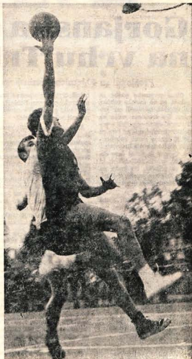
Spet so se odprla košarkarska igrišča. V republiški košarkarski ligi so že startali člani in članice.

Ob koncu priprav pa so bili tudi izpiti za pasove, kjer si je sedem članov Triglava priborilo višje pasove. Zadnji dan pa je bila pregledna tekma med ekipo Ljubljane in tečajniki. Po ogorčenih borbah je tesno zmagala Ljubljana z 29:26. R.