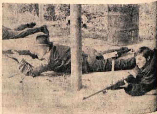
Z občinskega prvenstva v malokalibrski puški

nu je voda zalila staro železniško postajo, v Hrušici je Sava načela svoj desni breg, nevarno pa je bilo tudi v Kropl. Po zadnjih podatkih narašča le še Sava, medtem ko njeni pritoki upadajo. J. K.