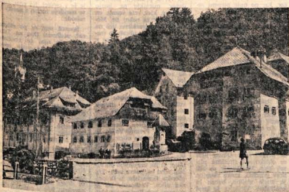
Kropa — rojstni kraj umetnega kovaštva

V galeriji na Loškem gradu je odprta razstava II. Groharjeve slikarske kolonije do konca avgusta.