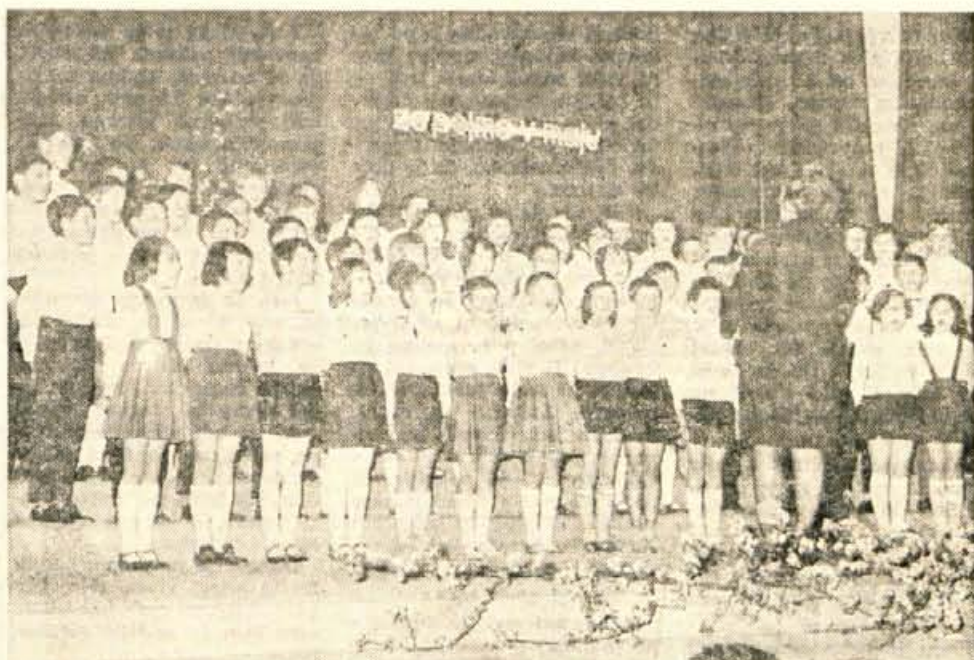
V Cerkljah na Gorenjskem je bila v nedeljo popoldne revija pevskih zborov iz kranjske občine. Na sliki: pevski zbor osemletke Lucijan Seljak iz Kranja