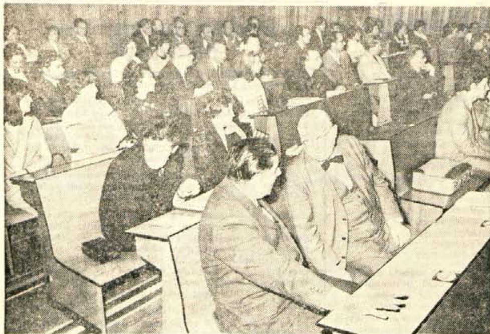
V ponedeljek se je v Kranju začel kolokvij o srednjem veku.