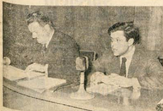
V petek popoldan, kot smo že poročali, je predaval v Kranju nekaterim članom gorenjskih občinskih konferenc ZKS — tovariš Milan Kučan, član sekretariata centralnega komiteja ZKS. Tovariš Kučan je govoril o reorganizaciji Zveze komunistov.