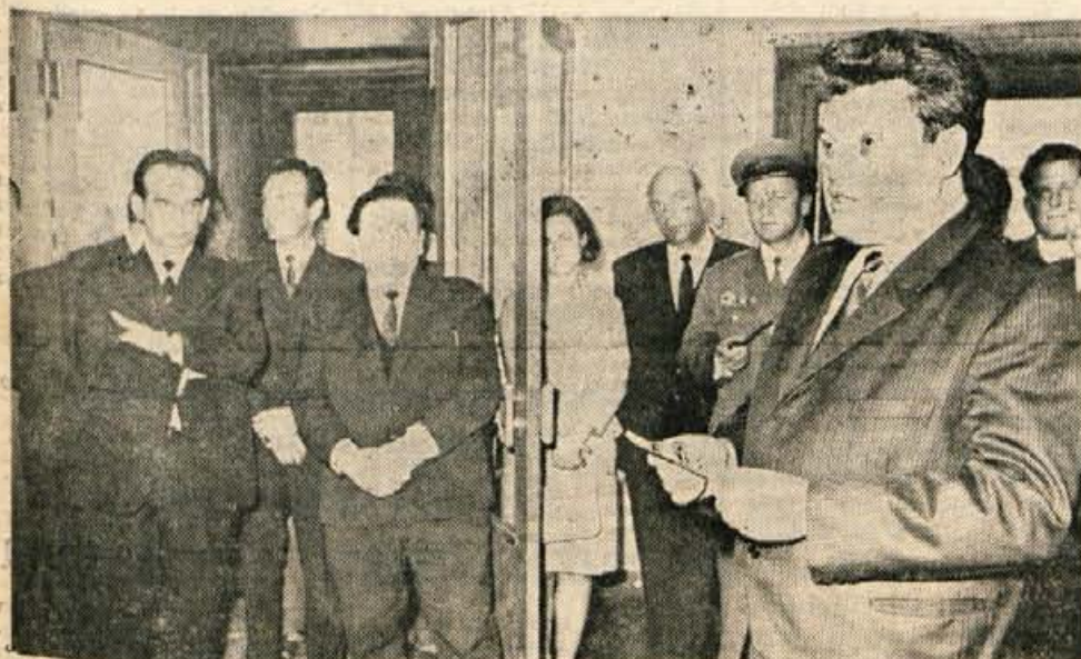
Ob 25. obletnici ustanovitve organov za notranje zadeve sta Gorenjski muzej in Uprava javne varnosti v galeriji Mestne hiše v Kranju odprla v ponedeljek razstavo VOS na Gorenjskem. Razstava bo odprta do 18. maja.

GLASILO SOCIALISTIČNE ZVEZE DELOVNEGA LJUDSTVA ZA GORENJSKO