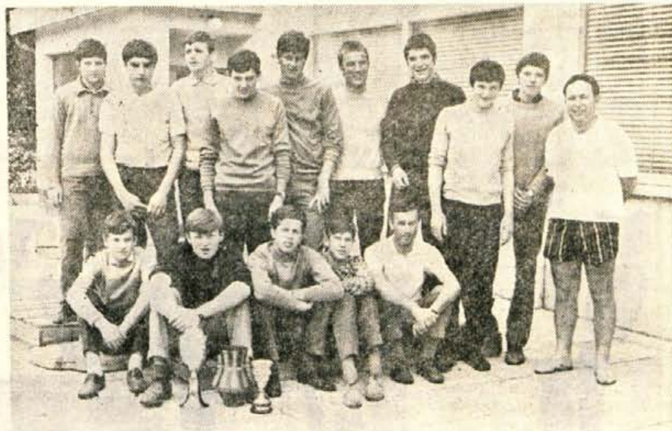
Mladi vaterpolisti kranjskega Triglava so na nedavnem vaterpolo turnirju zasedli prvo mesto.