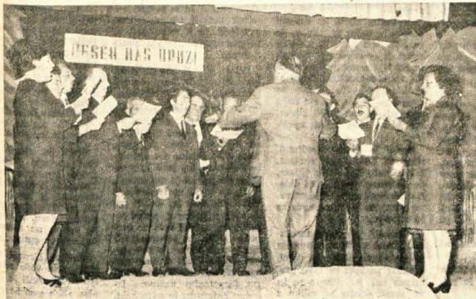
V nedeljo popoldne je bila v Zalogu pri Cerkljah revija pevskih zborov. Na sliki: mešani pevski zbor iz Zaloga.