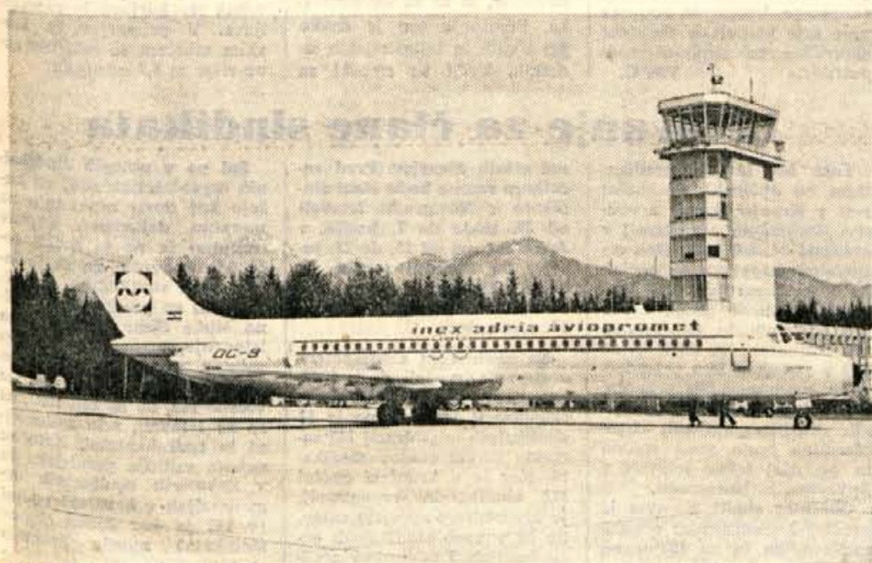
DC-9, »Ljubljana« bodo danes (sreda) popoldne na brniškem letališču še »krstili«

GLASILO SOCIALISTIČNE ZVEZE DELOVNEGA LJUDSTVA ZA GORENJSKO