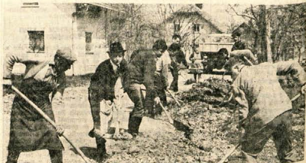
Prebivalci Srednje vasi pravijo, da bodo do 25. maja končali vsa dela na cesti. ←

Pravijo, da bodo vsa dela končali do 25. maja, nakar bodo cesto asfaltirali.