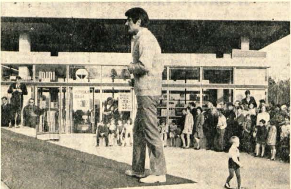
Pred prazniki je Trgovsko podjetje Murka Lesce pri avtobusni postaji v Radovljici odprlo novo »mini« trgovino. Dan pred otvoritvijo so pripravili pred trgovino modno revljo, kjer je tovarna Rašica prikazala svoje izdelke.