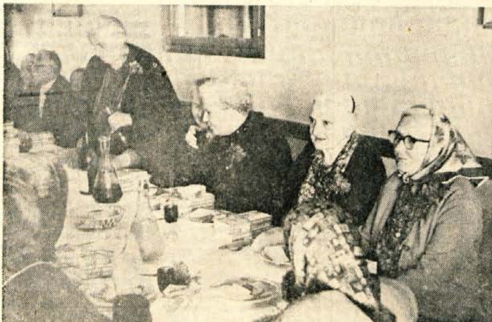
Kranjski upokojevcji so za 1. maj počastili vse 80 let stare člane

več angleških ljudskih pesmi. Omenjene skladbe kaj redko zaidejo k nam. Zato in pa zaradi mladostnega žara ter kvalitetne izvedbe predvajanih del smo bili nad programom navdušeni. Radio Ljubljana je koncert posnel na magnetofonski trak. Oddaja bo na sporedu v četrtek, 8. maja, ob 14.05. uri. Gotovo ji boste z veseljem prisluhnili.