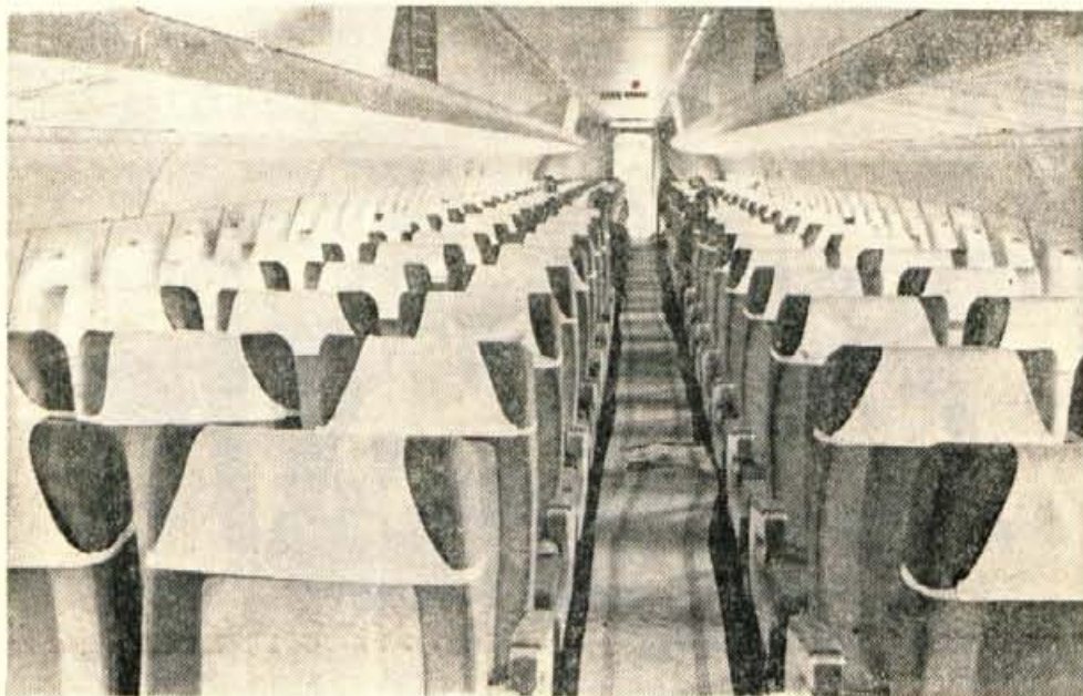
Novi, moderni avion lahko sprejme 110 potnikov.