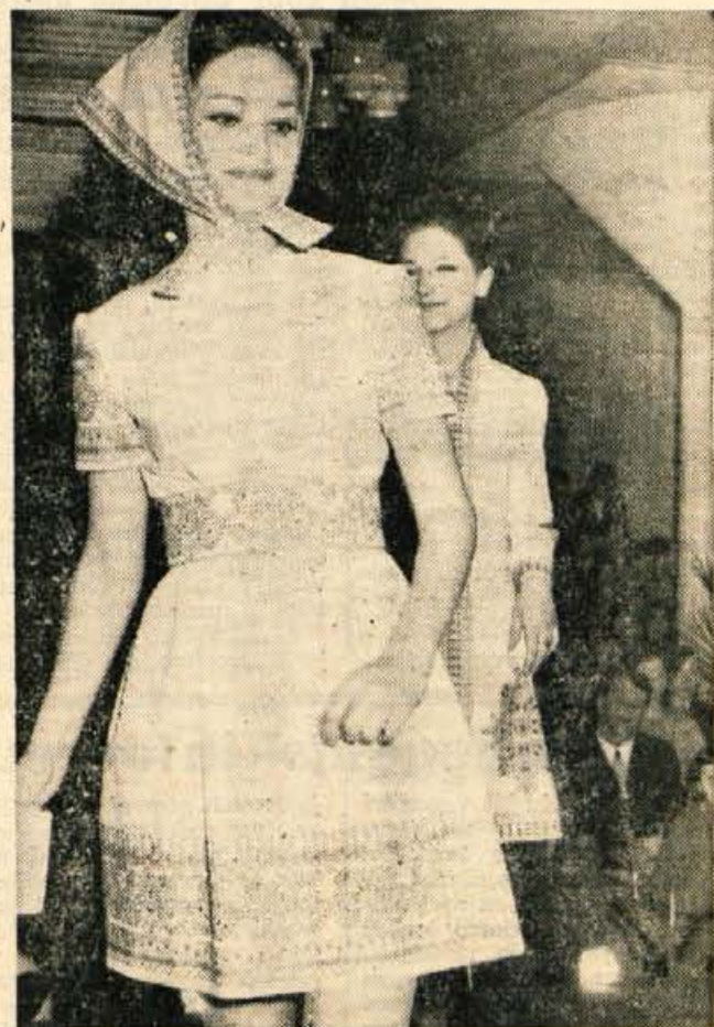
Moda je letos sprejela tudi nekaj folklornih elementov. Na sliki je ljubka poletna obleka iz tkanine Solun potiskana v narodnem vzorcu. Blago so tiskali v Tekstilindusu Kranj.