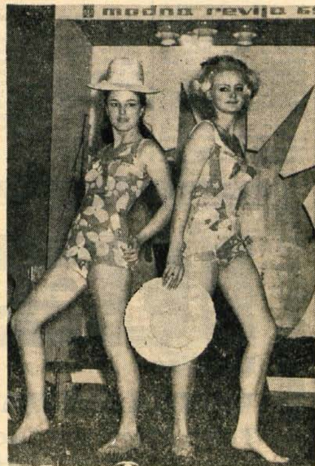
Na modni reviji v okviru spomladanskega sejma je zelo veliko kopalnih oblek. Med zelo lepimi sta tudi ta dva modela enodelnih kopalnih oblek ljubljanske tovarne Pletenina.

KONFEKCIJA za ženske KONFEKCIJA za moške KONFEKCIJA za otroke