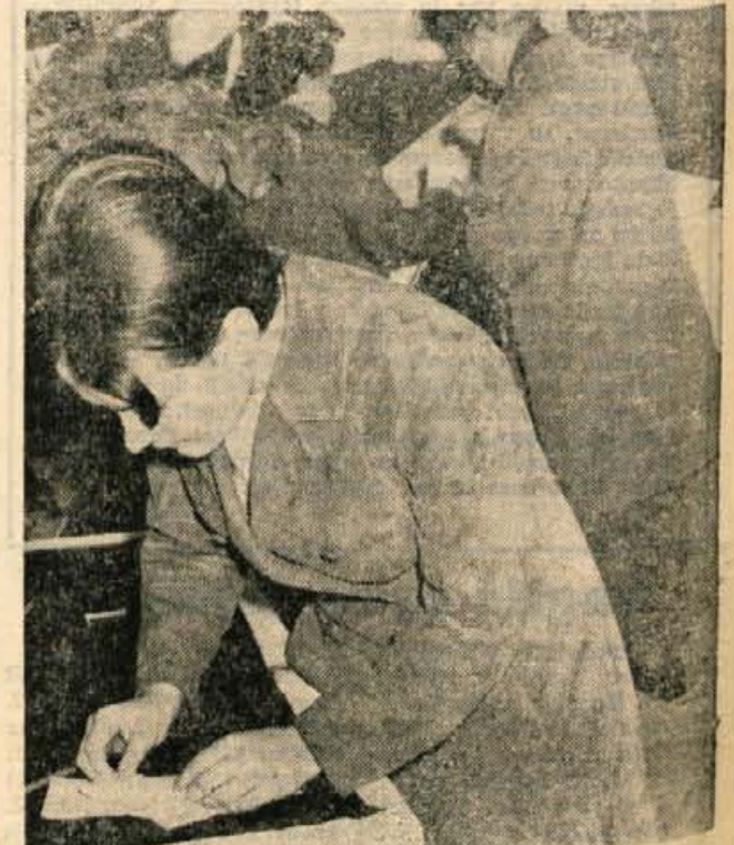
Na nedeljskih volitvah so na Gorenjskem mladi volili med prvimi.