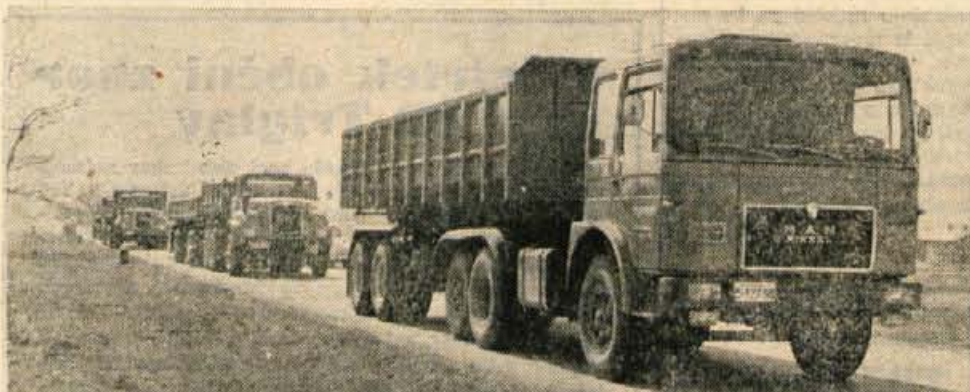
Pred kratkim je Transport biro v Radovljici dobil pet novih kamionov. Medtem ko so avtomobile uvozili (dela jih tovarna MANN), pa so prikolice nabavili pri tovarni Vozila v Novi Gorici. Cena za en takšen avtomobil s prikolico je 40 milijonov starih dinarjev, skupna nosilnost pa 40 ton (avtomobil 22 in prikolica 18 ton).

Vseh pet avtomobilov bo v ponedeljek ali torek odpeljalo v Irak. Peljali jih bodo po kopnem skozi Bolgarijo, Turčijo, Sirijo v Irak (4000 kilometrov). V Iraku bodo delali do začetka gradnje ceste Sentilj—Nova Gorica, ko se bodo vrnil in pomagali pri gradnji te avtomobilske ceste.