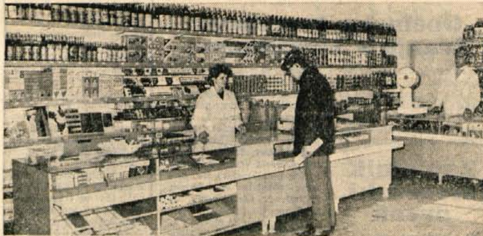
Kmetijska zadruga Naklo je v ponedeljek odprla preurejeno trgovino. Preureditev je veljala 10 milijonov starih dinarjev. Kasneje nameravajo urediti še skladišča in bife.