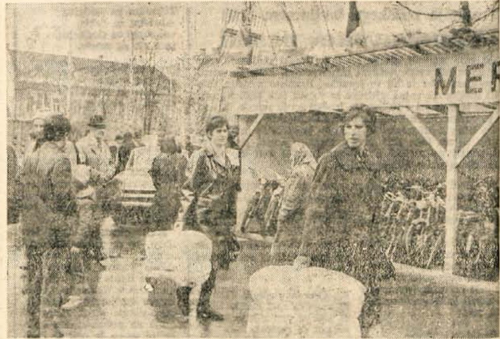
V prvih dveh dneh si je osmi spomladanski sejem v Kranju ogledalo prek 10 tisoč obiskovalcev.