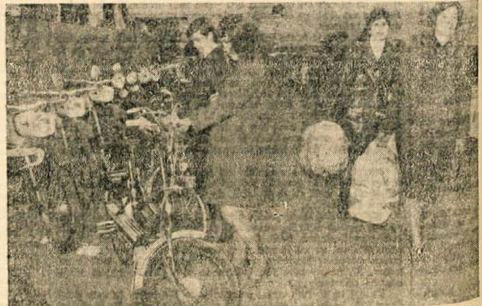
Razstavljalni prostor Slovenija avto je zelo zanimiv. Največjo pozornost vzbuja motorno kolo pony express, ki še ni v prodaji.

Naročite na naslov: ČZP »KMEČKI GLAS«, Ljubljana, Miklošičeva 4/1