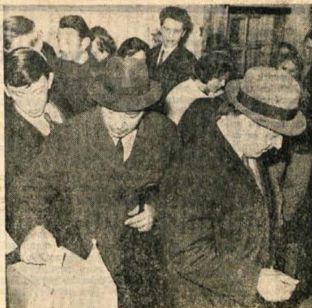
Podobno kot je bilo v nedeljo dopoldne na volišču na Kokrici je bilo tudi drugod na Gorenjskem.

Se priporoča kolektiv: prodajalne GORENJC — Kranj, Prešernova 11