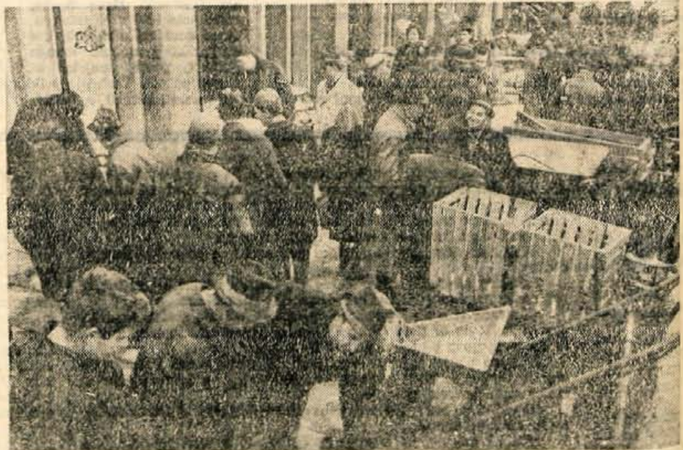
Kmetijske stroje in opremo razstavljata KZK Kranj in KZ Sloga. Škoda, da se oba razstavljalca nista odločila tudi za dajanje praktičnih nasvetov.