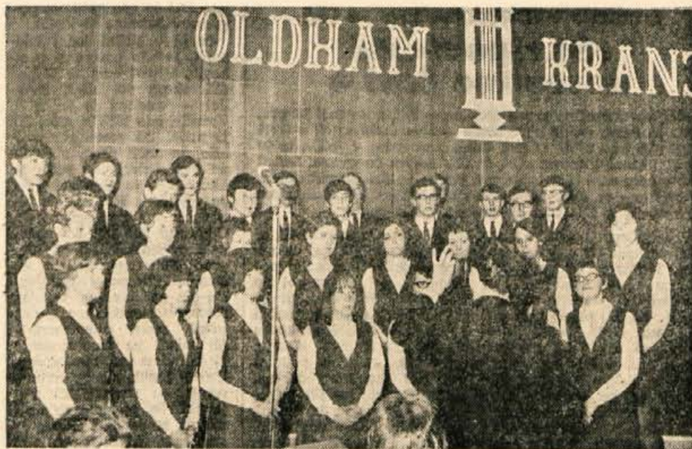
Mladi pevci iz Oldhama so med nedavnim obi v Preddvoru. rani občinske skupščine in enega v osnovni šolski v Kranju priredili tri koncerte; dva v dvo-

Če imajo svojci smrtno ponesrečenega pripadnika JLA poleg pravice do enkratne denarne pomoči še kakšne druge odškodninske zahtevke, potem se tudi v tem primeru zaradi odškodninske obrambe najprej na vojaško pravobranilstvo, kolikor pa v roku 3 mesecev s pravobranilstvom o tem vprašanju ne dosežejo sporazuma, imajo možnost, da svoj zahtevek uveljavljajo pred sodiščem splošne pristojnosti. Vedeti pa je treba, da se po praksi sodišč že izvensodno izplačana enkratna denarna pomoč upošteva pri presoji ev. poznejših zahtevkov za povračilo nematerialne škode.