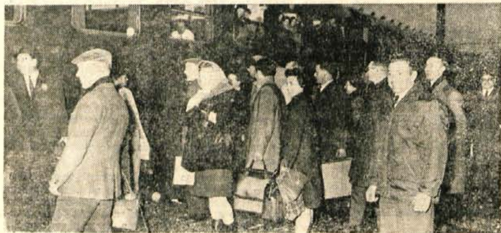
V petek zvečer je prispela v Trzič na dvodnevni obisk 48-članska skupina iz pobratenega mesta Ste Marie aux Mines.