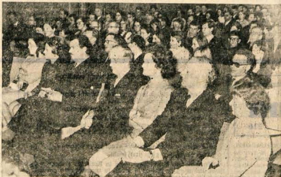
V petek zvečer se je koncerta mladih pevcev in godbenikov iz Oldhama udeležil tudi angleški konzul iz Zagreba.