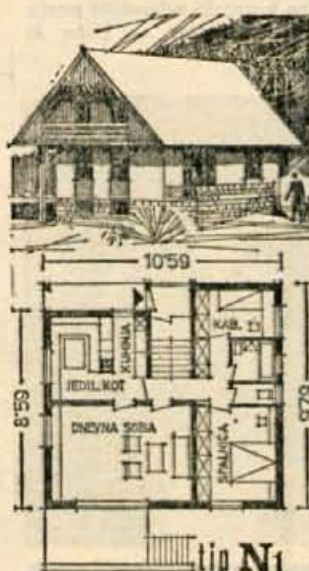
In načrti po naročilu