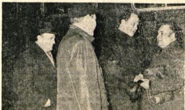
Goste iz Ste Marie aux Mines je na kranjski železniški postaji sprejel predsednik tržiške občinske skupščine.