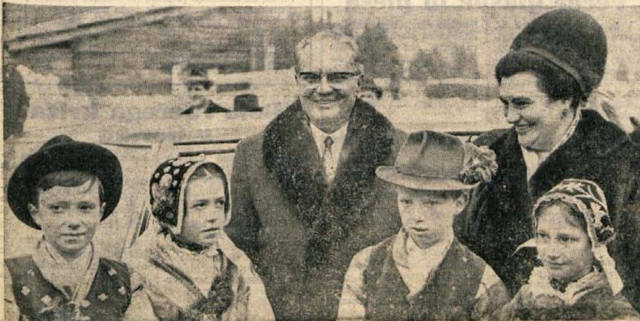
Predsednika republike Tita so pozdravili tudi mladi gorenjski pionirji in pionirke — domačini iz Rateč v gorenjskih narodnih nošah. — Foto: F. Perdan. — (Reportažo o planiški prireditvi berite na 20. in 24. strani)