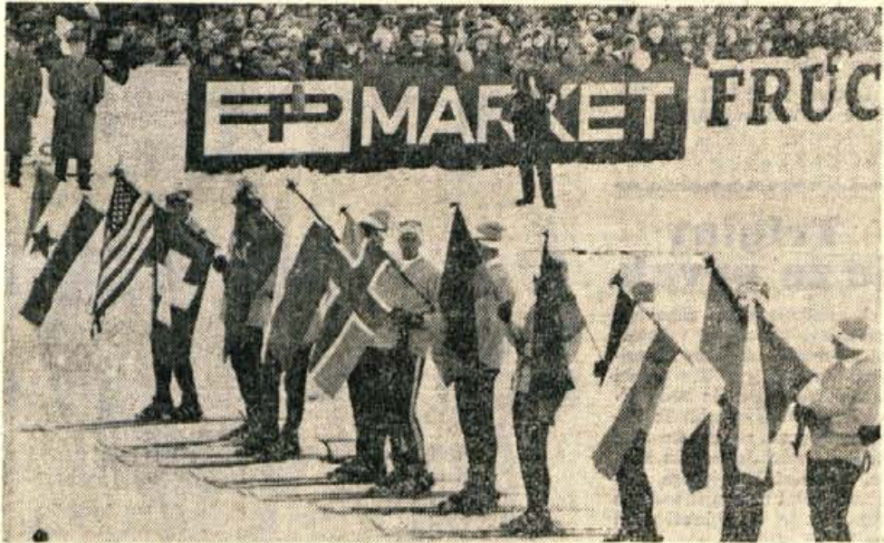
Vsak dan so planiške prireditve simbolično otvorili naši alpski smučarji.