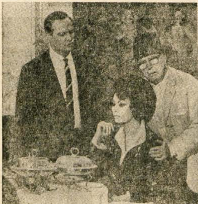
Charlie Chaplin pojasnjuje v nekem londonskem filmskem studiju S. Loren in M. Brandu prizor iz njegovega zadnjega filma Grofica iz Hongkonga. Tako Brando kot Lorenova sta izjavila, da je s Chaplinom snemali filma prava zabava, saj ve že od vsega začetka, kaj hoče. Morda pa, sodeč po filmu, Chaplin tega to pot le ni najboljše vedel.