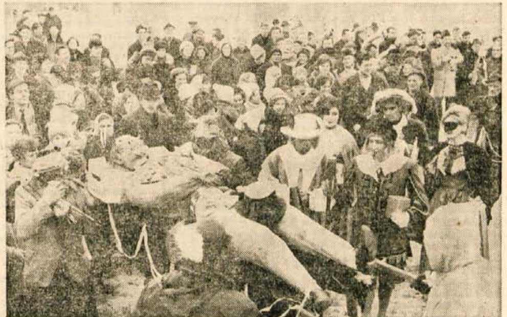
Pustni pogreb je med Trzičani vzbudil precejšnje zanimanje. Zato so tudi pozorno spremljali pogrebne slovesnosti, posebno takrat, ko so ga nesli na morišče. — F. Perdan