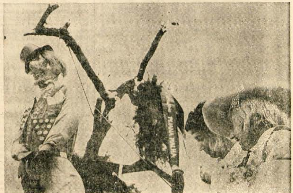
Fotografija nazorno kaže, kako žalostna je bila smrt tržiškega Pusta. Ganljive poslovljne besede njegovih najbližjih sorodnikov in plamen bo objel njegovo premrlo truplo. — F. Perdan

Sredstvo za osvežitev prostorov je izdelano iz prvovrstnih esenc z vonjem bora in lavande