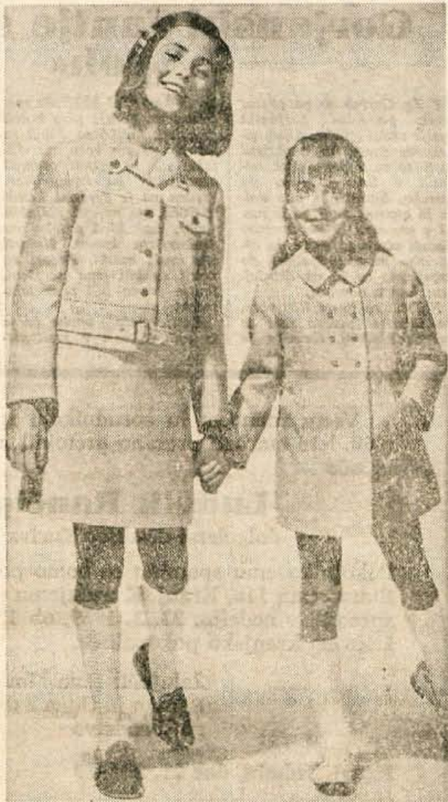
Za prve sončne dni bo dvanajsletna deklica oblečena v svetel komplet obleke, čez katero nosi športno ukrojeno jopo. Za okoli osem let staro deklico pa bo prav lep plašč z dvojno vrsto gumbov. Spodaj nosi deklica obleko iz istega blaga.

Marta odgovarja — Klasičen model kostima je vedno popularen in ravno sedaj spet prodira v modni svet. Izbrala sem ga tudi za vas. Vi pa izberite res dobro šiviljo, da se boste potem v kostimu dobro počutili. K vašemu dobremu kostimu boste lahko oblekli bluzo oranžne barve, rumene, zelene, rjave in bele. Bluza je lahko iz poplina, najlona ali svile.