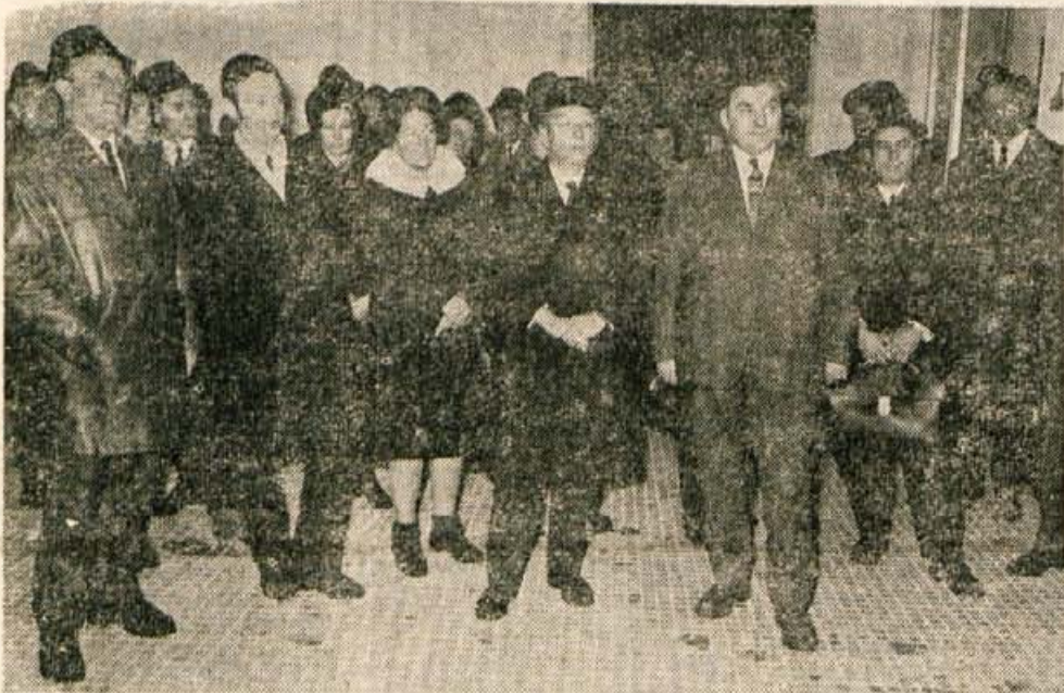
Otvoritve so se udeležili predstavniki družbenopolitičnih organizacij, poslanci in drugi