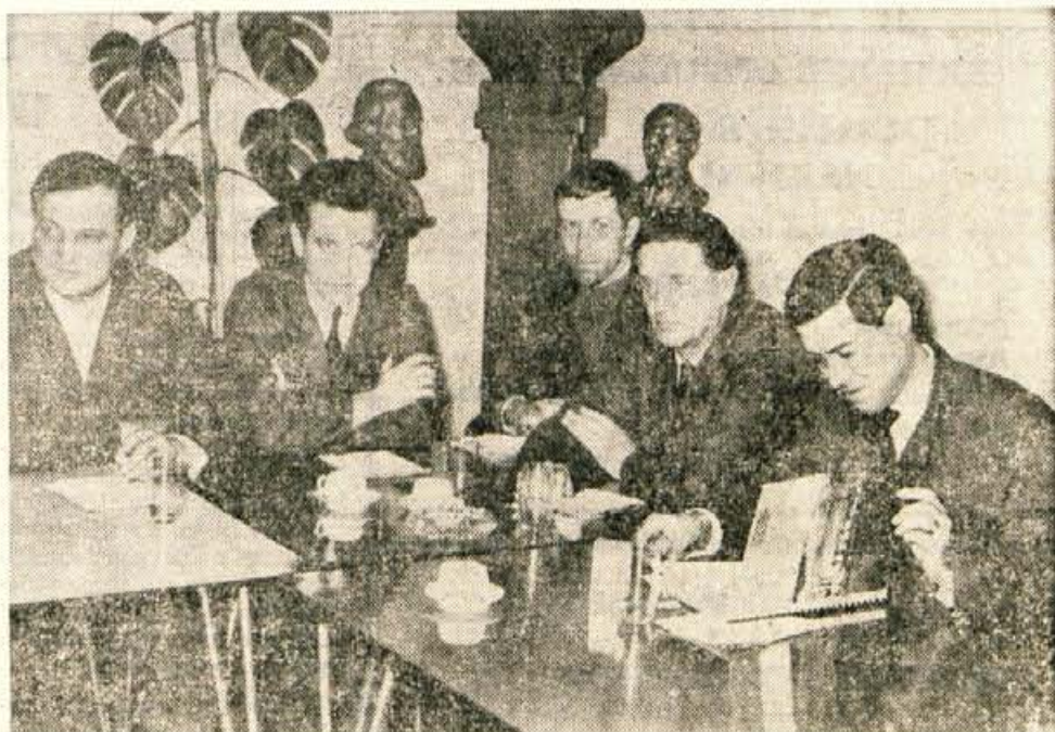
Med simpozijem o uporabi barvil v tekstilnem tisku so strokovnjaki iz Tekstilindusa v Kranju omogočili udeležencem tudi praktičen prikaz uporabe novih barvil.