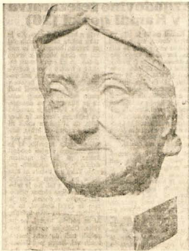
Ernestina Jelovšek — portretna skica v glini; pomožna predloga za Prešernov kip

Sodobnikom je bilo tedaj močno žal, da med predlo-