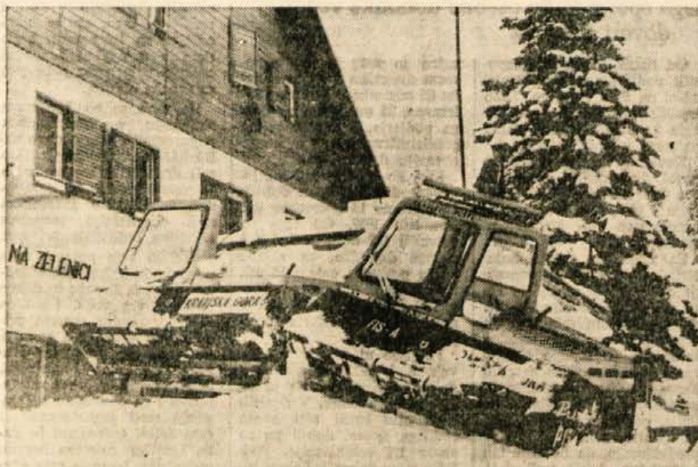
Smučanje na Zelenici je v torek zmotilo močno brnenje. Prvič, odkar je na vrh Zelenice speljanz. žičnica, je namreč prav pred dom na Zelenici pripeljal teptalni stroj italijanske znamke prinoth. Teptalni stroj je namreč naročil Kompas, da bi se pripravil, ali se ga izplača kupiti. Kot so nam povedali, tehta teptalni stroj okoli ene tone, stane pa okoli 16 milijonov S dinarjev. (vig)