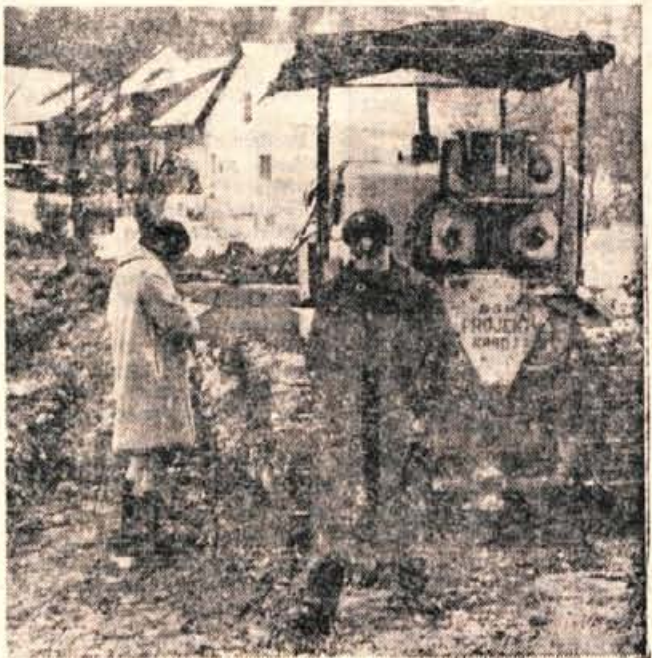
Prizorišče nesreče

Ciril Drinovec je bil star 56. let. Pred kratkim je bil upokojen. V Struževem se je ukvarjal s cestnimi deli, zato je tudi bil na delovišču, kjer s prstjo zasipajo globok jarek, prek katerega naj bi kasneje peljala pot. L. M.