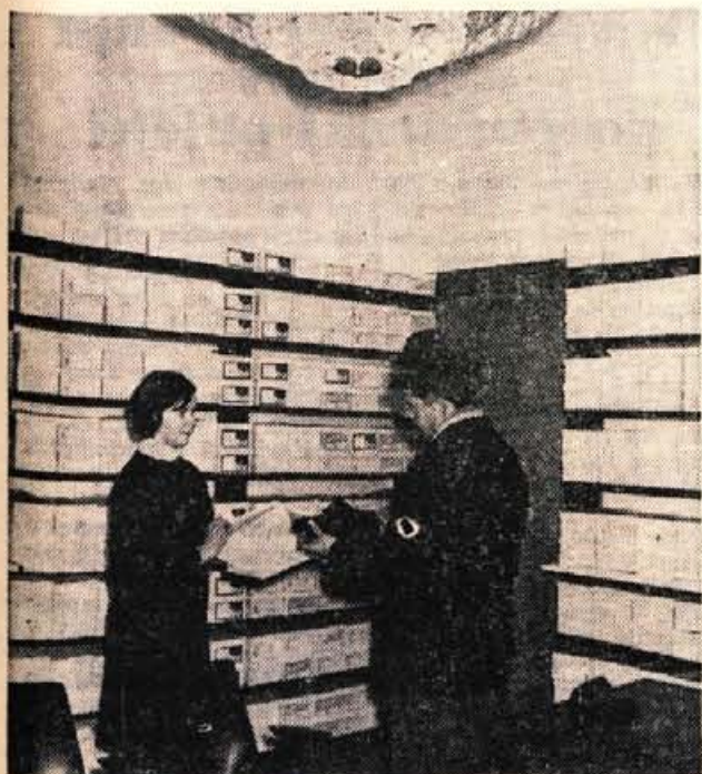
Trgovsko podjetje Elita Kranj je pred kratkim v Jenkovi ulici v Kranju odprlo specializirano prodajalno obutve. V trgovini prodajajo ženske in moške čevlje tovarne iz Kumarnovega. Založeni so predvsem z obutvijo z usnjenimi podplati. (až)