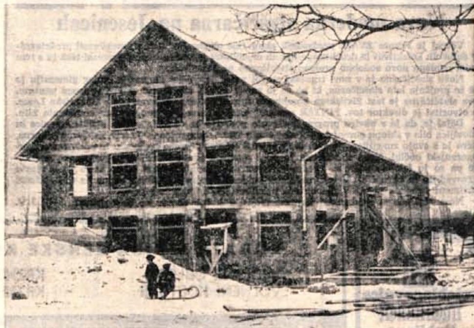
Nov gospodarski objekt Kmetijske zadruge Cerklje v Voklem

Prodaja bo v Cankarjevi 2 v četrtek, 19. 12. 1968 od 12.30—13.30.