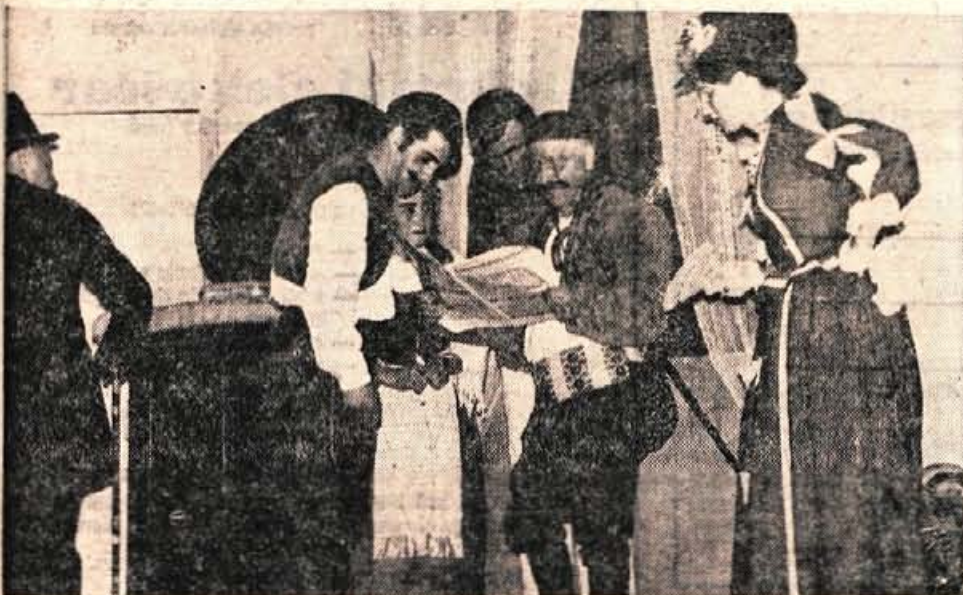
Jara meščanka na brezniskem odru

PRODAJA ČOKOLADE, SLAŠCIC IN ZGANIH PIJAC