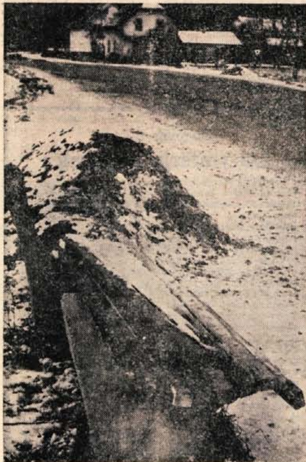
Tale posnetek pa je naš fotoreporter naredil na avtobusnem postajališču na Polici. Podrta klopa in kup peska že nekaj mesecev čakata! (aže)