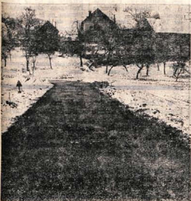
Del asfaltirane ceste pred Olševkom

Nadalje so obravnavali še novo razmerje sil v oborožitvi, gospodarski in politični moči SZ in ZDA, primere imperialističnega pritiska v Aziji, Afriki in Latinski Ameriki, prisotnost tujega ladjevja v Sredozemskem morju in položaj na Balkanu. Ko so delegati razpravljali o vključevanju Jugoslavije v mednarodno delitev dela, so menili, da moramo dosledno integrirati zunajtrgovinski in devizni sistem v našem celotnem gospodarskem sistemu.