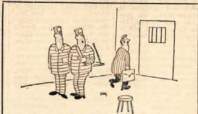
— Moj advokat je zelo sposoben. Za začetek mi je pustil pilo...

Med ljudmi »s kariero« pa najhitreje umirajo novinarji, nato pa književniki.