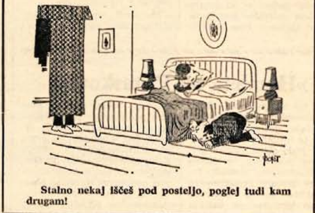
Stalno nekaj iščeš pod posteljo, poglej tudi kam drugam!