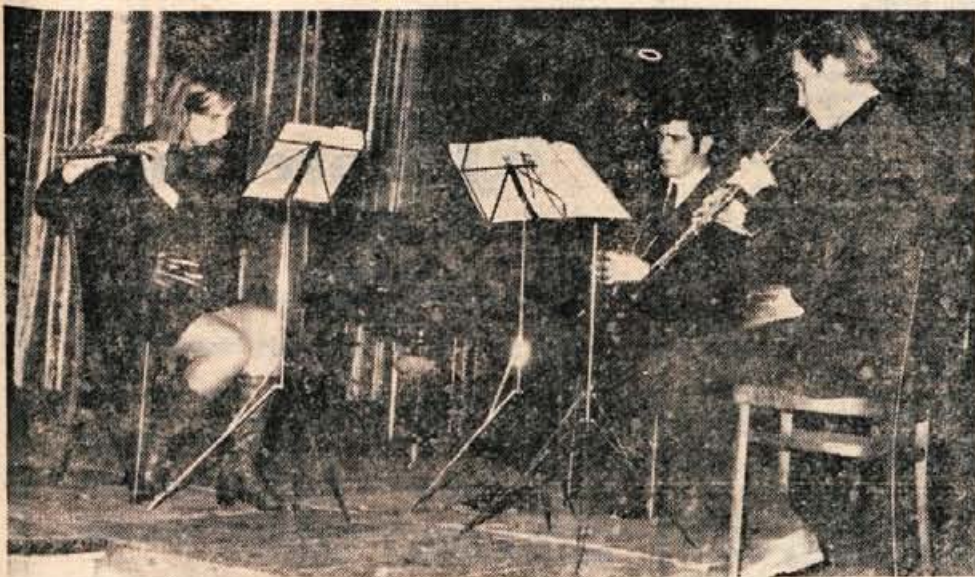
Čbelični trio glasbene šole z Jesenic med izvajanjem Beethovnevega Tria