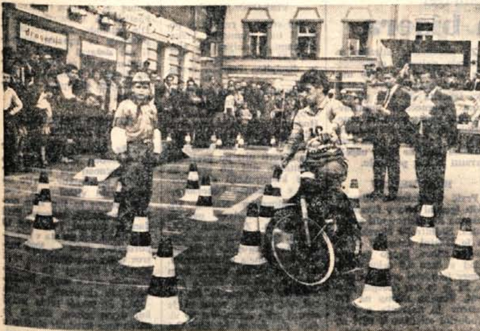
V soboto se je na spretnostni vožnji mopedistov na Titovem trgu v Kranju zbralo precej gledalcev. Prireditev je bila v okviru drugega zleta mopedistov, ki ga je organiziralo avtomoto društvo Kranj v sodelovanju s tovarno Tomos v Kopru.