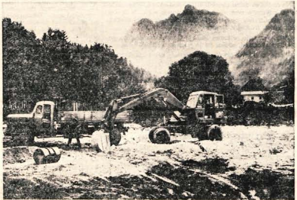
V začetku oktobra so začeli v Kranjski gori graditi novo osnovno šolo. Dosedanja šola je postala za nekaj manj kot štiristo učencev že zdavnaj pretesna, saj je stara že okoli sto let.

Razpisna komisija DS Predilnice volne Naklo