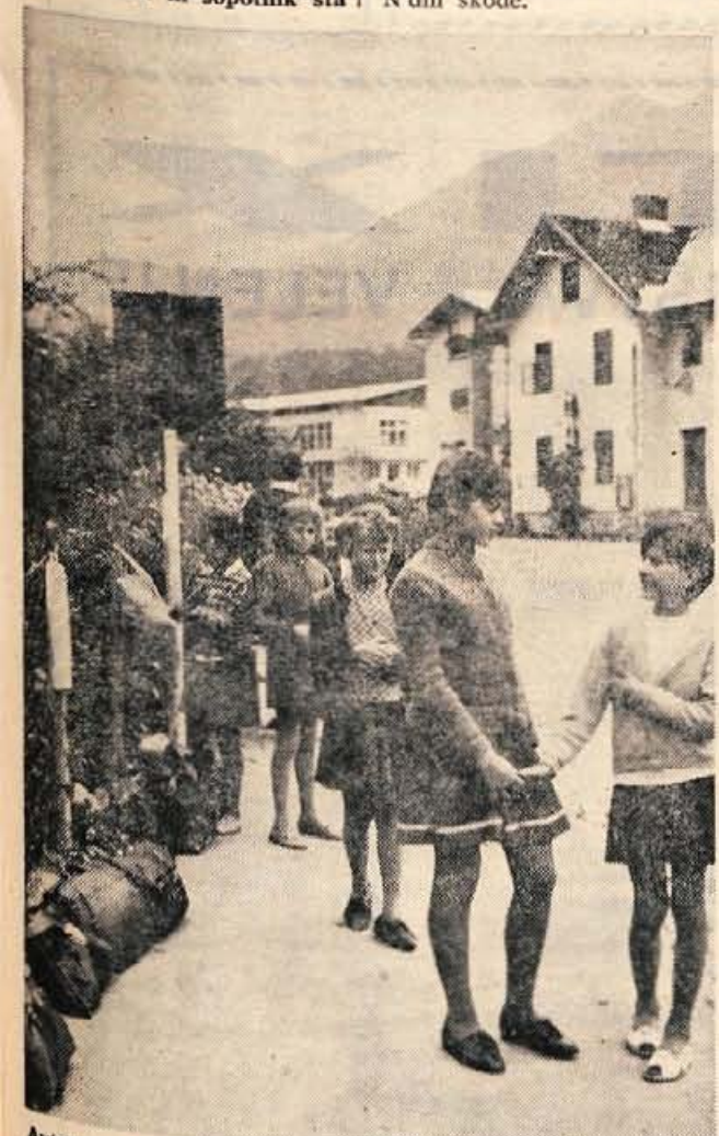
Avtobusno postajališče v Bohinjski Bistrici ni pokrito. Otroci oziroma šolarji tod vsak dan čakajo na avtobus.