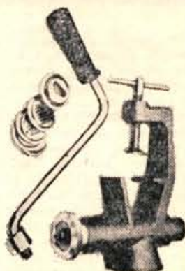
Strojček za popolno izdelavo domačih rezancev

Prijave s potrebnimi dokumenti sprejemamo do 31. oktobra 1968.