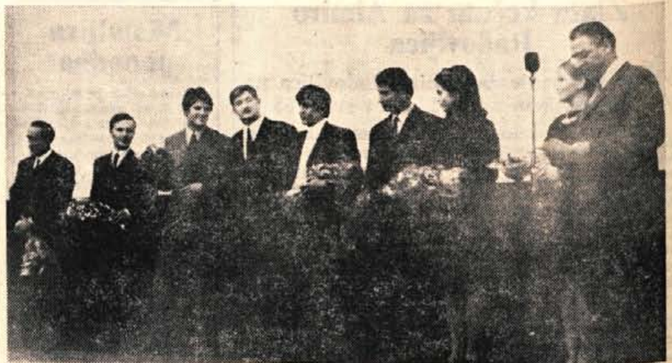
V soboto je bila v Kamniku v kinu Dom svečana premiera novega slovenskega filma Peta zasada. Po predvajanju filma so se občinstvu predstavili igralci in ostali ustvarjalci Peto zasade.

Pa ni ostal pri njej. Sodnik mu je odmeril kazen zaradi delomrzništva — mesec dni zapora. Odškodnine ni zahtevala. Svet osamljenosti mora biti zelo težak. Da bi preprečevali dvema življenje v dvoje? Nikakor ne. Življenje na račun navnošnosti osamljenih žensk ter delomrzništvo pa družba preganja. L. M.