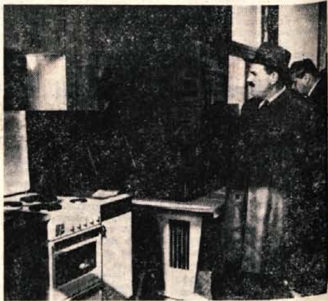
Prvi sejem obrti in opreme v Kranju si je že prvi dan ogledalo precej obiskovalcev.

V prvih treh dneh si je sejem ogledalo okrog 7000 ljudi. To pa je za prvi tovrstni sejem kar zadovoljivo. Prireditelji namreč pravijo, da večjega obiska tokrat tudi niso pričakovali. A. Z.