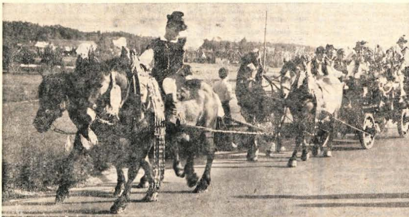
Dneva narodne noše, ta turistično folklorna prireditev je v Kamniku vsako leto prvo nedeljo v septembru, se je udeležila tudi skupina narodnih noš iz Stare Loke. V Kamnik so se pripeljali kar z »lojtrskimi« vozom (vig)

Cetverica od petih umetnikov se je s svojimi barvanimi grafikami — vsa dela razen enega platna so namreč grafike — letos maja predstavila beograjskemu občinstvu na razstavi v galeriji 212. S posredovanjem umetnostnega zgodovinarja in likovnega kritika Aleksandra Bassina pa je uprava Loškega muzeja uspela pregovoriti slikarje, da so privolili razstavljati tudi v Skofji Loki. Segui, peti likovnik, se jim je pridružil šele kasneje.