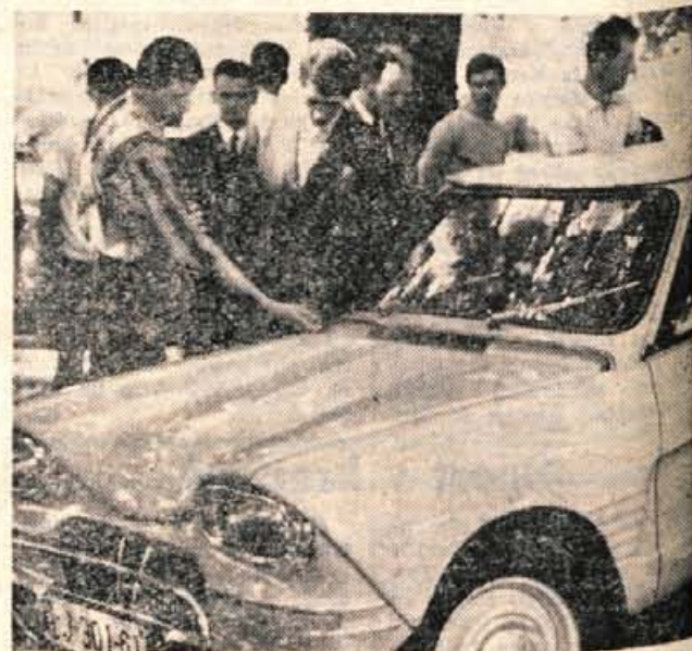
Na sejmišču v Kranju je vsako nedeljo dopoldne sejem rabljenih avtomobilov. Čeprav do pred kratkim tovrstnih sejmov v Kranju ni bilo, je zanj precejšnje zanimanje.