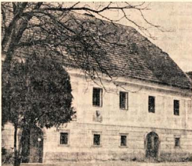
Rojstna hiša pisatelja dr. Frana Detela v Moravčah