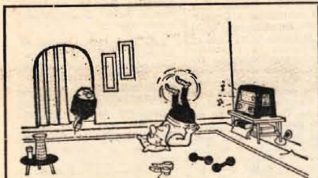
Zdi se mi, da imam novo čedno tajnico.

Je letos junija pridružil dečkom, ki so se šli kopat v Reno. Med kolanjem pa jih je zajel močan rečni tok in pet dečkov je utonilo. Enega od dečkov pa je pes Bob z zobmi zvelkel na obalo.