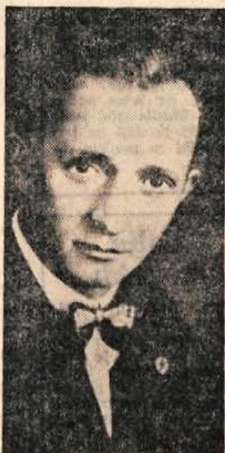
Jože Gregorčič 1903—1942