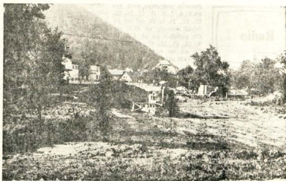
V teh dneh urejajo v Stražišču pri Kranju Delavsko cesto; uredili bodo odsek od potrošniškega centra do Škofjeloške ceste. Na tem odseku so zaradi razširite morali podreti tudi skedenj. Cesto preureja Cestno podjetje Kranj

odrasle kopalce. Nenadoma je potonila. Eden izmed kopalcev, ki je tudi sam slab plavalec, je to opazil in takoj obvestil ostale kopalce, kaj se je zgodilo. Učenka je začelo iskati pet kopalcev. Po več poskusih so jo naposled našli v globini 3 m. Eden izmed kopalcev, ki je študent medicine, ji je dal umetno dihanje in ji masiral srce vse do prihoda rešilnega avtomobila. Kljub vsem poskusom učenki niso mogli rešiti življenja. — sz