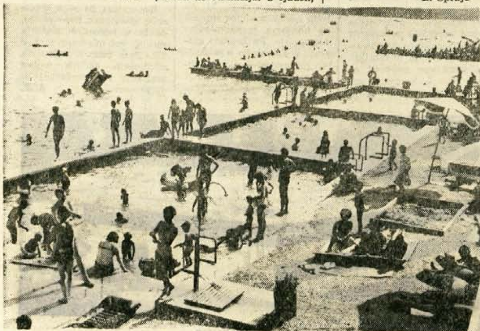
Z blejskega kopalnišča