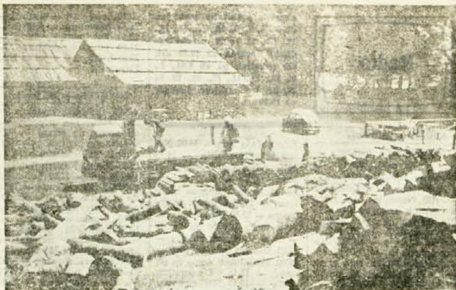
V domu na Jezerskem so predvidevali, da bodo še pred turistično sezono preuredili kočo in zgradili most, ki ga je ob lanskoletni poplavi voda odnesla. Vendar pa niso dobili denarja in tako je vse skupaj ostalo pri starem...

Razen tega je krajevna skupnost Mengeš med prodajalno vina in gostilniškim vrtom uredila zelenico, nasadili pa bodo še več lepote grmičevja, cvetja in okrasnih dreves. Ob zelenici pri Koločovski cesti bo urejeno novo makadamsko parkirišče za tovorne avtomobile, ki že po tradiciji prenočujejo v Mengšu. A. D.