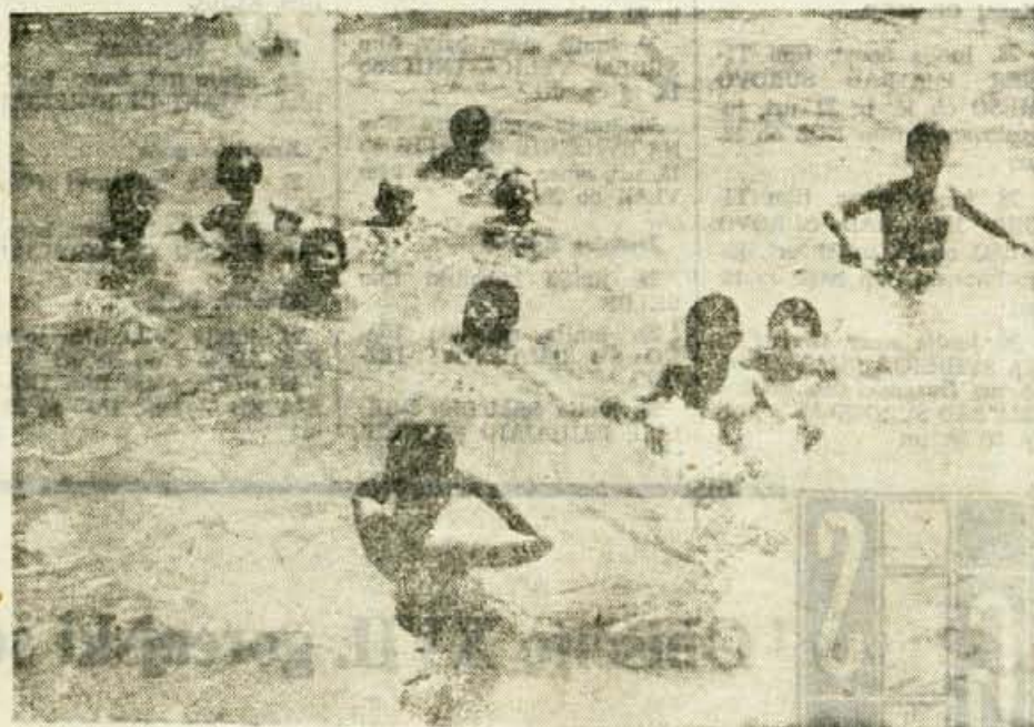
Kopalna sezona se je začela: