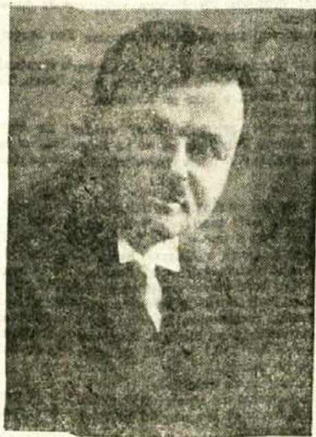
Prešernoslovec France Kidrič