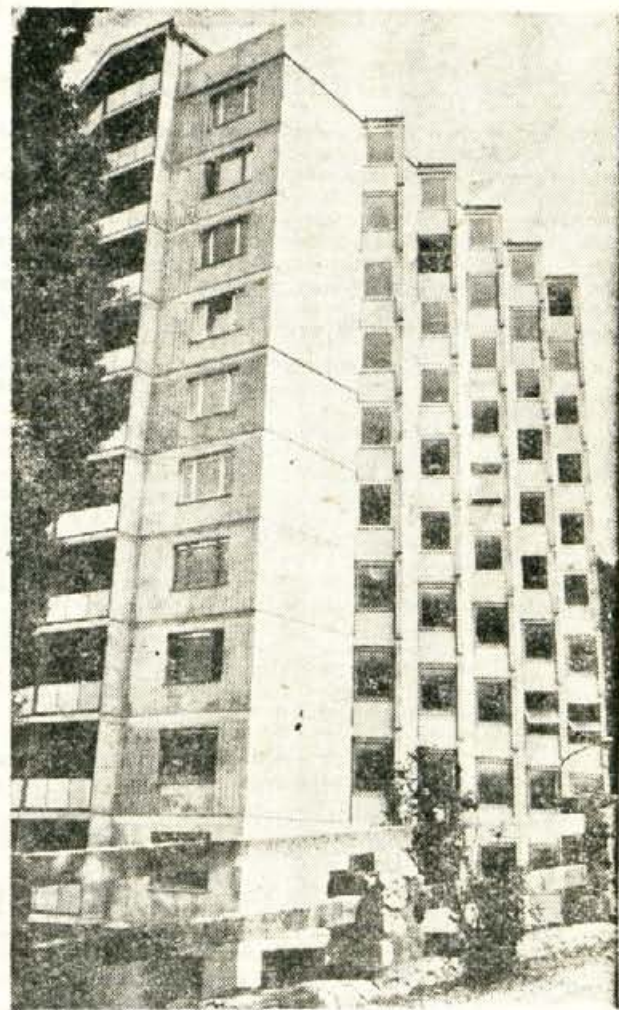
Konečno bo tudi tržiška stolpnica dograjena. S prvim septembrom bo predvidoma vseljiva. V stolpnici bo 58 stanovanj in trije lokali podjetij Murka Lesce, Tobak Ljubljana in SAP.

Splošni vtis turističnih delavcev in nas vseh, ki vsak dan opazujemo promet na naših cestah je, da je letos pri nas precej manj inozemskih avtomobilov. Vendar statistika govori drugače. Po podatkih zveznega zavoda za statistiko je prišlo v Jugoslavijo do začetka maja 2.610.000 inozemskih potniških avtomobilov, kar je 63% več kot lani, 11.400 avtobusov (11% več) in 75.800 motornih koles (14% več). Z vsemi temi vozili je priporočilo k nam 7.760.000 potnikov ali 69% več kot lani v tem času.