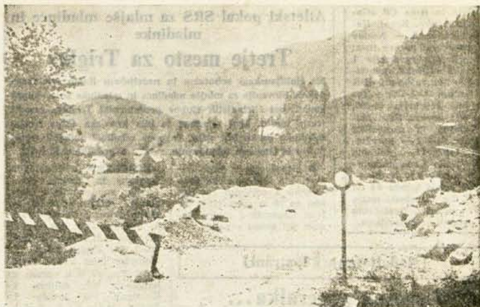
Cesta Sorica—Petrovo brdo je zaprta. Pred 10 leti so investirali v gradnjo te ceste okoli 100 milijonov dinarjev. Govora je bilo o transverzali Avstrija—Jadransko morje. In danes? Cesta je zaprta za ves promet in nemočno čaka svojega odrešenika.