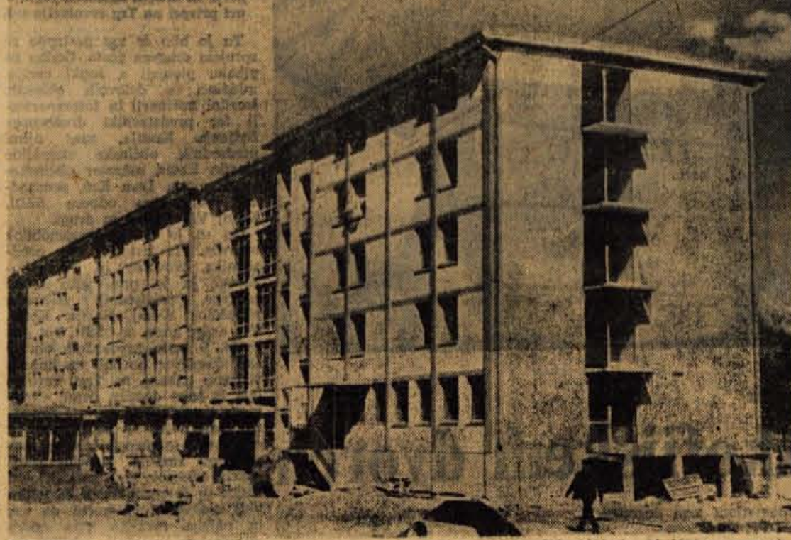
Dela samskega bloka kolektivna Tekstilindusa v Kranju v Strazišču se bližajo koncu. Mnogi delavci se tega veselijo, ker bodo tam dobili sobe, še več pa se jih veseli zato, ker bo tam urejena menza, ki bo lahko zadostila ne le zaposlene v tem kolektivu, marveč tudi drugo prebivalstvo tega dela Kranja

Tovarišica tajnica je med drugim izrazila tudi prepričanje, da bi bilo delo brez ustvarjalnega hotelega vseh organizacij in društve zelo otežkočeno. Za vse naloge, ki si jih je zastavila krajevna skupnost v Radovljici, bo potrebno sodelovanje in podpora vseh, ki skrbijo za vzgojo, varstvo, za kulturo in šport in za vse druge dejavnosti. Skrb za komunalne zadeve pa je po mnenju članov sveta KS v Radovljici leta na drugem mestu. Takšna ukupna tovitve bi bila za ta kraj na prvem mestu, saj najbolj preča vprašanja komunalnega značaja rešuje neposredno občinska skupščina ozira roma njeni organi.