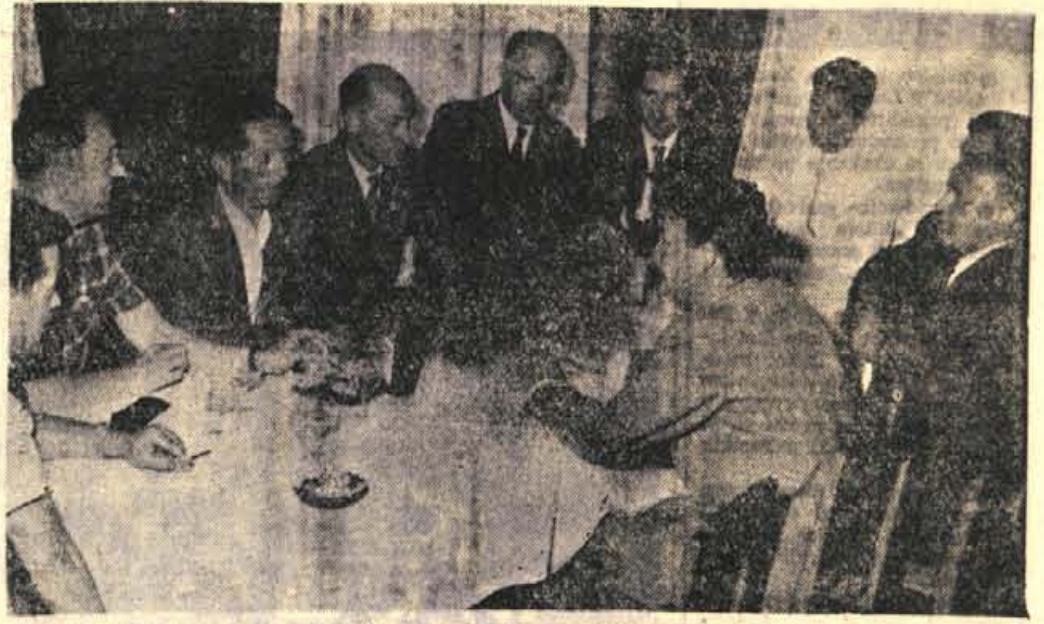
PLANICA, 22. JUNIJA — Včeraj popoldne je bil v Domu v Planici sestanek predstavnikov strelske organizacije Furlanije, Koroške in Gorenjske. Dogovorili so se za troboj strelcev omenjenih treh pokrajin, ki ga letos organizira okrajni strelski odbor Kranj. Troboj bo 25. in 26. avgusta letos verjetno v Ljubljani. Doslej se se gorenjski strelci srečali sami s strelci Furlanije. Letos pa so k sodelovanju povabili še strelce s Koroške. Na včerajšnjem sestanku so naši predstavniki predlagali sodelovanje tudi na drugih športnih področjih med vsemi tremi pokrajinami. Omenjeni troboj bo postal vsakoletna tradicionalna prireditev. Prihodnje leto ga bodo organizirali Korošci, za njimi pa še Furlani. — M. Z.