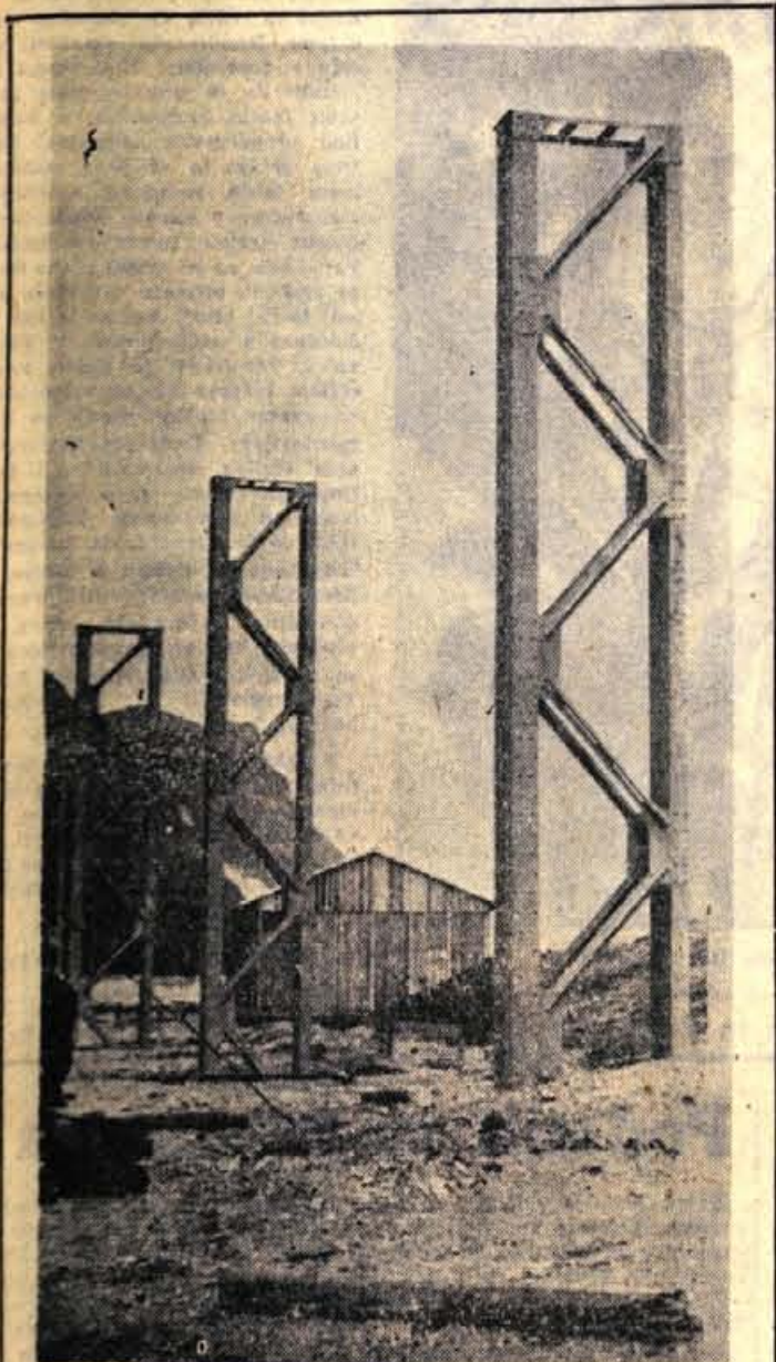
Prvi stebri železne konstrukcije za vzdrževalne hale pri novih valjarnah na Belškem polju na Jesenicah že segajo pod nebo. Z deli bo treba namreč pohiteti, zakaj prva oprema za valjarne bo začela kmalu prihajati in treba jo bo spraviti pod streho

Ko pa je izvedela, da nekaj poizvedujejo okrog njenih otrok o zvezi s kolonijo, je prišla na občino in se na vso moč sprla: »Kakšen odnos je to do otrok! Vsak vidi, da sta potrebna kolonije! Ali vam ni dovolj zdravnikova ugotovitev? Kaj je vprašujete?« se je budovala. Sosedje pa so tudi povedali, da je ponovno govorila okrog: »Tudi mi bomo imeli avto.« To je ugotovila komisija. Fantka sta zdaj že ob morju. V resnici sta tega potrebna. A vzrok tujim boleznem in bahavštvom, ob čemer mati ne vidi več lastnih otrok in njihovega zdravja. — K. Makuc