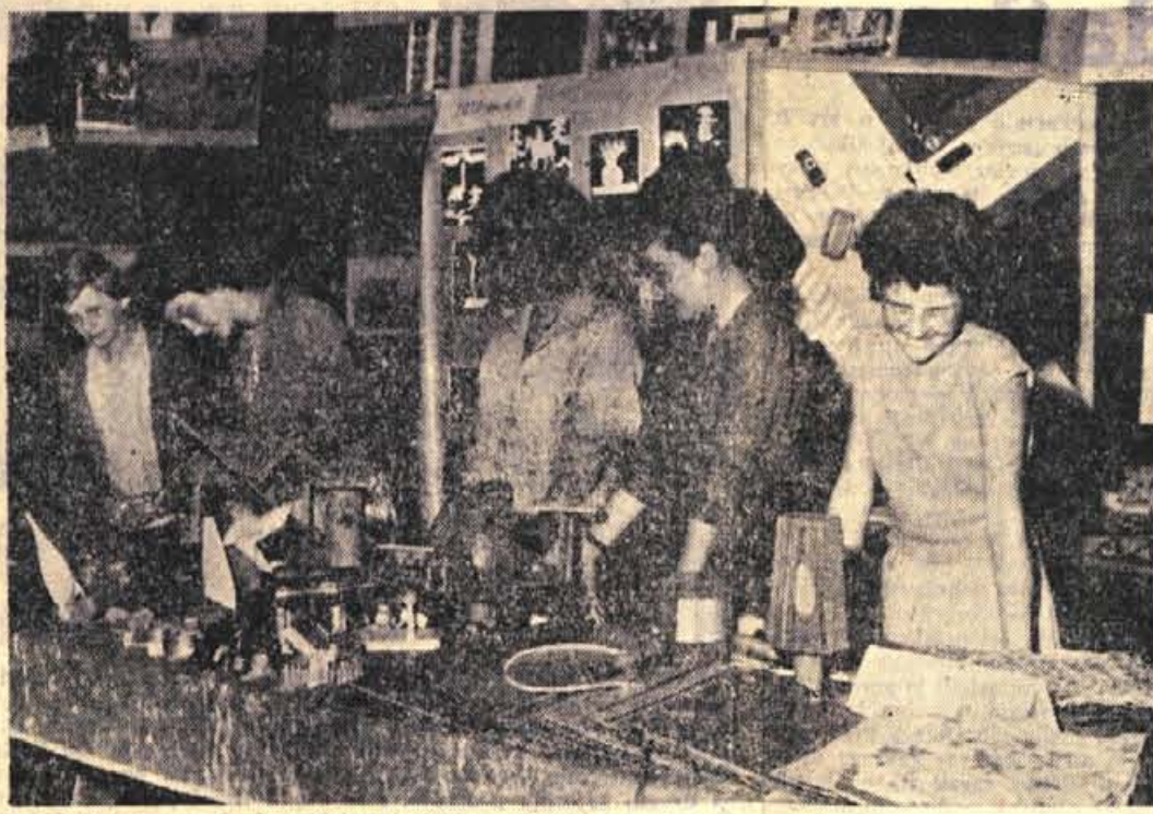
Tako kot v mnogih šolah so tudi učenci radovljiške osnovne šole priredili ob koncu šolskega leta razstavo svojih izdelkov. Razstavljeni izdelki pričajo o uspehu pouka tehnične vzgoje in gospodinjstva, razstavili pa so tudi risbe in najboljše šolske naloge na temo »Poznaš svoj kraj?«

Ponudbe je poslati do 1. julija 1962 na kadrovski oddelk tovarne.