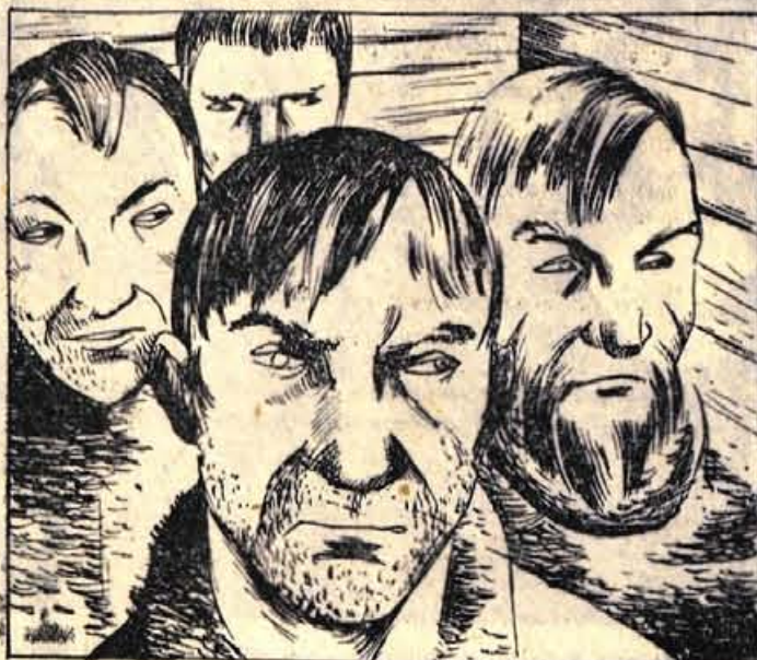
79. Prebivalci - Dveh koč- so sestavljali poroto. Jaz glasujem: Krivi! - se je zadržal trikrat. Tedaj se je domislil Krištof stare zvišaje iskalec zlata. Imam zalto, je rekel. Od kod? - so vprašali. Ob reki Steward! - je sledil odgovor. Obravnava so prekinili. Začela se je stampea!