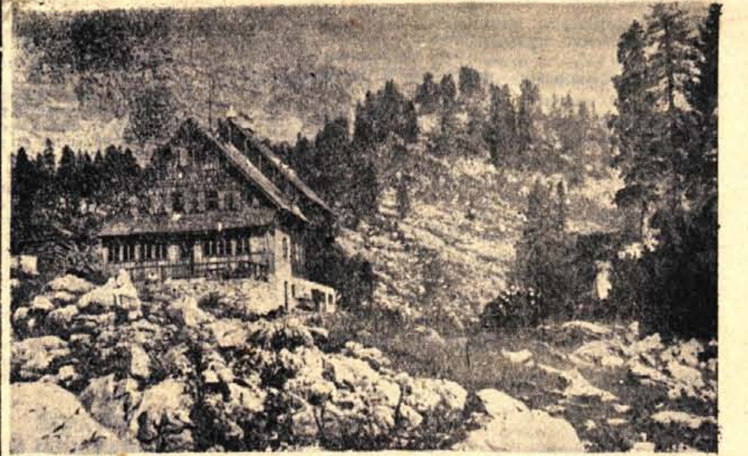
Motiv s TRIGLAVSKEGA NARODNEGA PARKA: L. oča pri Sedmerih triglavskih jezerih

Kar pomislite, koliko cvetja bi odnesli številni obiskovalci, ki jih je na primer lani nad 6.000. In teh obiskovalcev bo vedno več! In vsakdo rad odnese domov nekaj cvetja. Alpsko cvetje raste v težkih pogojih, zato je popoln-