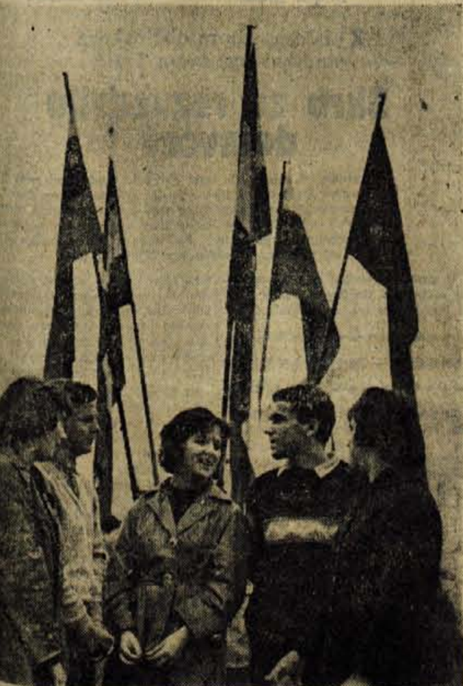
V sredo je bil z otvoritvijo X. mladinskega festivala na Jesenicah začetek enomesečnih prireditev v počastitev Dneva mladosti in 20-letnice revolucije

O podobnih praznovanjih in akademijah nam poročajo tudi iz ostalih krajev Gorenjske.