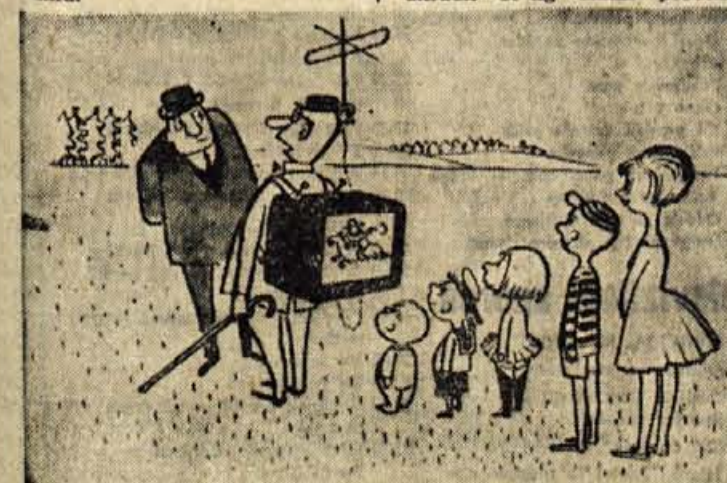
„Po zadnji vojni grede otroci samo fako še na spreho...“

Na fizikalnem inštitutu Tehniške visoke šole v Göteborgu so izdelali gibljivo cev za prenos slik. V njej je preko 30.000 zelo tankih steklenih cevčic, ki merijo v premeru le 50 mikronov, torej toliko, kot nit v ženski nylon nogavici. Vse cevke imajo dvojne stene, iz dveh vrst stekla z različnima lomnima količnikoma. Po vsaki izmed cevčic se svetloba širi tako, kot to določa popolni odboj — odbija se na meji med obema vrstama stekla. Na drugem koncu cevi nastane zato slika, ki jo sestavlja preko 30.000 bolj ali manj svetlečih točk, torej slika, ki po kvaliteti nekoliko ustreza sliki na sprejemniku.