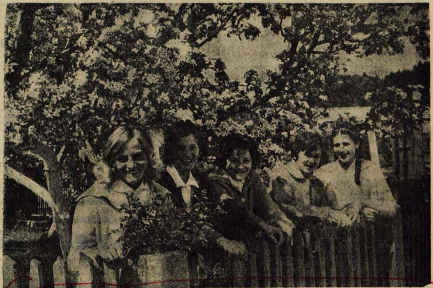
Pred današnjo Okrajno konferenco Socialistične zveze delovnega ljudstva