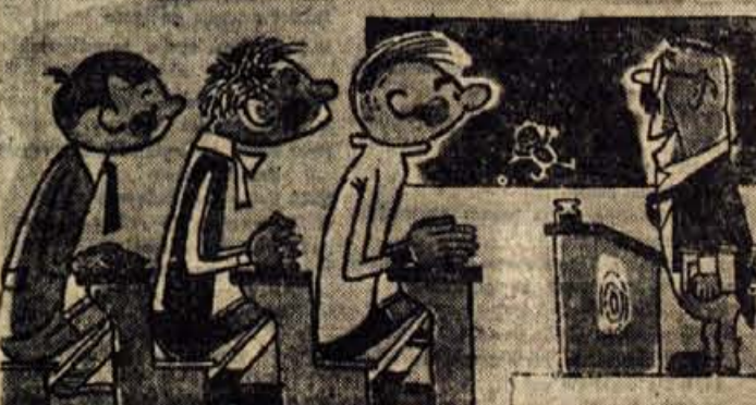
„Dobro jutro, otroci! — Sedela...“

Uredništvo „Glasa“ je za reševalce prvomajske nagradne skandinavke pripravilo 10 dcnarnih nagrad, in sicer: 1. nagrada 3.000 dinarjev 2. nagrada 2.000 dinarjev 3.— 5. nagrada po 1.000 dinarjev 6.—10. nagrada po 500 dinarjev Rešitve pošljite na uredništvo do vključno 11. maja 1961, javno žrebanje pa bo v prostorih uredništva v petek, 12. maja ob 16. uri.