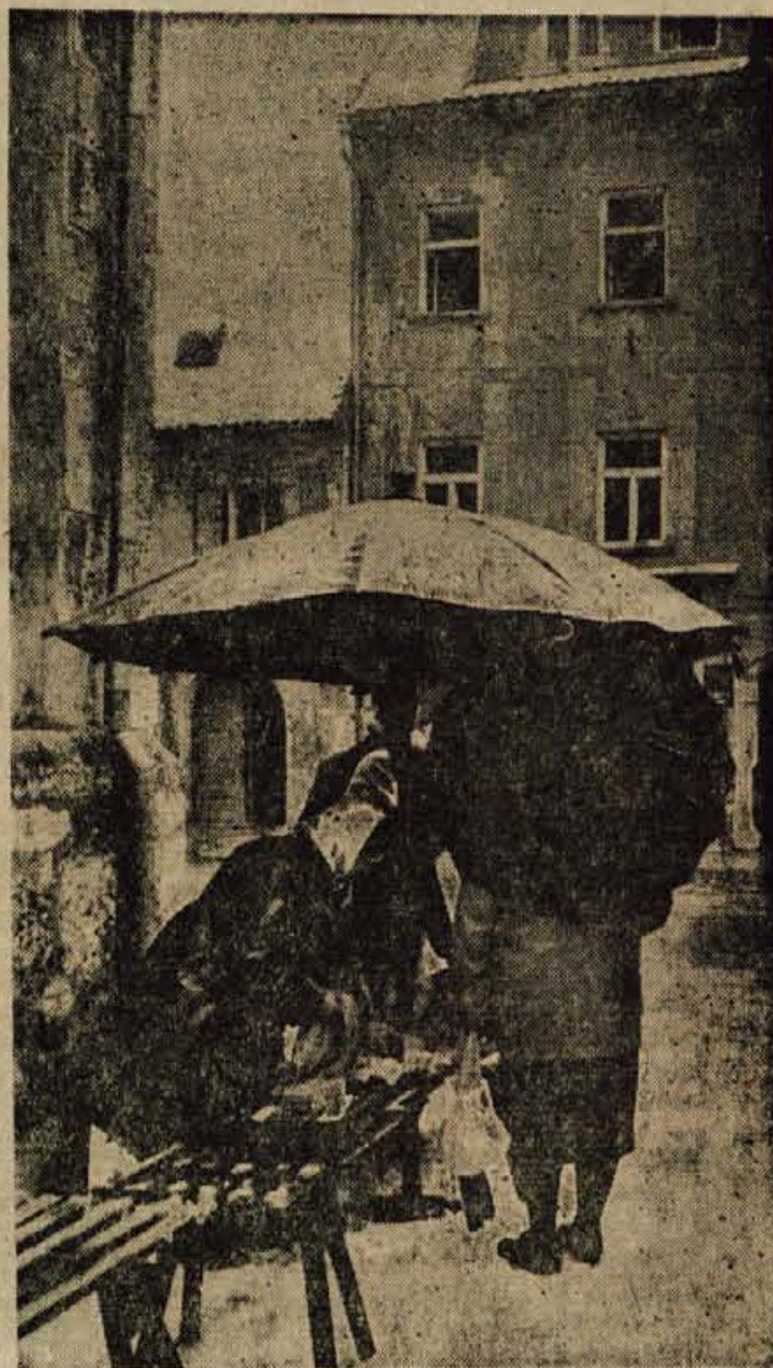
Takšna kot pred leti in desetletji je še vedno kranjska tržnica. - O gradnji nove tržnice se govori že nekaj let, vendar je ostalo še vedno vse pri starem. Medtem pa so Kranjčani prehiteli že Jesulčani in Skofjeločani. V obeh mestih imajo sodobno urejene tržnice in še celo Tržičani imajo že nekaj let tržnico pod streho. V Kranju pa vse kaže, da se tega problema lotujejo skrajno malomarno. Ze več kot pred enim letom so sicer začeli z gradnjo nove tržnice, vendar so gradnjo kmalu prekinili, tako da je danes ostalo tudi isto, kar je že bilo narejenega, bolj ali manj neuporabno, saj je marsikaj uničil že zob časa, kot pravimo