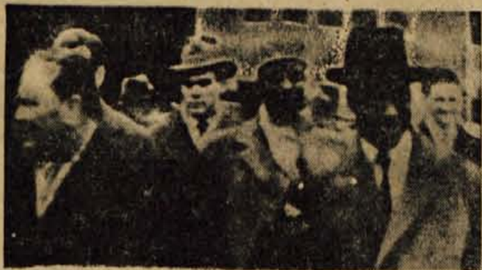
Predsednika Gvineje in Jugoslavije med ogledom tovarne »Rade Končar«

Iz Gornjega grada na Radičevem trgu so predsednik Gvineje in predsednik republike Josip Tito ter spremstvo krenili na obisk v tovarno »Rade Končar« v Zagrebu. Razen tega si je Sekou Toure