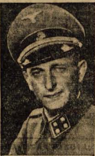
SS-Obersturmbannführer ADOLF EICHMANN