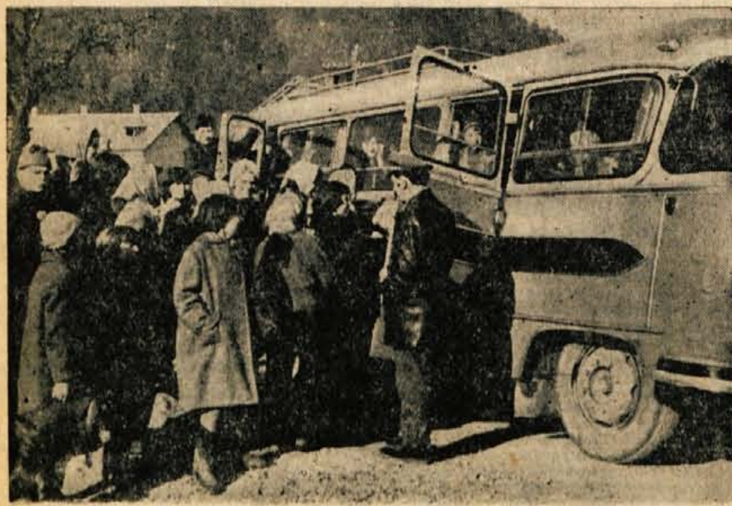
Avtobusni promet postaja vse močnejši in predstavlja pomembno potrošno dobrino državljanov. Prav zato se večkrat slišijo razne pripombe in sugestije za odpravljanje posameznih težav. Ki nastajajo v avtobusnem prometu. Na zadnji seji Občinskega ljudskega odbora v Radovljici so sprejeli priporočilo, naj bi v okrajnem merilu skušali odstraniti zlasti nekatere neskladnosti med posameznimi prevoznimi podjetji, kar po njihovi oceni zmanjšuje kvaliteto uslug in marsikje ustvarja celo nezadovoljstvo potnikov. Hkrati se dni veliko ljudje govorijo o avtobusnem prometu spriči novih vozni olajšav za šolsko mladino, kar sedaj urejujejo občinski ljudski odbori. Na sliki: Vsakdanji motiv iz avtobusne postaje v Kranju.

Eden izmed govornikov se je lotil tudi dela klubov OZN. Ti še posebej v sedanjem času, glede na »črne« razmere v svetu, dobijo (Nadaljevanje na 2. strani)