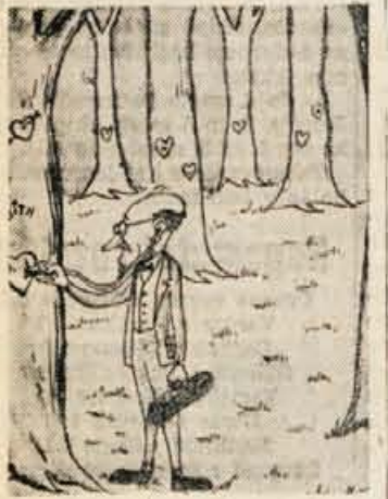
Specialist za srčne boleznai

Podjetni angleški redarjski gostilničar je postavil ob avtomobilski cesti pri Chichesteru jajčni avtomat. Vanj je treba spustiti 2,5 šilinga in avtomat ponudi 6 »garantirano svežih« jajc. Ta avtomat ne uporablja le avtomobilisti, ampak pri njem radi kupujejo tudi gospodinjice iz bližnje okolice.