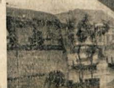
Kinovaljca, 18. decembra - Včeraj je avtobusno podjetje »Transiturist« iz Sk. Loke v Radovljici odprlo novo avtobusno postajo. To je že drugi tovrstni objekt, ki ga je zgradilo to podjetje, prvega so izročili namenu že pred tremi leti v Skofji Loki - (Poročilo berite na 2. strani)

V Sovodnjem so na Inicijativo SZDL člani opravili 750 prostovoljnih ur in nabrali 40 kub. metrov lesa, sodelovali pa so tudi pri gradnji vodovoda. V. R.