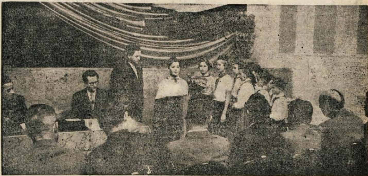
Ob praznovanju v Skofji Loki

Ob vsej tej družbeni skrbi za čim boljše novoletno praznovanje naših otrok pozivamo vse starše, da tudi oni poskrbe, da bodo njihovi otroci res deležni vseh prireditvev, ki jim jih pripravljajo razne organizacije. Zato naj pripeljejo otroke k prireditvam in zabavam, istočasno pa naj jim doma pripravijo toplo novoletno praznovanje, kjer naj otroci z medsebojnim obdarovanjem občutijo vso radost in srečo.