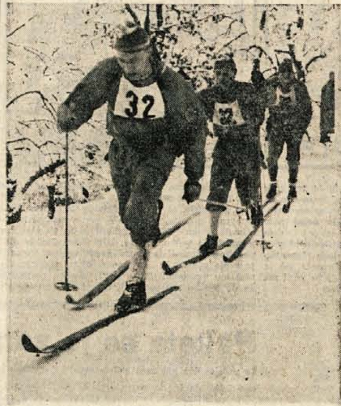
Z lanskoletne prireditve »Po stezah partizanske Jelovice«

Cesta JLA 8 proda sledeča razhodovana osnovna sredstva: TOVORNI AVTO Saurer v razstavljenem stanju STRUŽNICO do 1000 mm del. širine Ponudbe poslati na gornji naslov