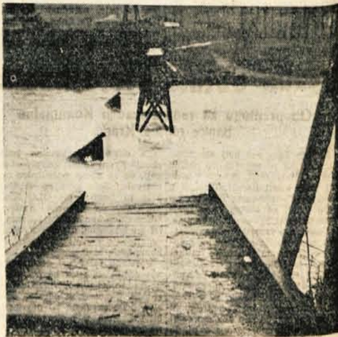
Zaradi deževja v zadnjih dneh so prenekaletni kraji ob vodnih strugah spet utrpeli precejšnjo škodo. — Naša slika prikazuje, kako je narasla Sava odnesla most pri tovarni čevljev kranjske »Planke«

Kaj je namen te beležke? Kritizirati strežno osebo? Ne, še zdaleč ne! Tudi upravo ne mislim, čeprav sem to uvodoma poudaril. Pač pa bi rad dal pameten nasvet, ki se lahko uresniči. Ob nedeljah in praznikih naj bi imele restavracije posebno nastavljeno honorarno strežno osebo za tri ali štiri ure na dan. S tem bi po eni strani zadovoljili goste, po drugi strani pa razbremenili stalno nastavljene strežnice. Nikakršne težave ne opravčujejo obrate družbene prehrane, da puščajo goste čakati po celo uro in tudi več na kosilo. Zlasti ne, ko bi se to »ozkogrlo« dalo odpraviti. —P-K