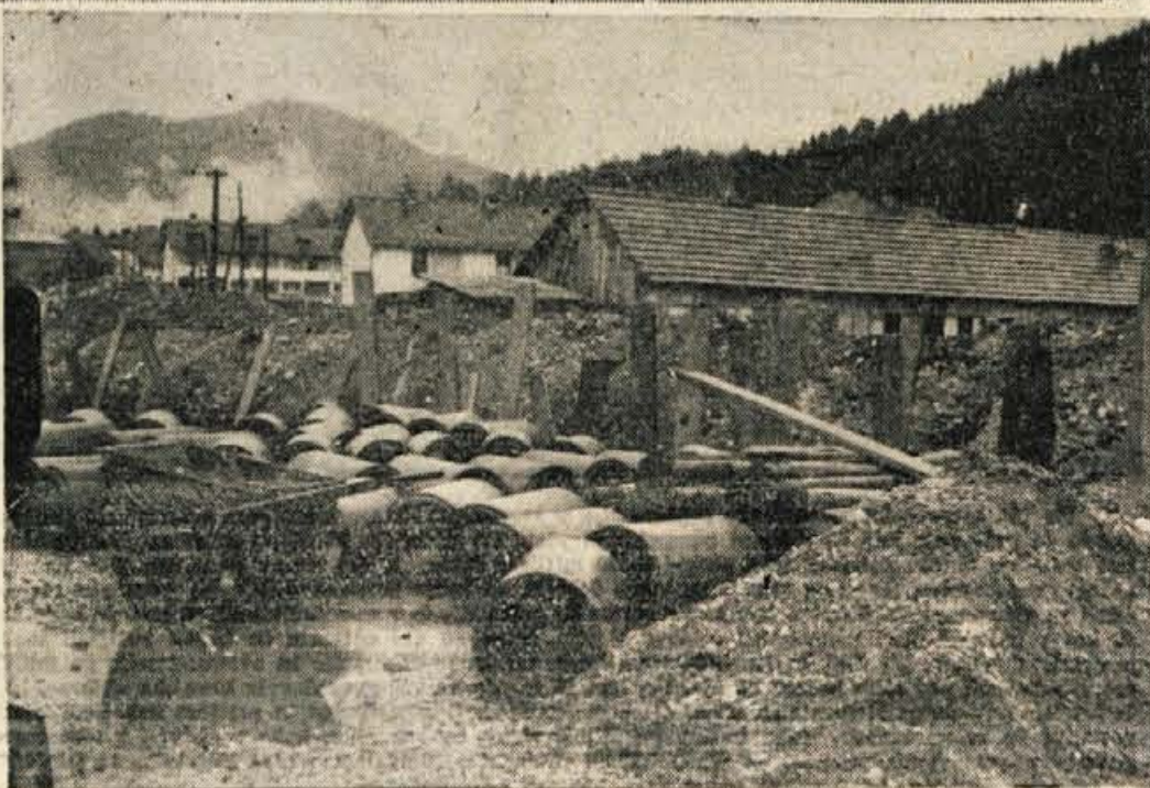
Preskrba z živili je v Stražišču že nekaj let morda najbolj pereč problem. Pred kratkim pa se je to vprašanje končno le premaknilo z mirne točke, kot pravimo. Slika prikazuje začetna dela pri gradnji novega poslopja — potrošniškega servisa

Zaradi take vloge sil Zdruzenih narodov v Kongu so doslej odklicale svoje vojske izpod zastave ZN v Kongu: Gana, ZAR, Jugoslavija in Cejlon. V tem se jim bodo nedvomno priključile tudi nekatere druge azijsko-afriške države. Predsednik republike Josip Broz-Tito je v zvezi s položajem v Kongu poslal pretekli teden posebno pismo poglavarjem držav oziroma predsednikom vlad ZAR, Gane, Guineje, Indonezije in Etiopije. Jugoslovanski državni sekretar za zunanje zadeve Koča Popović in zunanji minister ZAR Mahmud Fawzi pa sta te dni odpotovala na sedež OZN v New York, da bi osebno sodelovala pri reševanju tega, danes najbolj perečega mednarodnega problema.