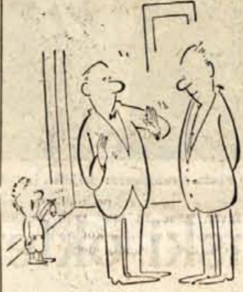
Očka, tu je tisti, o katerem pravkar govoriš!