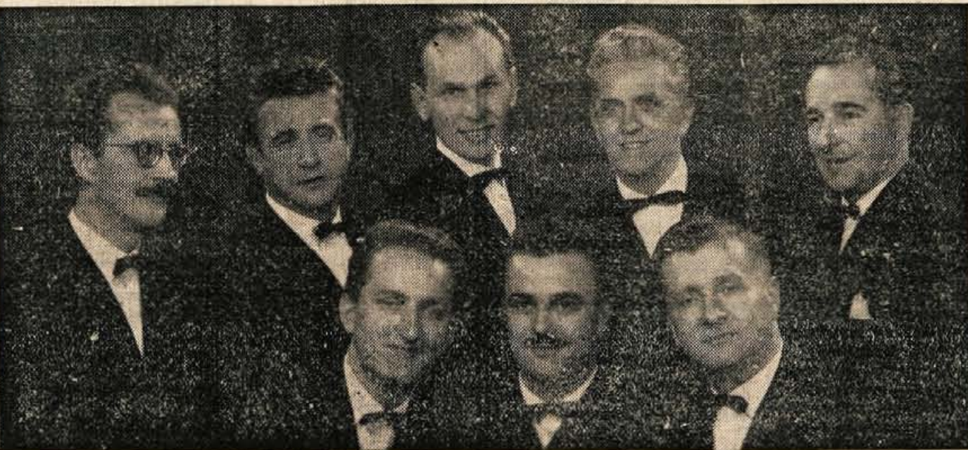
V torek se obeta Kranjčanom prijeten kulturni večer — obiskal jih bo spet »Slovenski oktet«

»ŽIVE NAJ VSI NARODI, KI HREPENE DOČAKAT DAN, DA KODER SONCE HODI, PREPIR IZ SVETA BO PREGNAN...«