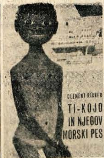
Naslovna stran Richerjeve knjige »Ti-Kojo in njegov morski pes«

BERNARDINE — Po premieri v »sejmskih dneh« bo ta ameriški film v prihodnjih dneh na sporedu v Kranju. O filmu smo na kratko poročali že tedaj. Film ob zabavni muziki pevca Boona hoče govoriti, vsaj tak občutek imam o neki višji ameriški mladini. Naj samo ponovim tiste svoje misli, govoriti o mladih ljudeh, ki sanjajo o tehnični osvajanju deklet, vrtoglavo dirkajo z motornimi čolni, se vozijo na ljubezenske sestanke z avtomobilom, ter se zaradi nesrečne ljubezni javljajo prostovoljno k vojakom — preveč ceneno! Če je film imel namen zabavati — ni zabaval; če je hotel nekaj več povedati o ameriški mladini — ni povedal. Seveda pa bodo ob dobri muziki mnogi gledalci zadovoljni odhajali iz dvoran.