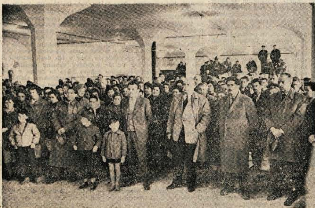
KRANJ - Tako kot mnogi, je tudi delovni kolektiv tovarne Sava v Kranju dostojno proslavil naš največji praznik - Dan republike. V obratu II so se na proslavi zbrali številni člani kolektiva. Na tej proslavi so sodelovali s peštrim programom gojenci kranjske glasbene šole, mladinski pevski zbor in recitatorji. Ob tej priložnosti so na Gašjeju odprli tudi novo sodobno urejeno delavsko restavracijo, v kateri je prostora za 100 ljudi. Namenjena je predvsem za tople obroke delavcev. Postregli pa bodo tudi s kosilom in večerjo. Delavsko restavracijo je tovarna Sava zgradila popolnoma z lastnimi sredstvi in so porabili za to 5 milijonov dinarjev

Nova ustava bo nedvomno izredno pomemben dokument našega družbenega razvoja. Omogočila bo razviti in poglobiti vse tiste elemente, ki karakterizirajo našo novo socialistično skupnost.