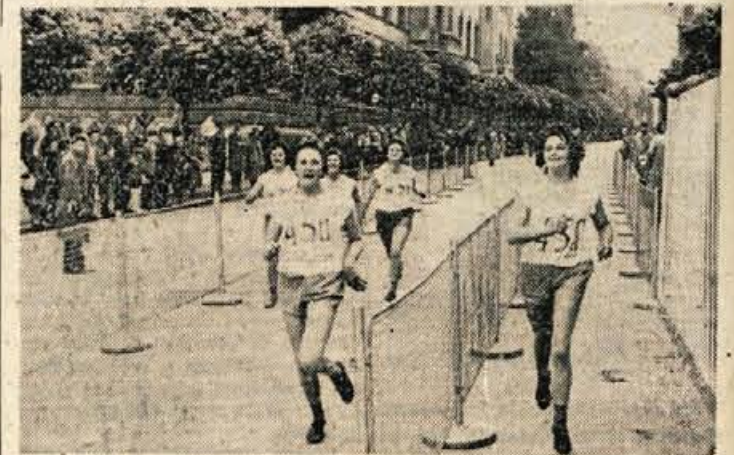
Z lanske prireditve -Ob žici okupirane Ljubljane-

Vsi tekmovalci bodo morali biti zdravniško pregledani, prireditev pa je pripravil tudi tokrat za zmagovalne ekipe lep darila.