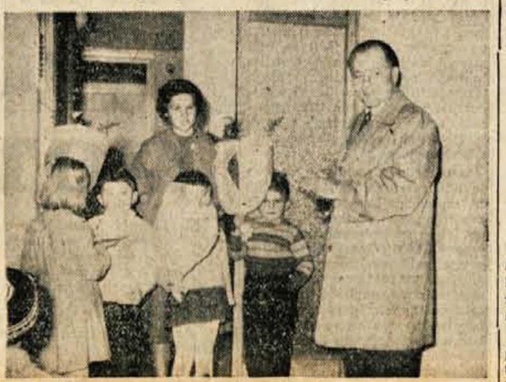
Med otvoritvijo otroškega zavetišča na Ravnah pri Trziču

Mnenje uslužbenca pa je, da bi se moral vsak zdrav človek odzvati humanemu dejanju, ker lahko 3 del krvi reši življenje sočloveku.